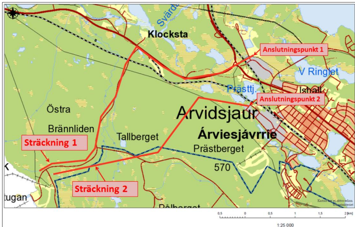
Figur 1. Två alternativa sträckningar för dragning av vatten- och spillvattenledningar; "sträckning 1" respektive "sträckning 2" med dess inkopplingspunkter 1 respektive 2.

Två alternativa sträckningar för dragning av vatten- och spillvattensledningar har studerats. Sträckningarna är markerade med rött i figur 1 nedan.