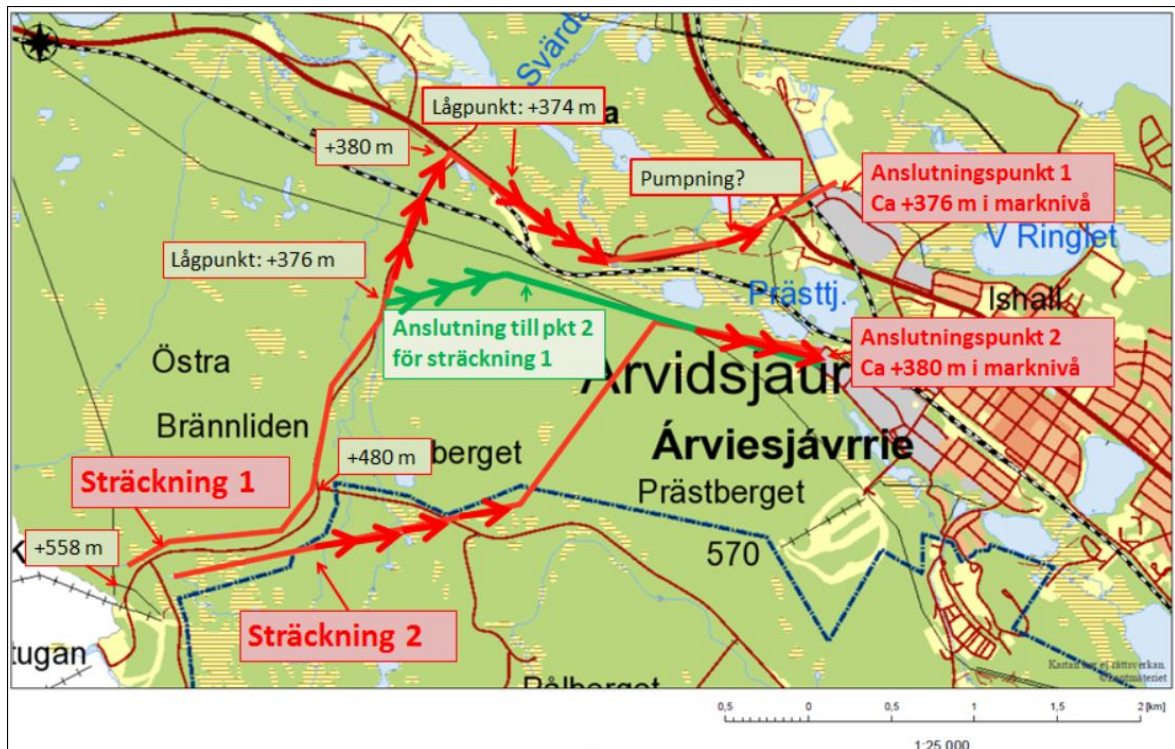
Figur 2. Var längs sträckan som pumpning av avlopp/trycksatt avlopp (fetmarkerade pilar) kan komma att krävas för Alternativ A. Placering av pumpstationer blir i lågpunkterna innan tryckavlopp. Några ungefärliga plushöjder för marknivåer är angivna i figuren.