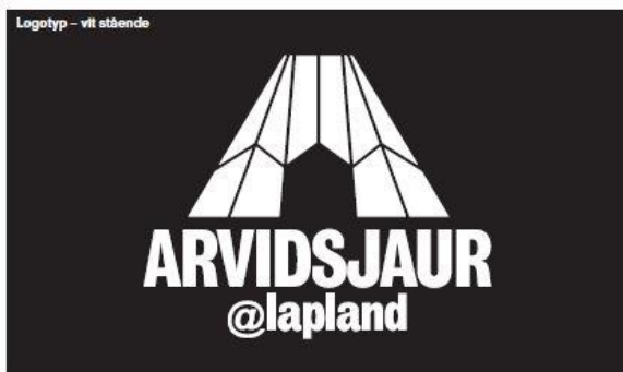
Logotyp – vitt stående