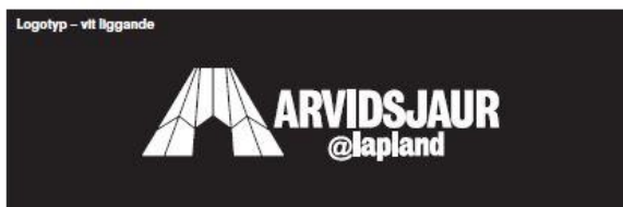
Logotyp – vitt liggande