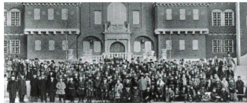
Svenska Samernas Landsmöte februari 1918