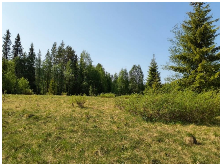
Äldre ängs-/åkermark som kantas av yngre barrblandskog.