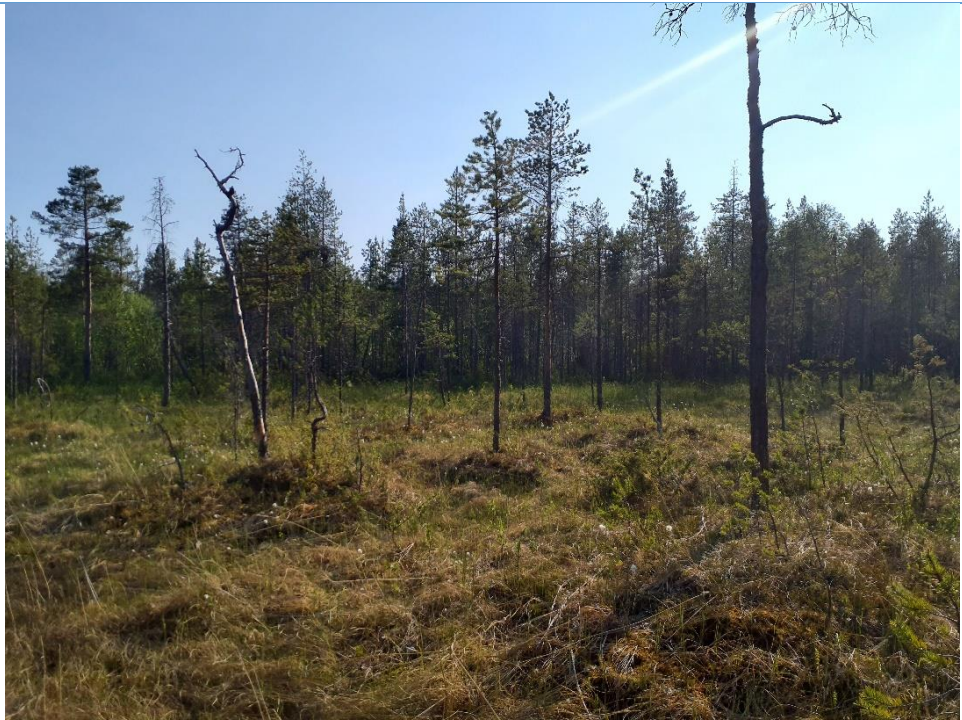
Öppen våtmark i öster.