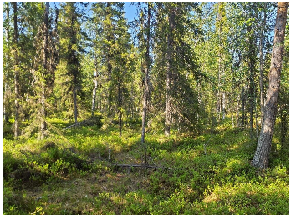
Barrblandskog på fuktig/ frisk mark.