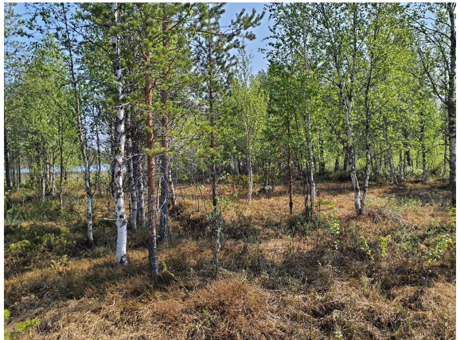
Dikad och igenväxande våtmark i norr.