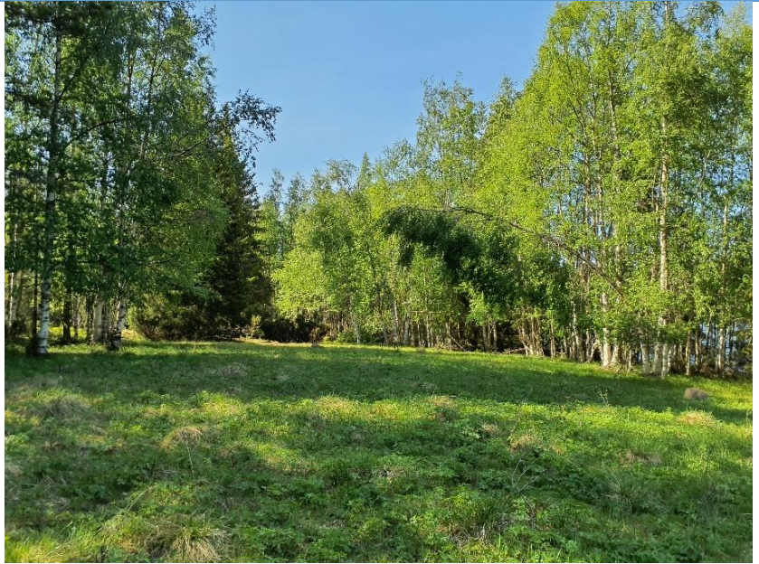
En av de äldre ängs-/betesmarker västerut.