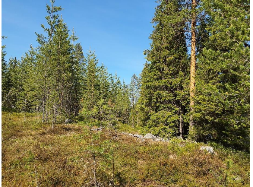
Tallproduktionsskog i olika åldrar, nordöstra delarna av tomten.