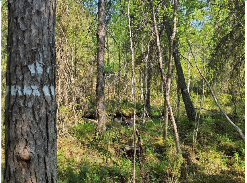
Sumpskog intill bäck, naturvårdsavtal.