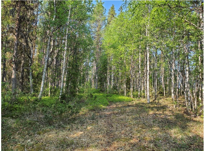
Tallproduktionsskog med stråk av björk.