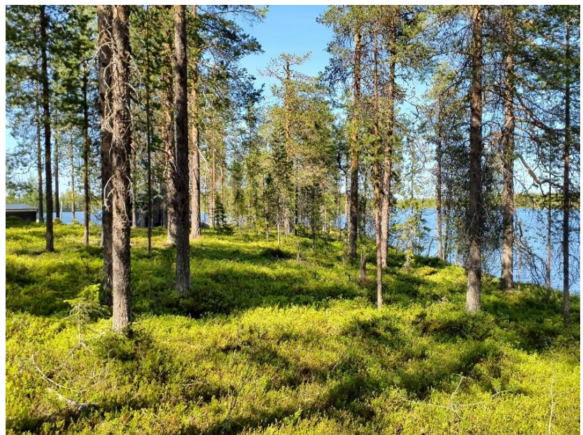
Miljöbild från tomt i nordöst mot vattnet.