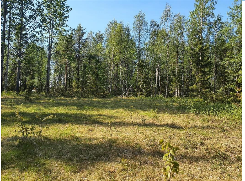
Äldre igenväxande ängs-/betesmark.