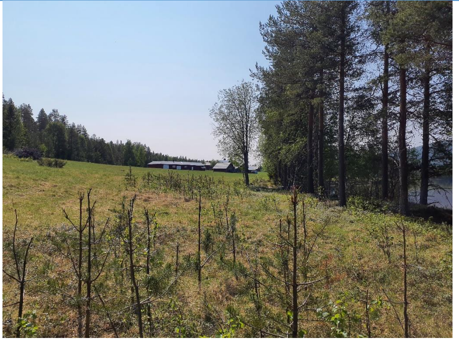
Åkermark som dominerar den norra tomten.