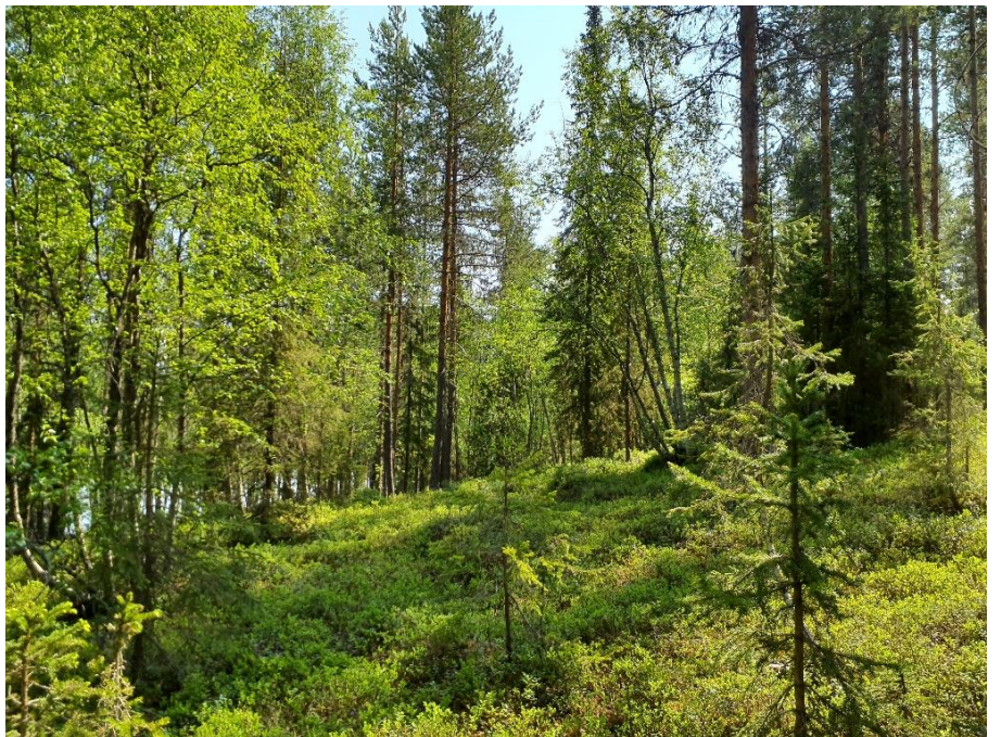
Plockhuggen tallskog med viss naturlig dynamik och skiktning på den södra tomten.