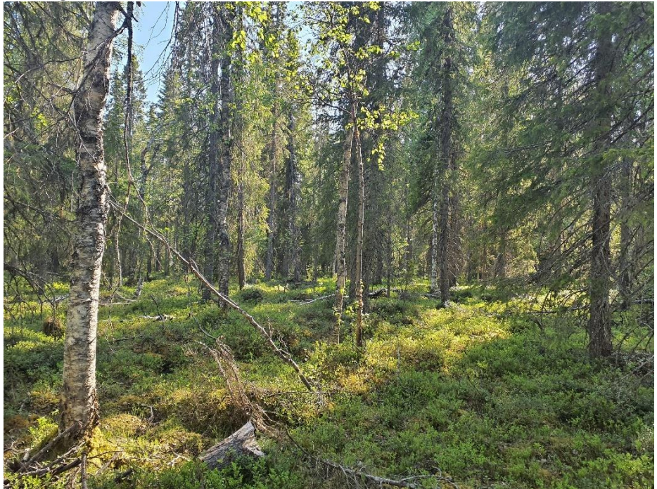
Återigen frisk, till viss del sumpig granskog västerut.