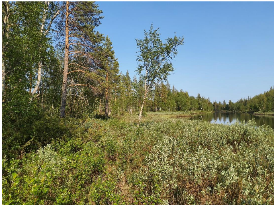
Vide, en och lövträd närmast vattnet.