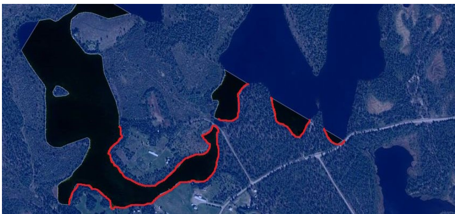
Figur 1. Områdena i Nyvall

Under utställningen av översikts- och tillväxtplanen inkom förslag om LIS-områden i Nyvall, se bilden nedan. Områdena i Nyvall ligger inom ett område som är utpekade som av riksintresse för rennäringen då det bedömts utgöra ett kärnområde för Mausjaure sameby. Kommunen var då i kontakt med berörd sameby (Mausjaure) som sa nej till föreslaget LIS-område.