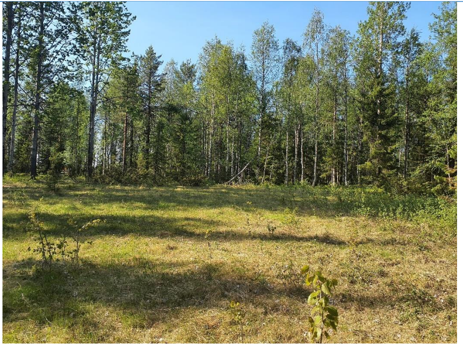
Äldre igenväxande ängs-/betesmark.