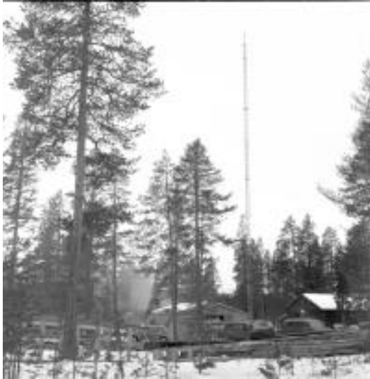
Radiomast byggs i Arvidsjaur.

Radiovågor är ett naturfenomen som ligger bakom allt från mobiltelefoner och wifi till fjärrkontroller och satellit-tv. Etern är fylld av osynliga budskap och man kan välja vilka man vill fånga upp, eller sända.