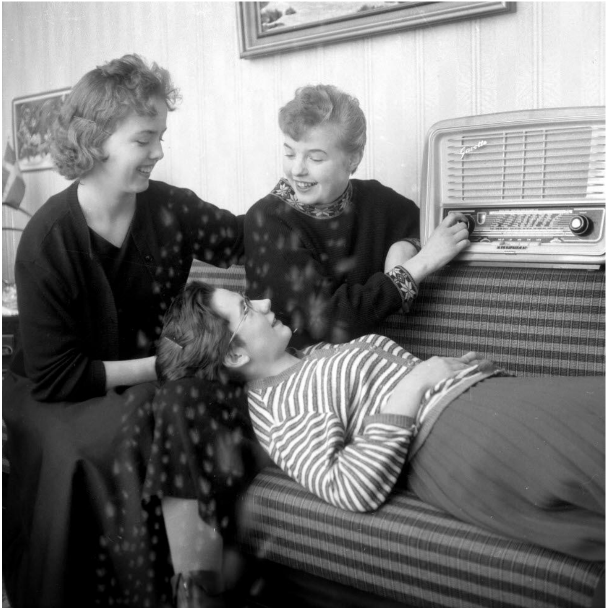
Laukerungdomar lyssnar på radio 1957.