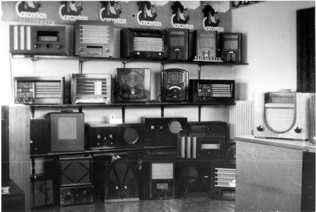
Holmboms radio, interiör.