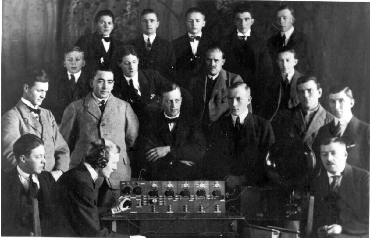
Sveriges första radioamatörer: Arvidsjaur's radioklubb, 1923.