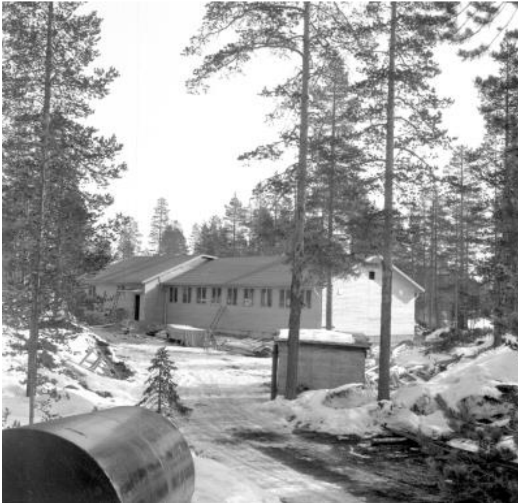
Radioverkstaden i Arvidsjaur byggs i april 1960.

När man pratar om en radio menar man ofta en apparat som tar upp utsändningar av radiovågor på de så kallade FM- och AM-banden. Men radio används också på många andra sätt vid kommunikation. Tack vare radiovågor kan man se på tv, prata i mobiltelefon och använda trådlös uppkoppling. Det är samma typ av radiovågor som värmer mat i en mikrovågsugn som en fartygskapten kan använda för att se i dimma med i sin radar. Alla elektriska apparater kan göra radiovågor. Därför måste de skärmas av så att de inte stör radioapparater. Om en mobiltelefon ligger nära en högtalare kan man höra hur den kommunicerar med mobiltelefonsystemet. Försök själv: Ring upp telefonen så hörs det tut-tut-tut-tut i högtalaren redan innan telefonen ringer. Det är datainformation som telefonen sänder för att koppla upp samtalet. (Källa: Tekniska museet.se)