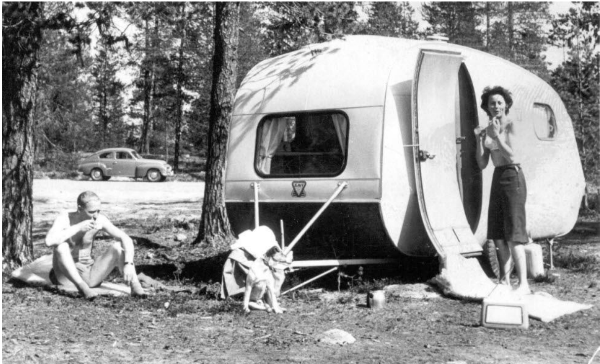
Camping i tallskogen i Arvidsjaur verkar gemytligt och självklart finns transistorradion på plats.