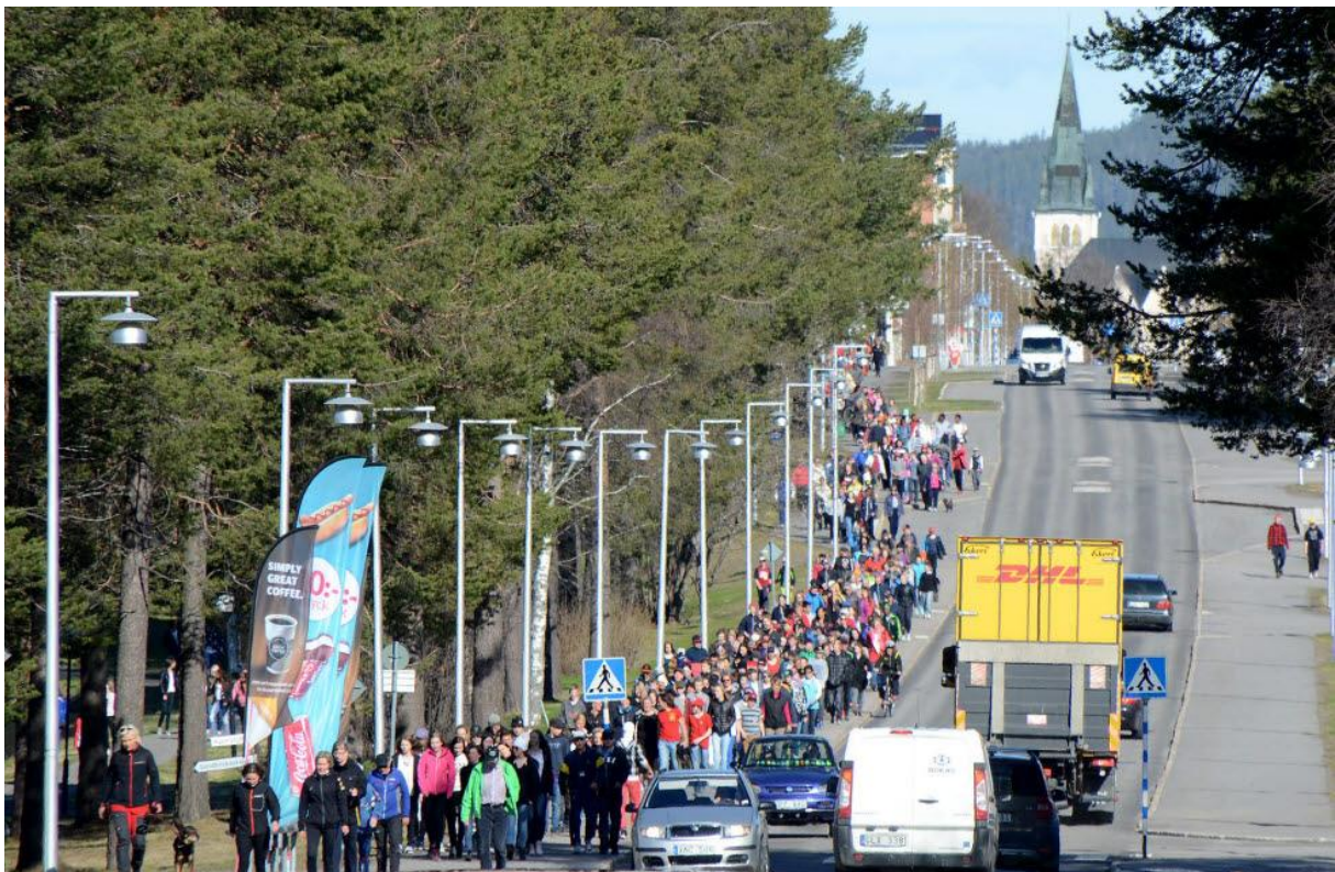
Radiomotion. Motionstävlingen "Radioaktiv" anordnades av P4 Norrbotten under flera år i länet. Arvidsjaur deltog frekvent i tävlingen, med gott resultat.