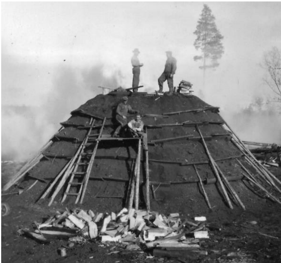
Kolning i Stickudden i Akkavare.