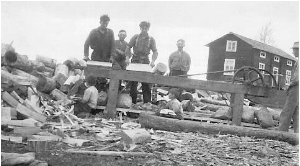
Takspånstillverkning i Akkavare. Man sågade träspånbitar som lades i olika skyddande lager på taken.

En råoljemotor drog takspånshyveln. Två personer, oftast barn, satt alltid vid sågen och plockade upp spånen vilket visas på bilden.