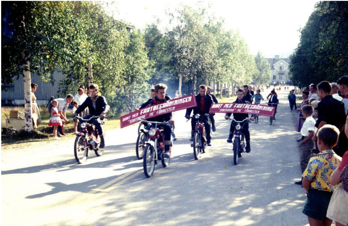
"Bort med fartbegränsningen, snuten mé förresten!". Mopeddemonstration på Stationsgatan. Förmodligen ingick mopeddemonstrationen i Idrottsmässans festtåg.