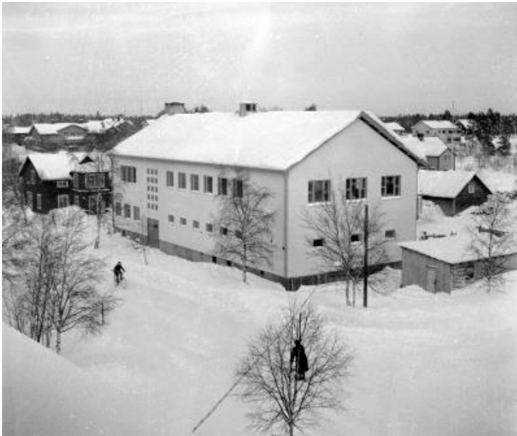
Telegrafister i Televerkshuset på Stationsgatan 1950-tal.