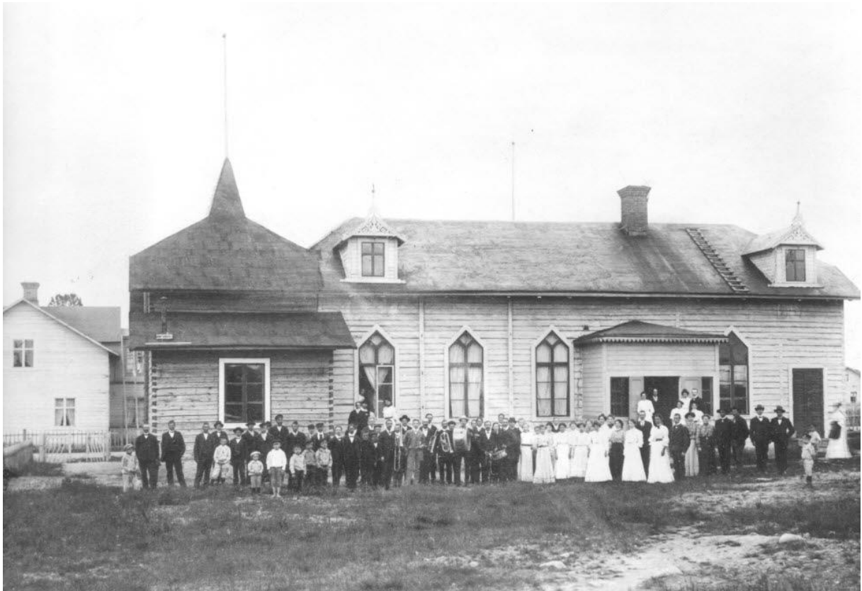
Stationsgatan 1908. Nykterhetslogen Polcirkeln 1702, samlade till möte. Bilden är tagen på gårdssidan av gamla föreningshuset som låg vid Stationsgatan.