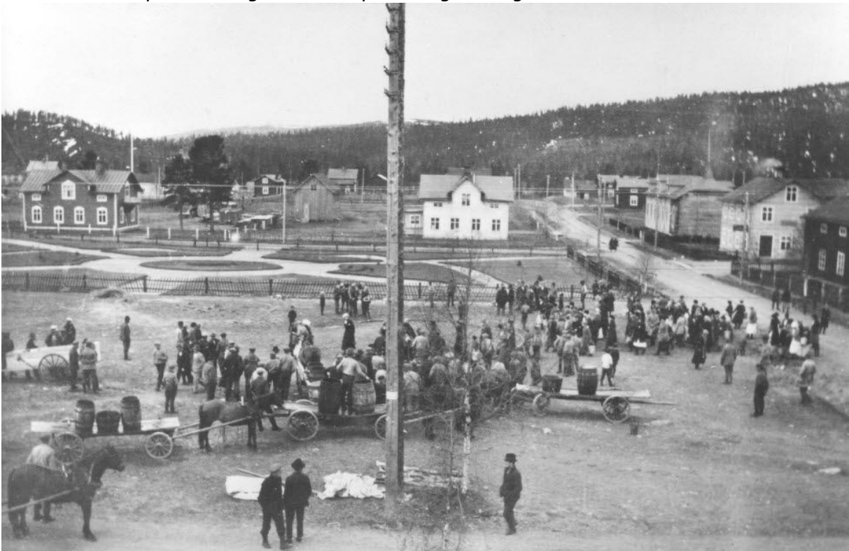
Bilden tagen från Storgatan ner mot Köpmantorget. Vägen till höger är Stationsgatan. Vid tidpunkten har Arvidsjaurbor brandövning på Köpmantorget, 1922. Det stora vita huset bakom parken (obs, ännu ingen Johanna i parken) var vid sekelskiftet avsedd som Lantmätarbostad. Arvidsjaur's första sjukstuga inrättades senare i huset; 1 november 1908. Det var en stor dag för kommunens invånare. Den "nya" sjukstugan byggdes senare på Högströmsvallen och var inflyttningsklar 1924 (på samma tomt som nuvarande Hälsocentralen).