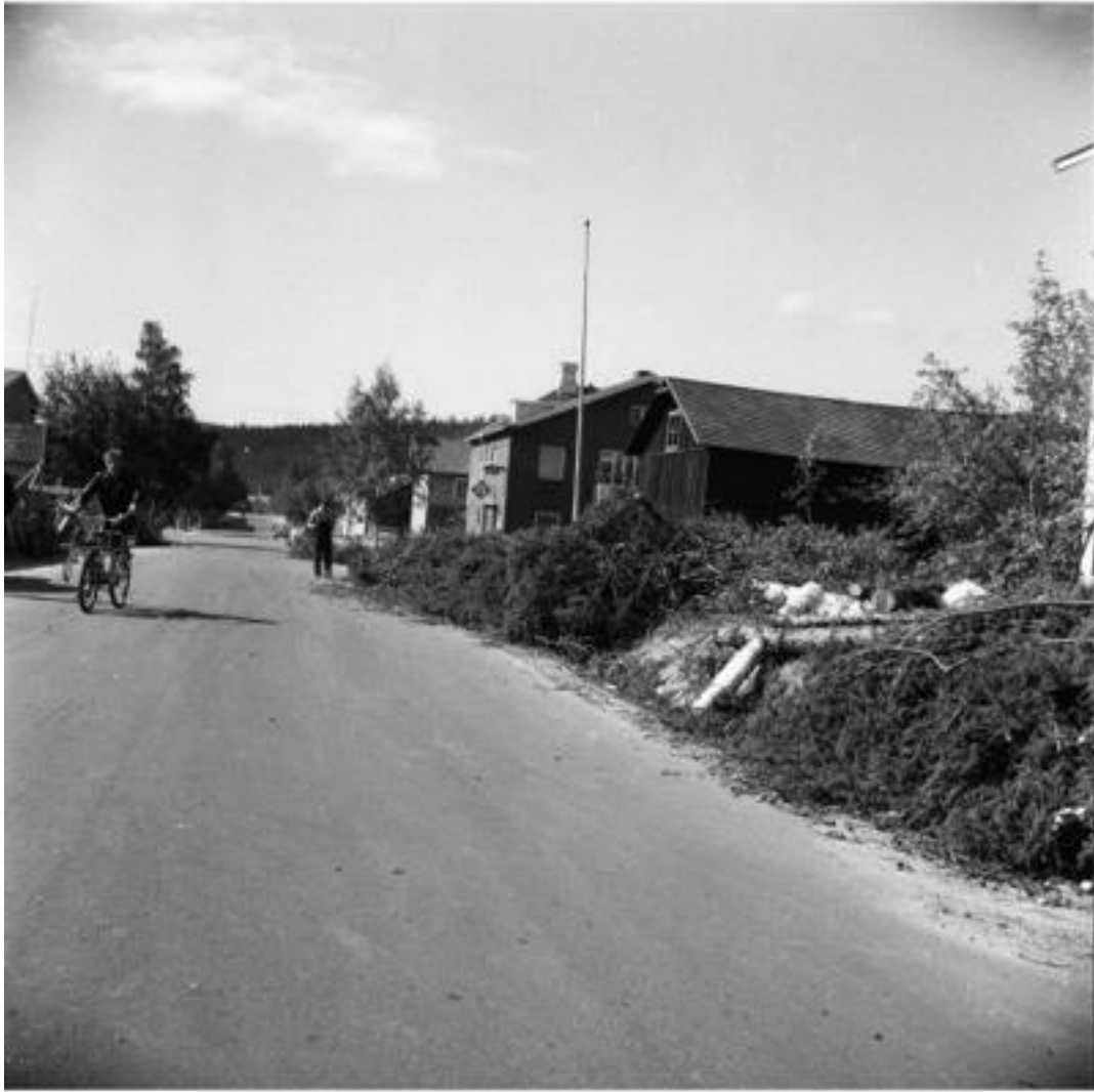
Trädröjning på Stationsgatan, huset i bakgrunden Granbergs ur och Granbergs café. Mest troligt förberedelser för uppbyggnad av hyresfastighet. Juni 1963.