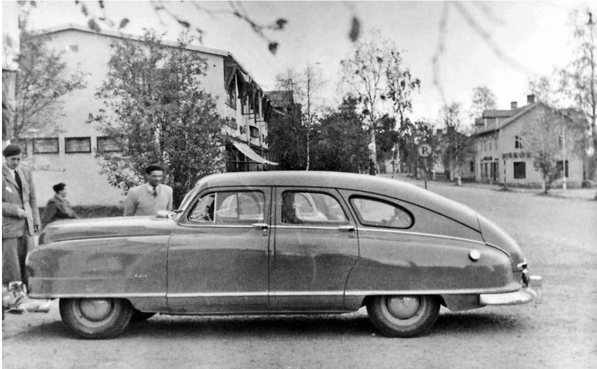
1949 års Nash, i korsningen Storgatan/Stationsgatan 24 sep 1949.

-Själv blev jag ägare av huvemblemet som lossnade vid krocken, skrattar Tommy vid minnet.