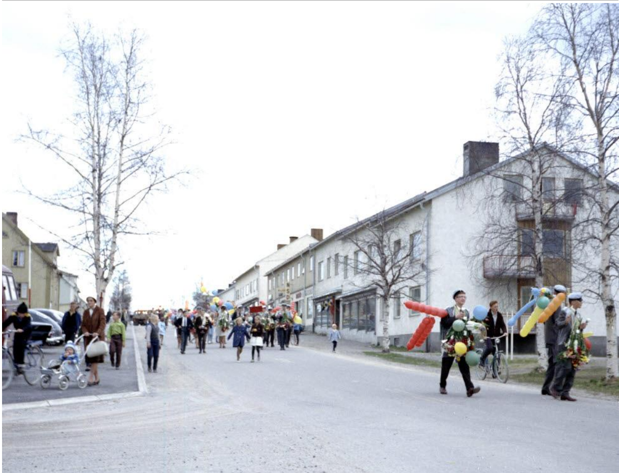
Studentfirande på Stationsgatan. I Arvidsjaur. Nybergs foto – 60 tal.