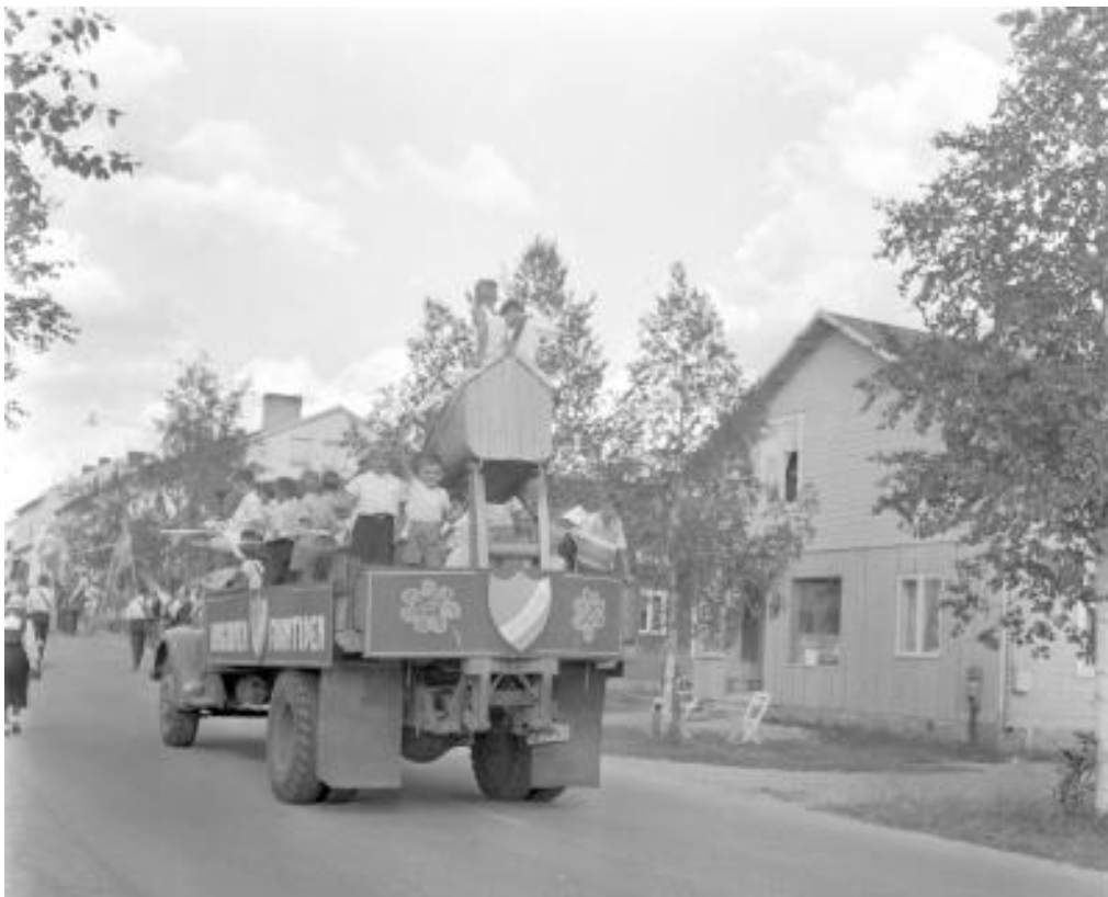
Idrottsmässan festtåg på Stationsgatan "Arvidsjaur bryggeri". Th: IFKA. Foto Norran 1955.