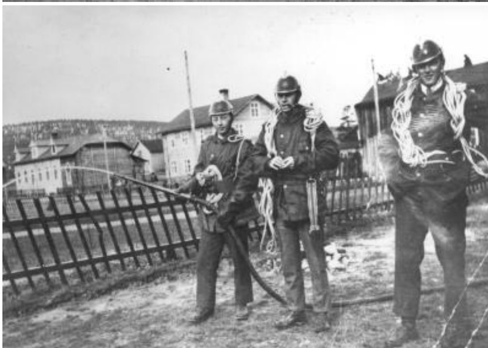
Fram till maj 1951 stod brandstationen, eller Spruthuset som stationen kallades, i östra hörnet av Stationsgatan- Nygatan. En ny brandstation invigdes samma år på Domängatan 15. Bilden th) Brandövning, borgarkåren i Arvidsjaur, 1923.