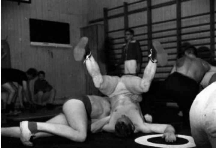
Vid Stationsgatan till höger: