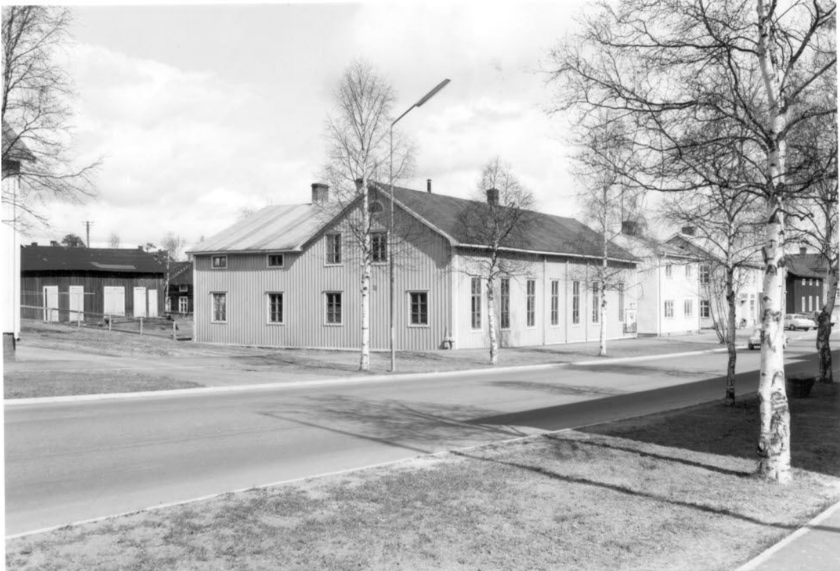
Gamla föreningshuset i Arvidsjaur, 1956, Stationsgatan.