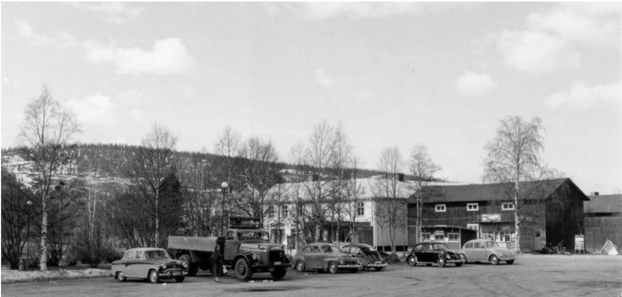
Köpmantorget , troligtvis sent 1940-tal. På Stationsgatan i bakgrunden skymtar Palladiumbiografen och gamla torgkiosken i bakgrunden.

kioskluckan var hans gylf), "Olles kiosk" (för övrigt den första med självplock i Arvidsjaur), "Bågen", IA:s kiosk/jourlivs. (Reservation för ev fel.)