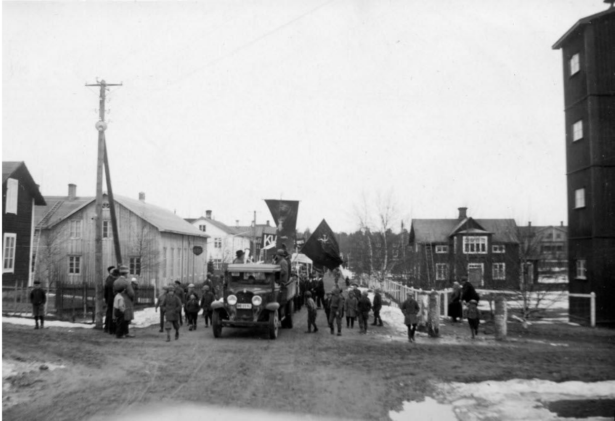
Demonstration på Stationsgatan. Den höga byggnaden till höger är dåvarande brandstationen, spruthuset som stod i korsningen Garvaregatan - Stationsgatan.