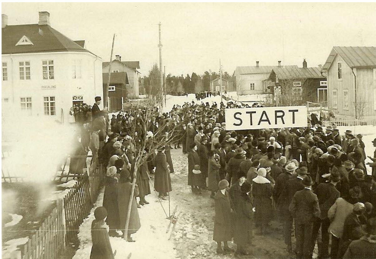
Skidtävling i början av 1900-talet. Start och mål fanns i hörnet Stationsgatan/Storgatan.