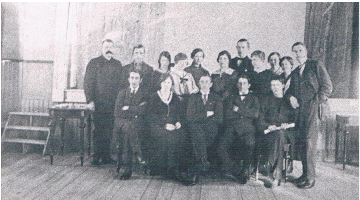
I gamla föreningshuset pågick under decennierna massor av olika verksamheter. Allt från idrott till teatrar, revyer, politiska möten, musik, dans mm. Ovan ett foto av Arvidsjaur socialdemokratiska ungdomsklubb, SSUK. Bilden är tagen år 1915 i Gamla Föreningshuset framför scenen. Gamla Föreningshuset har stått vid Stationsgatan och byggdes upp kring sekelskiftet 1800/1900 av byggmästaren Villiam Åström. Huset revs i slutet av 1960-talet för att ge plats för ett hyreshus.