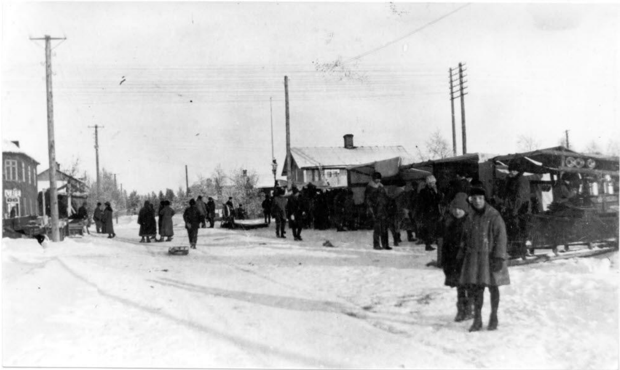
Vintermarknad på Stationsgatan. Th Köpmantorget. Tidigt 1920-tal.