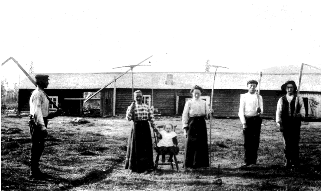
Höbärgning i skogstorpet Guorpaliden, Kvärpaliden, 5 km från Auktsjaur, längs vägen mot Lauker. Bild tagen på 1920-talet.