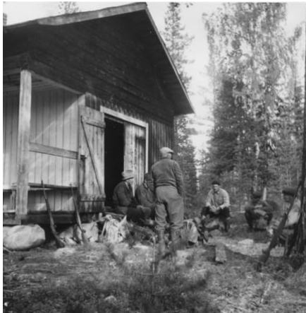
Kronstugan i Guorpa 1960-talet. Kvärpa. Älgjaktlaget som övernattat i stugan. Kronstugan såldes i mitten av 1960-talet, flyttades till Kikkejaur där den används till sommarstuga.