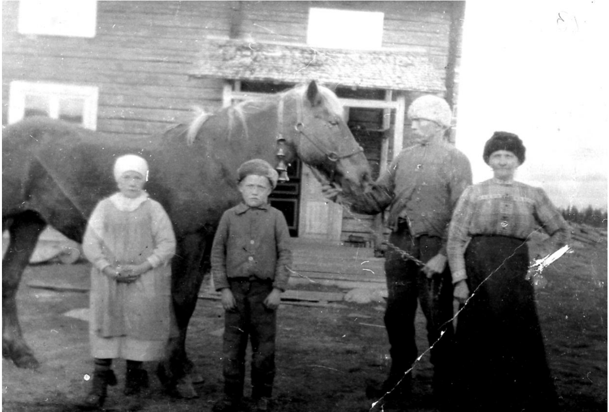
Familjen Larsson från kronotorpet i Guorpaliden, Brännfors, 1920-talet. Familjen samt hästen samlad framför kronotorpet i Brännfors.