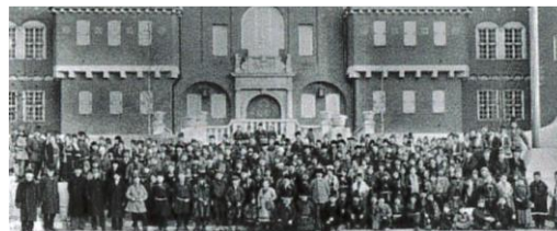
Svenska Samernas Landsmöte februari 1918