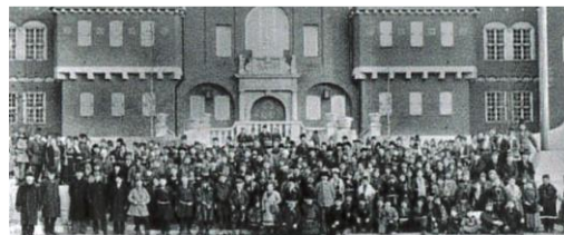
Svenska Samernas Landsmöte februari 1918