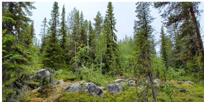
Äldre biotopliknande skog.