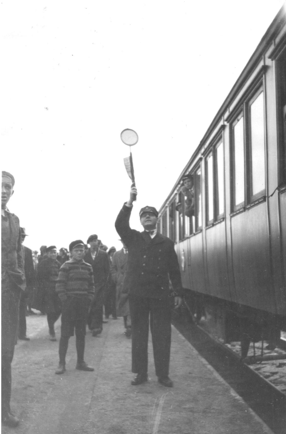
Klartecken! Inlandsbanan, första tåget från Arvidsjaur mot Sorsele avgår 1933!