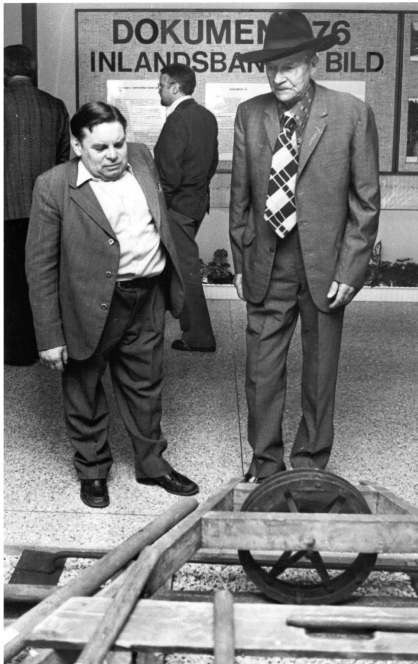
Jubileumsutställningen Inlandsbanan i bild.