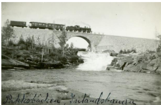
Pakkobäcken, Järntandsbauru Ett ånglok passerar på den vackra stenbron över Pakkobäcken.