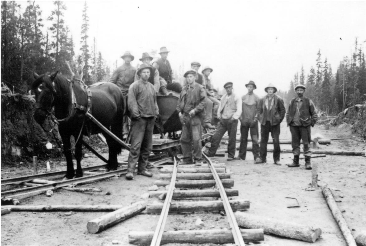
Vid tyngre arbeten fick rallarna använda häst, men oftast bara handkraft, bild från 1930.