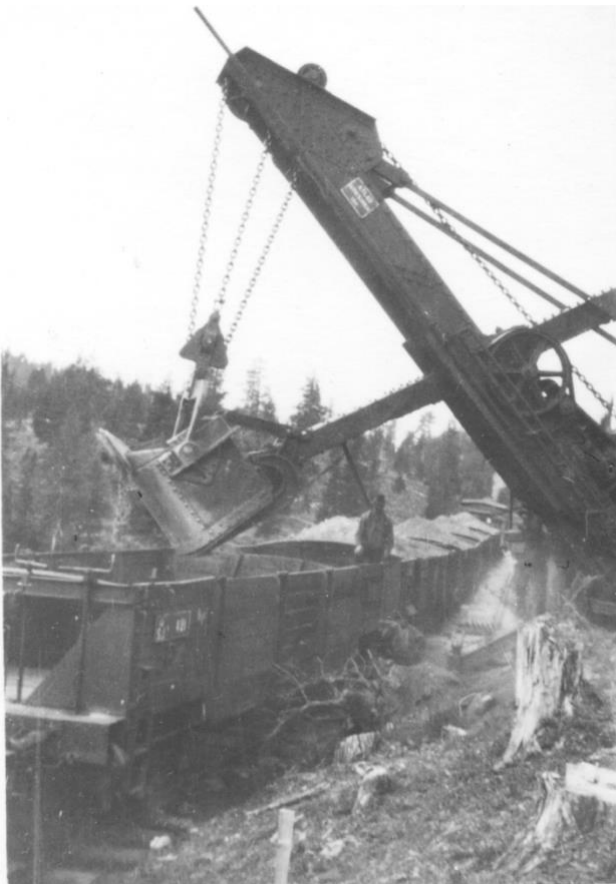
Järnvägsbygge Arvidsjaur - Jokkmokk, Grusfältet mitt emot LTI mot Grandal, Grävmaskinen var ångdriven. Inlandsbanan. Lastning av grus för användning till järnvägsbygget.