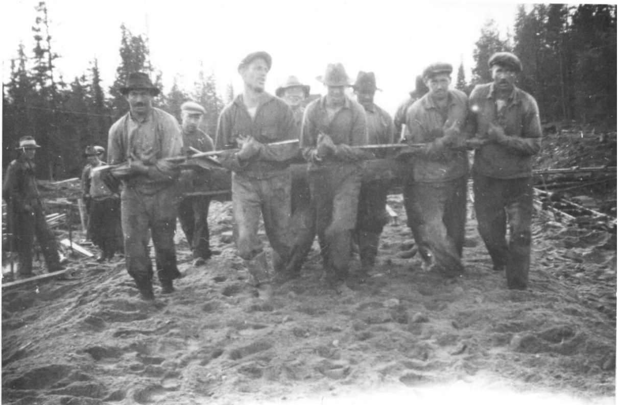
Rallare, järnvägsbyggare vid Inlandsbanan. 1930-tal. Inlandsbanans bygge av räls. 'Rallarna' hade ett mycket tungt arbete, 1930-talet.