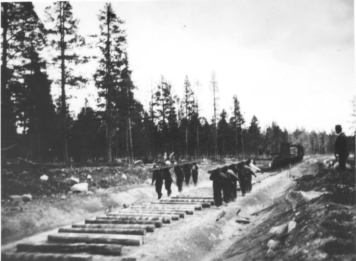
Räls läggs vid järnvägsbygge mellan Avaviken-Arvidsjaur 1928.