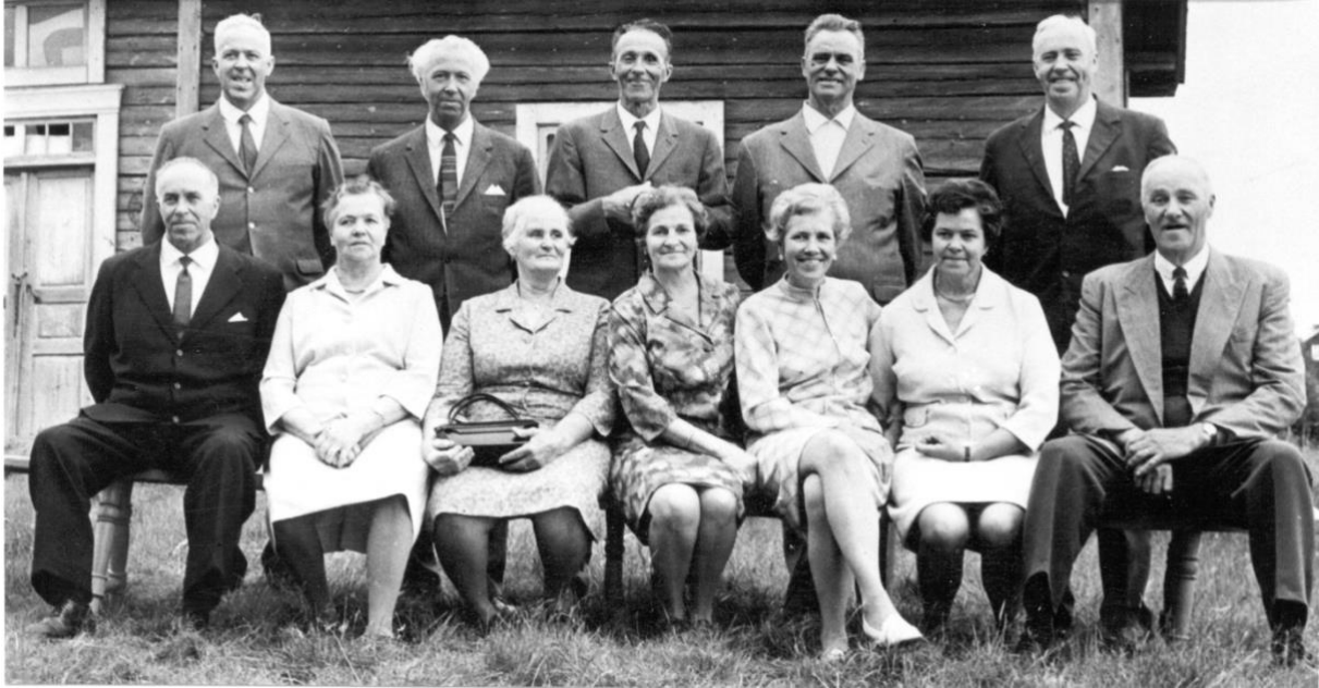
Kortet är taget när yngste brodern fyllde femtio år.