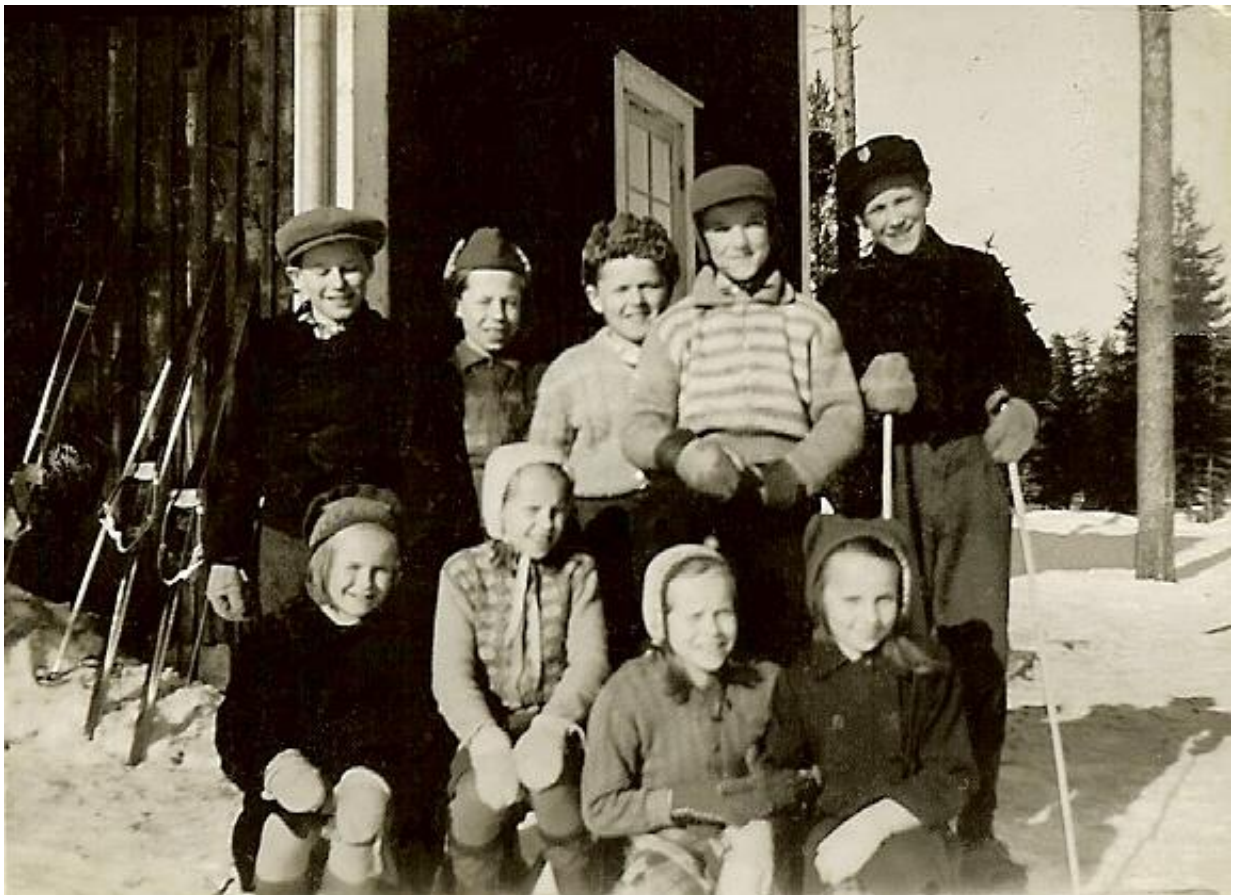
Skolkort. Skolbarn utanför skolan i Nyvall/Skatträsk.

Att åka skidor på rasterna var förr en vanlig sysselsättning.