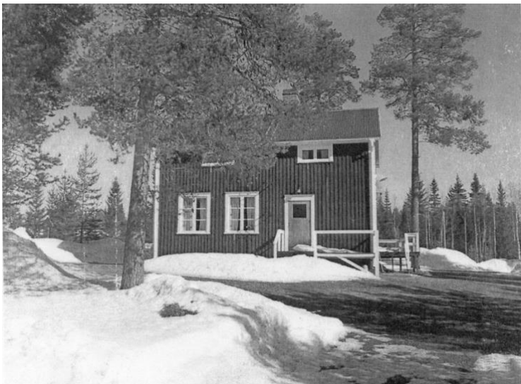
Nyvalls skola, 1999