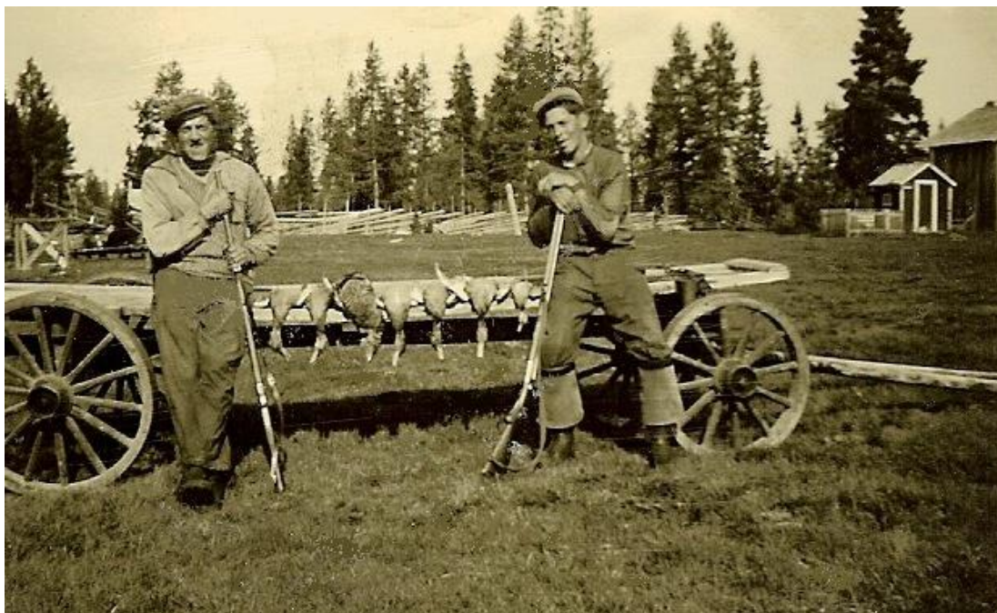
Bilden: Två kusiner Vestermark på andjakt i Skatträsk.