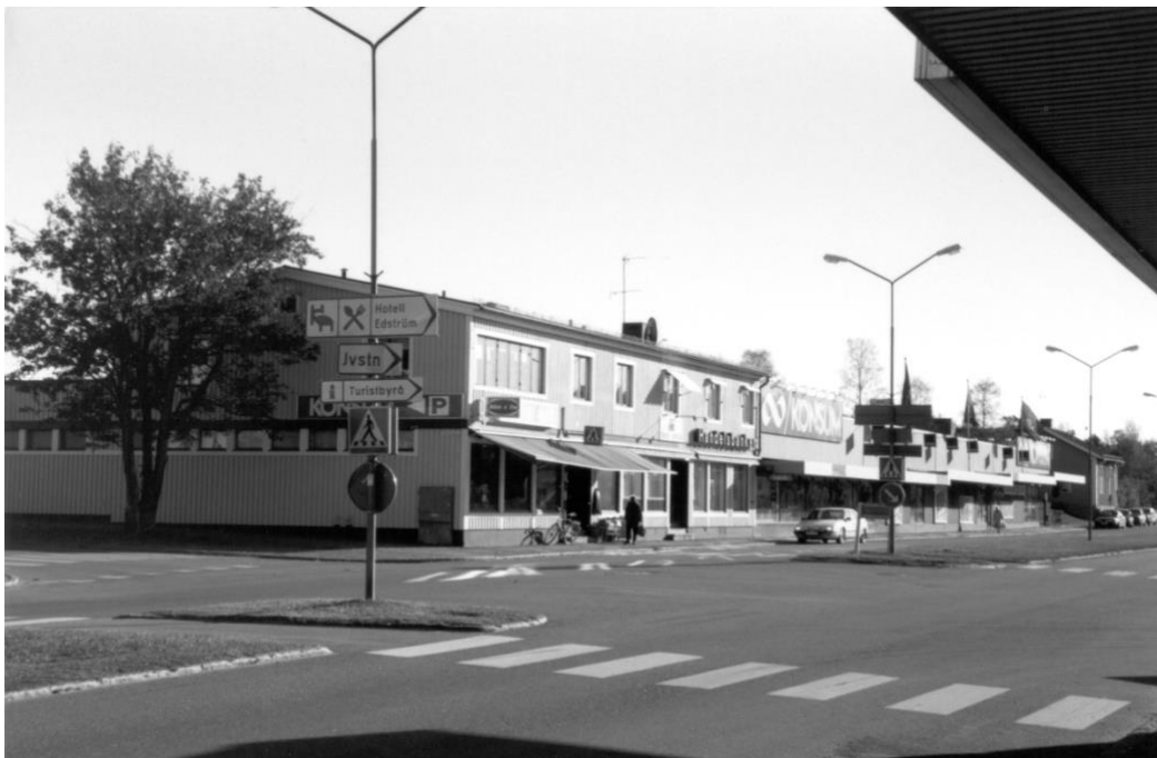
Konsum Storgatan 23, närmast finns gamla delen där Adam&Eva och Handelsbanken längst bort Konsum.