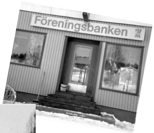
Glommersträsk centrum FöreningsSparbanken i Glommers i renoverade lokaler. Foto Norran 7 april 1977.