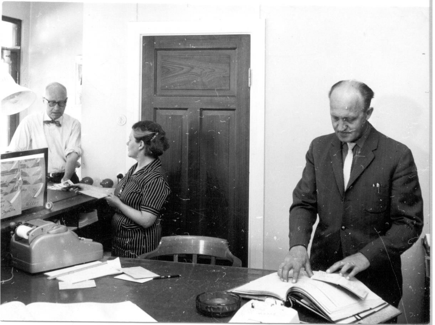
Personal på Arvidsjaur's Sparbank.