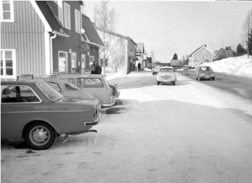
Arvidsjaur, Storgatan, innergårdar, 1964.

Inne på gården kvarteret Lommen 5, 4 och 3.