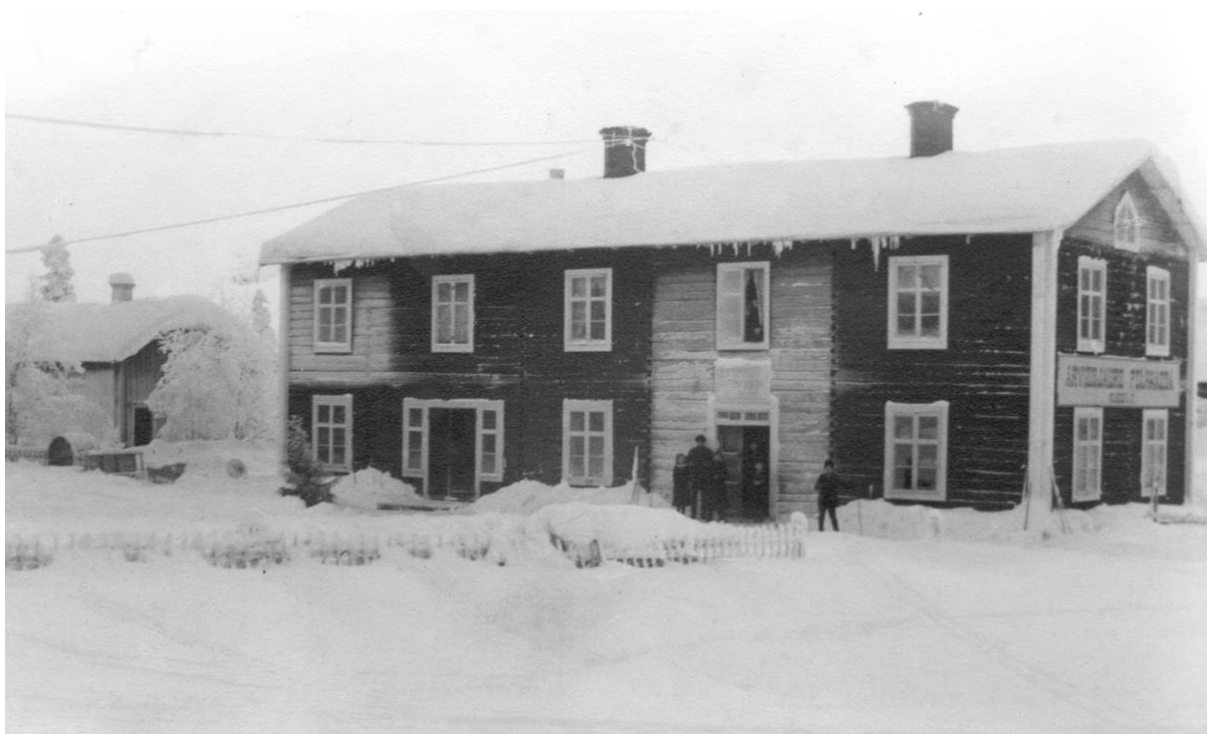
Arvidsjaur Folkkassa, 1919

Arvidsjaur, med omkring 400 invånare hade 1912–1921 fyra banker.