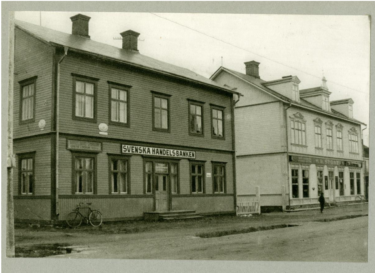
"Bankhuset" vid Storgatan på kvarteret Lommen 3.