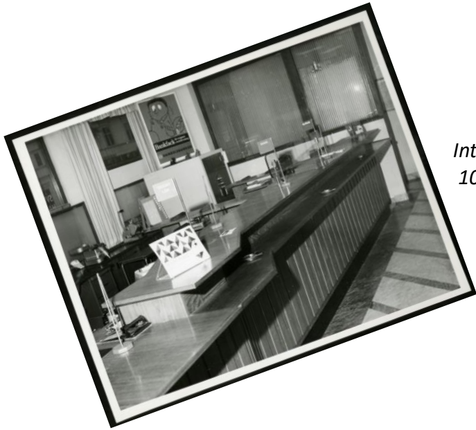
Interiörer inifrån Svenska Handelsbanken Storgatan 10. Ca -60 tal.