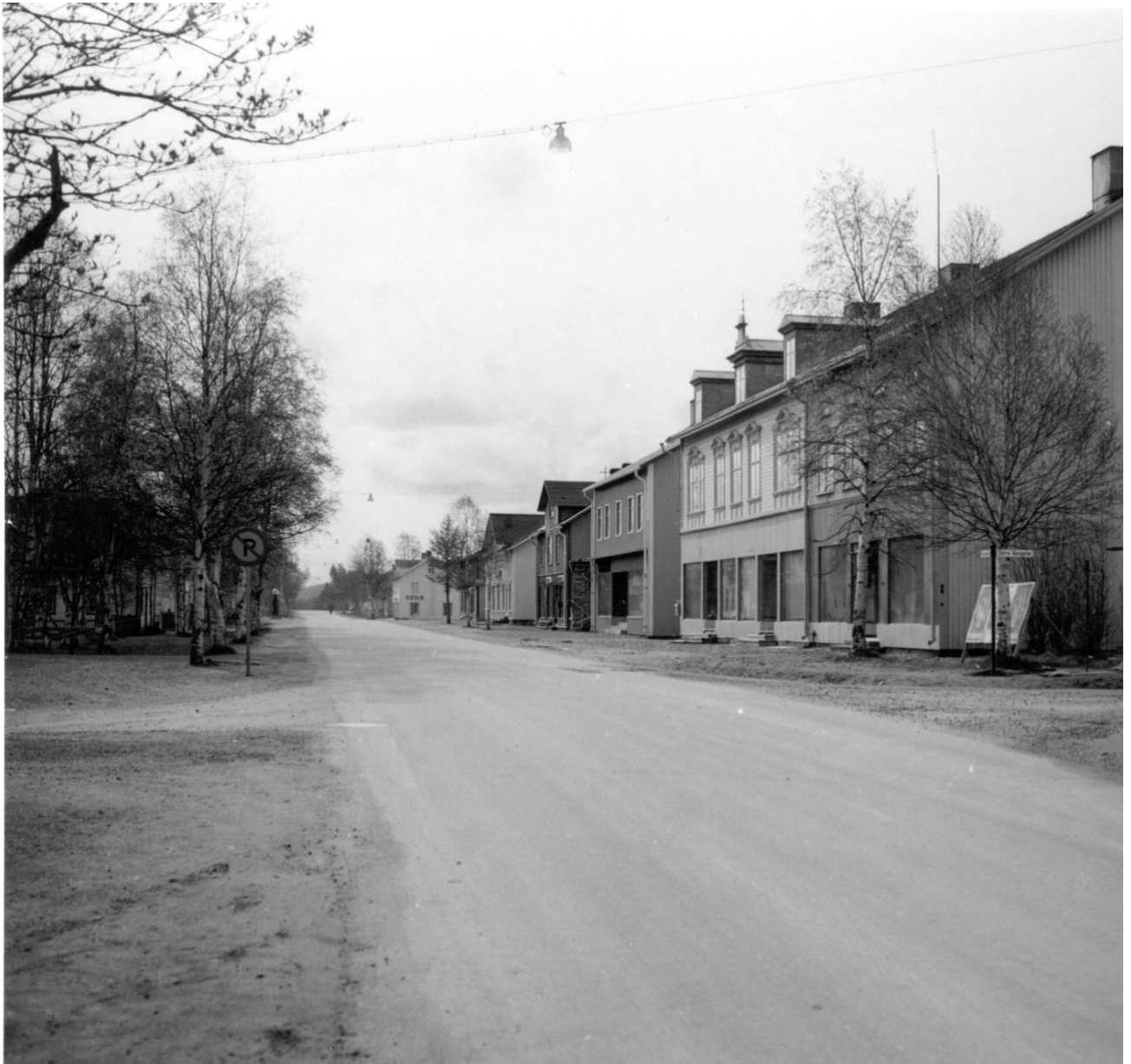
Storgatan i Arvidsjaur 1950-tal