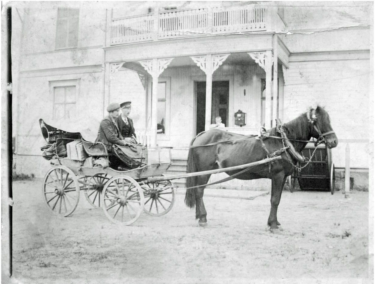
Postdiligens från Jörn till Arvidsjaur med Arthur Södermark, även kallad Post Arthur, 1910

Dåtidens post- och taxitransport med Arthur Södermark till höger i vagnen. Arthur Södermark, 1890-1968, mångsysslaren med de många smeknamnen, Pip Arthur, Plog-Arthur, Tomten, Port Artur, Doppa, m.fl.