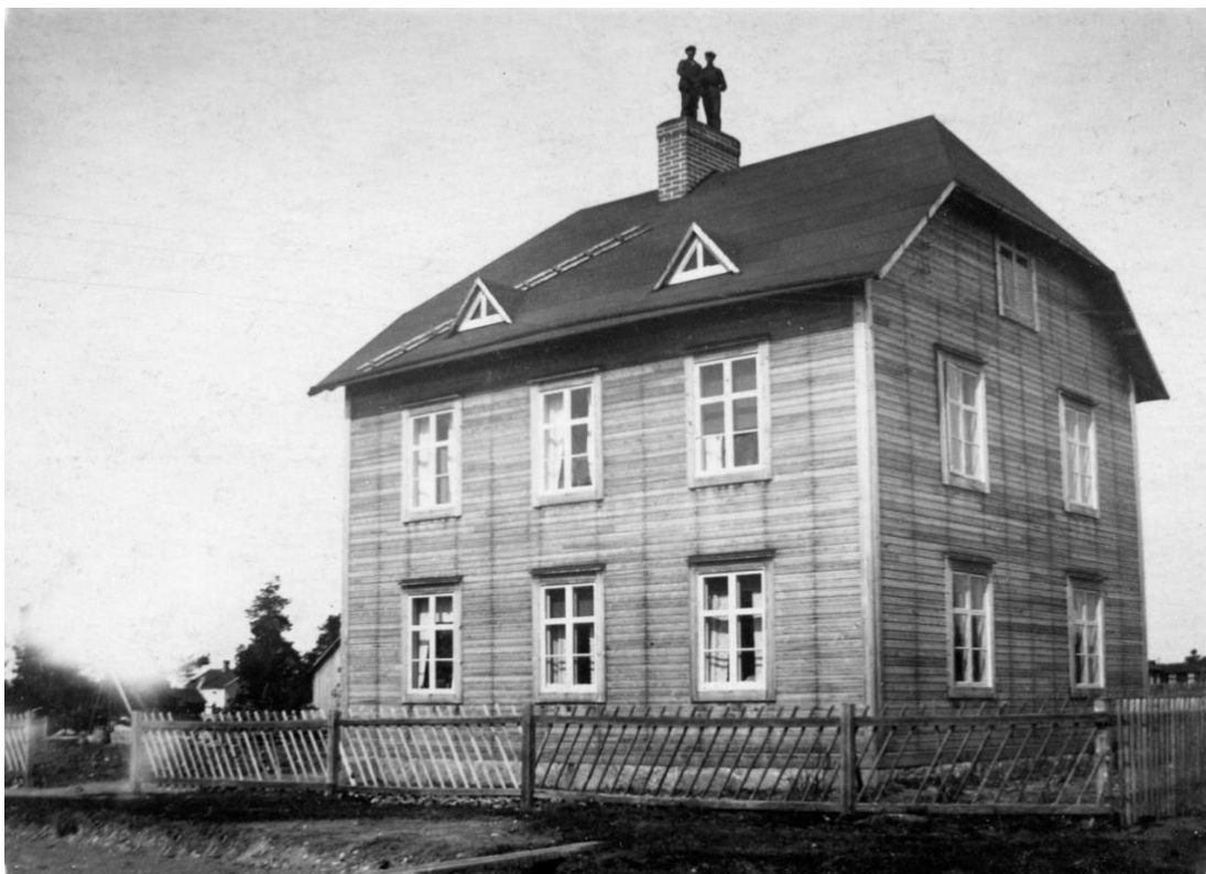
Sotaren Pip-Arthur Södermark f. 1890, är en av personerna som står uppe på skorstenen.