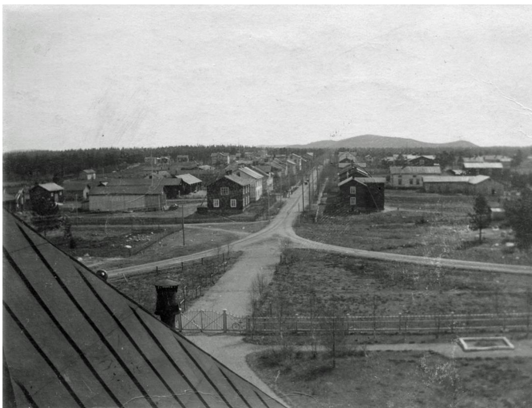
Vy över Arvidsjaur från kyrktornet, 1923. De kyrkstugor som tidigare stått mitt på Storgatan är borta och flyttade till kvarteren söder om Marklundsparken.