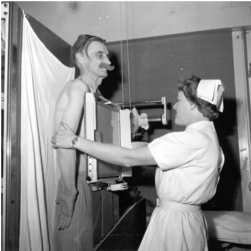
Sjuksköterska och patient som skall röntgas på Arvidsjaur's sjukstuga 1954.