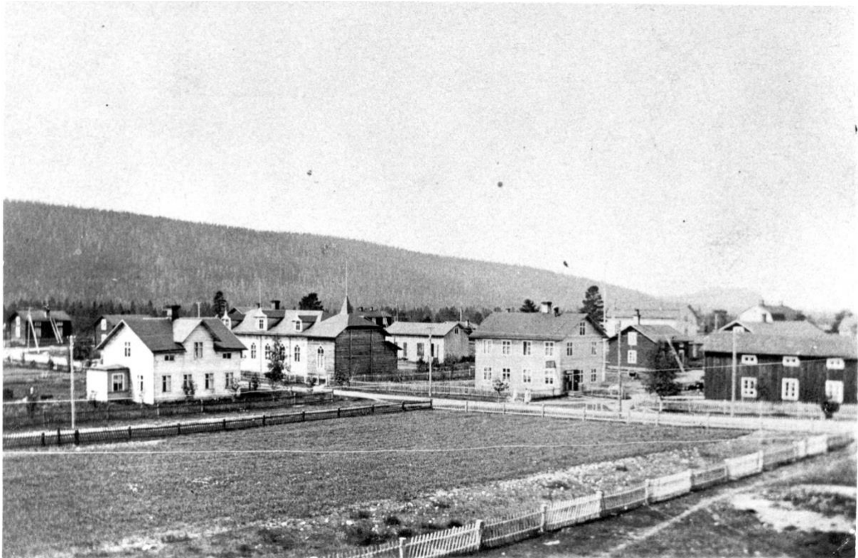
Utsikt över Köpmantorget och gamla Sjukstugan 1910.

”Jubilaren, som är ett fint original, kan med fog räknas till de förnöjsamma och med sin tillvaro belåtna människorna. Måtte 50-åringen leva ännu många år och utföra sitt arbete i sitt förnöjsamma sinne. Leve 50-åringen! A.J.B-a”