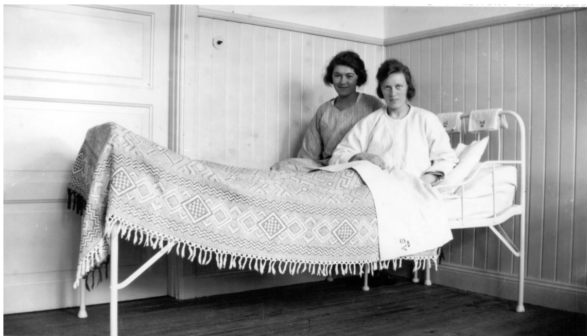
Patienter på sjukstugan 1923.

Till vänster: Delar av Gamla Sjukstugan revs 1969 och nya delar är tillbyggt. (se bild 1982_689_2). Ovanför syns Lappstaden som har funnits i stort sett sedan Arvidsjaur's municipalsamhälle kom till.