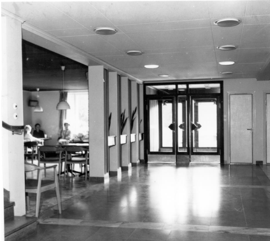
Arvidsjaur's sjukstuga, entrén, 1965.