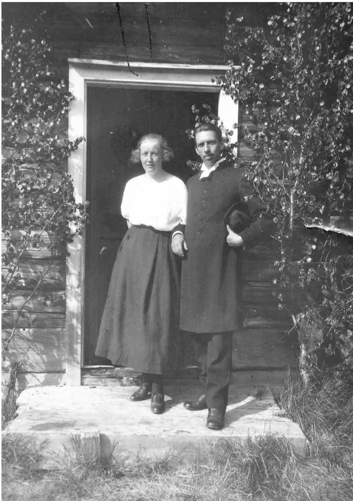
År 1921 ingick Lott äktenskap med prästen Olof Berggren, 1884–1926. Men äktenskapet blev kortvarigt, då Olof avled redan 1926.