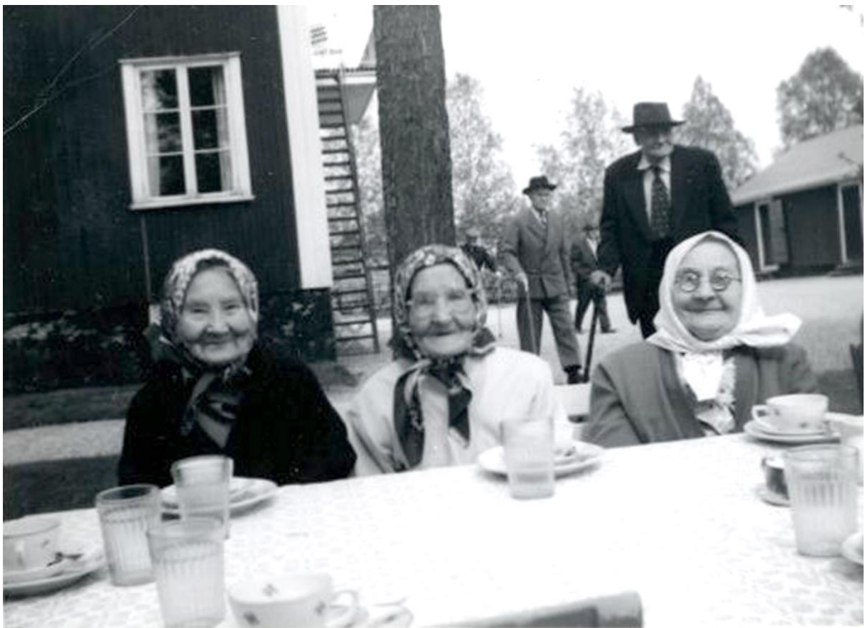
Tre gummor vid fikabordet på ålderdomshemmet.