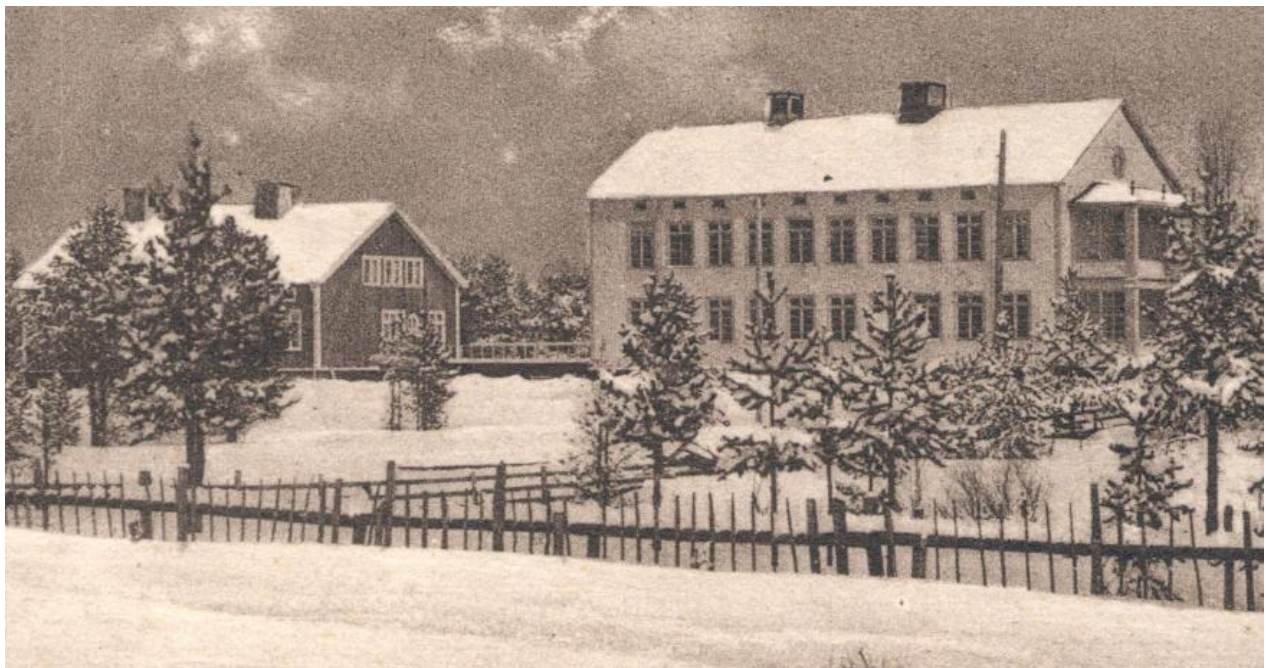
Vintery: Sjukstugan i Arvidsjaur invigdes 4 september 1924 av Landshövding August Beskow. Tuberkulosavdelning och ligghall fanns i det högra huset på övre våningen till höger. Epidemisjukstuga fanns i huset till vänster.