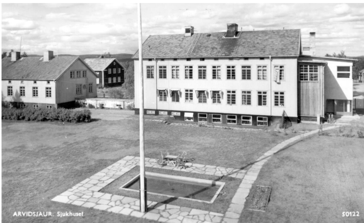
Sjukstugan i Arvidsjaur 1950

En läkarbostad byggdes 1928 till vänster om sjukstugan. Läkarbostaden revs 1981 för att ge plats för ut- och ombyggnad av sjukstugan.