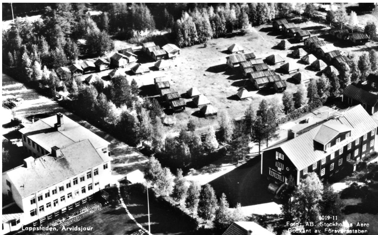
VY över Lappstaden, gamla Ålderdomshemmet och gamla Sjukstugan, 1950-tal.

Till höger: Gamla Pensionärshemmet med lägenheter och gemensam matsal. Huset revs 1968 för att ge plats till ett större och bekvämare boende för de äldre och personal.