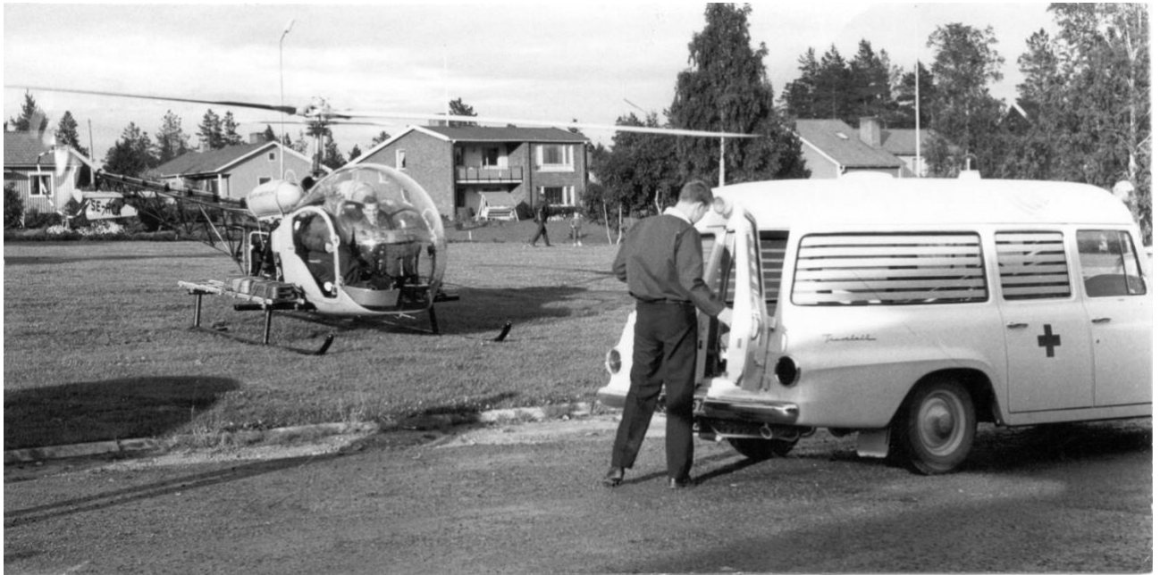
Sjuktransport med helikopter från fältet vid Lapponia, 1960-tal.