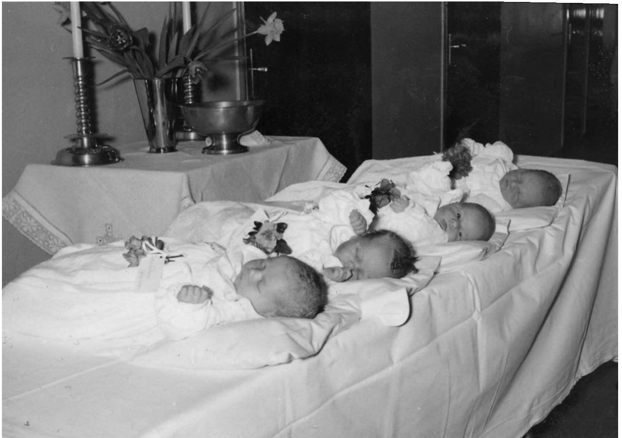
När det fanns BB. Dop på sjukstugan i Arvidsjaur.