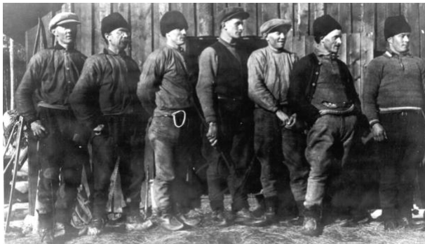
Timmerhuggare vid Olaselet, Åkroken, 1928.