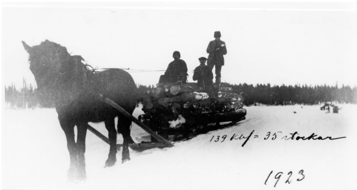
Hästarna drog de tyngsta lassen under skogsavverkningarna och var därför hårdvaluta för bolagen. Bilden visar Timmeravverkning i Mellansjö, 192. Lasset rygger 35 stockar = 139 kubf.