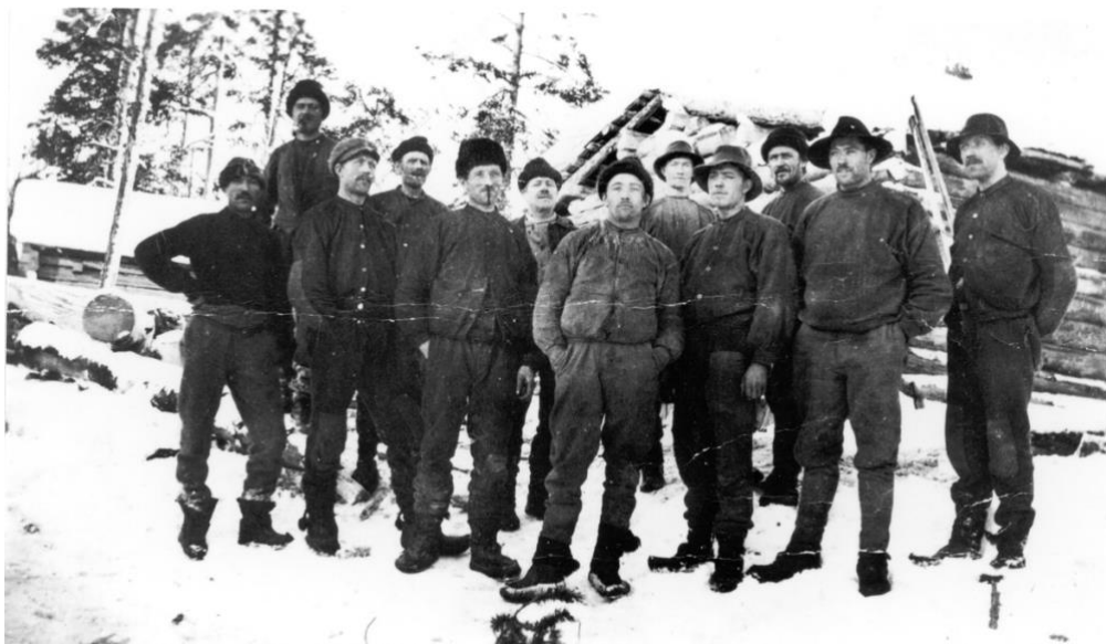
Avverkningstrakt i Tjirsa, 1921. Ca 1 mil från Lilla Varjisträsk.