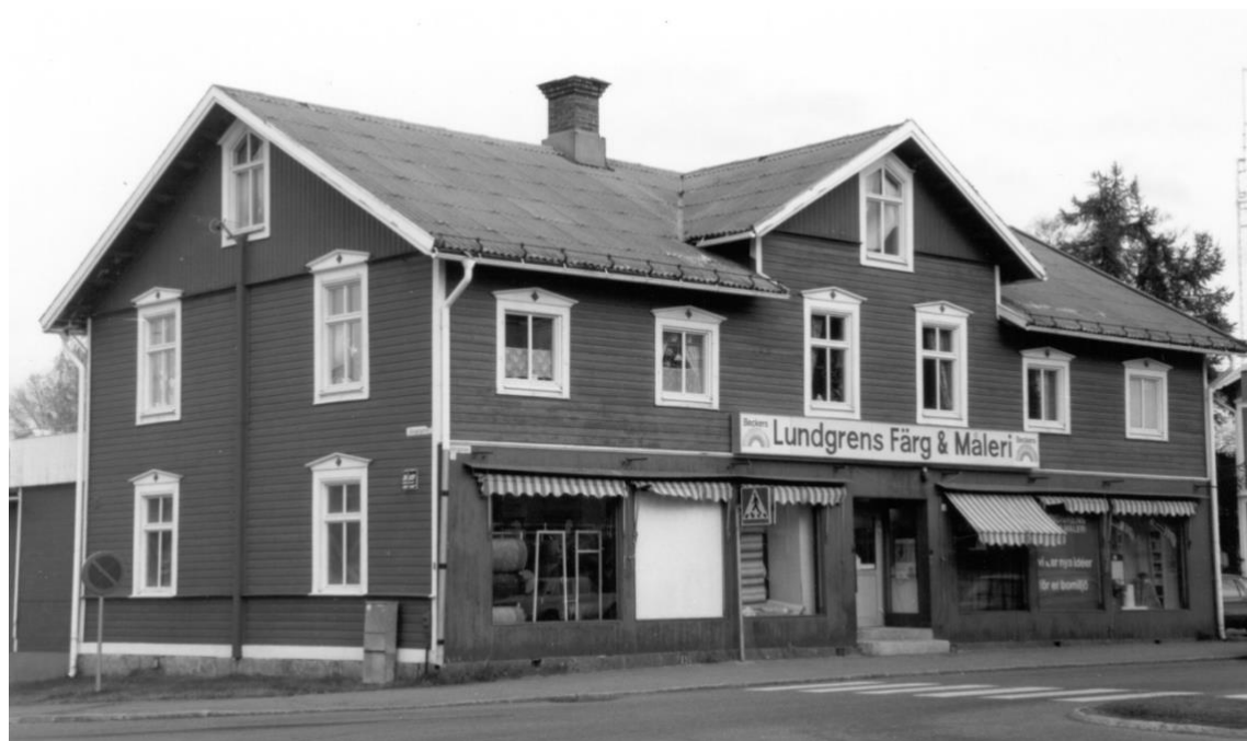
Huset på Storgatan 7 byggdes 1903. Lundgren Färg & måleri flyttade in i modern tid och köpte sedermera hela fastigheten.