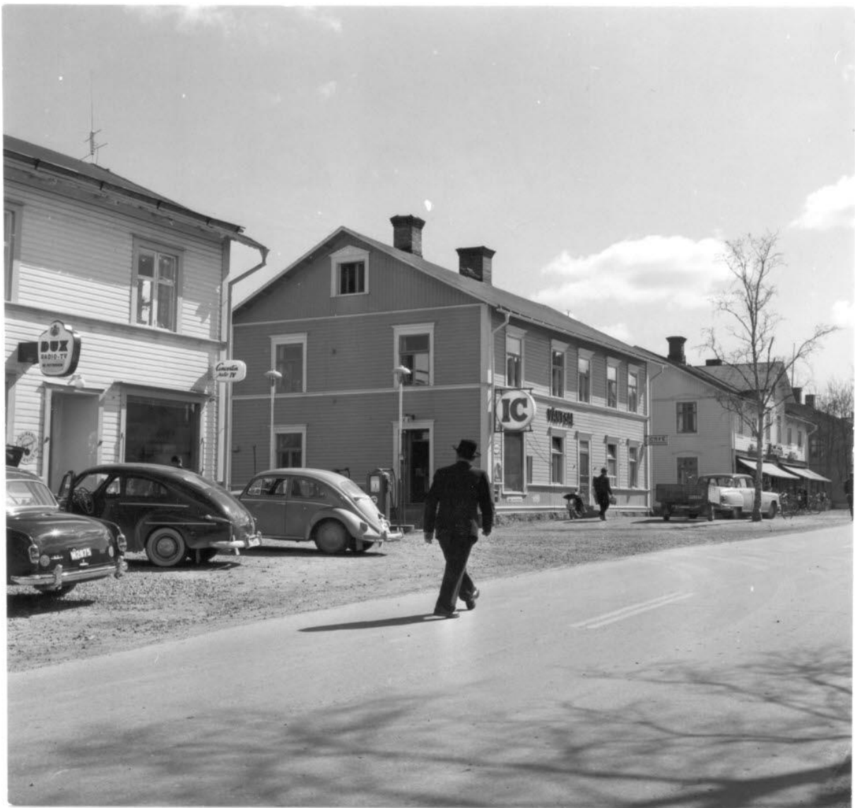
Storgatan i Arvidsjaur, 1954. Byggnader från vänster: Olle Åströms gård med bröderna Petterssons Radio, gamla IC (blev OK och senare OKQ8) med väntsal och servering, Lindqvists matvaruaffär och herrekipering.