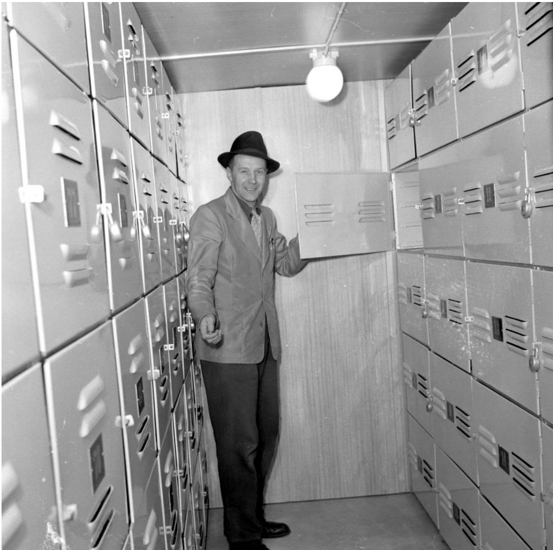
Lindqvists kläder hyrde även ut frysack till privatpersoner. Under 1940–1960 talen var det inte lika vanligt att alla hade egen frysbox hemma. Fryshuset låg bakom Lindqvist fastighet på Storgatan 7.