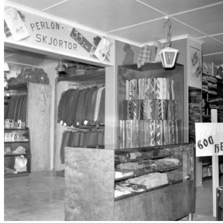
Magnus Angren jobbade i Lindqvists herrekipering. Foto NV 1963.