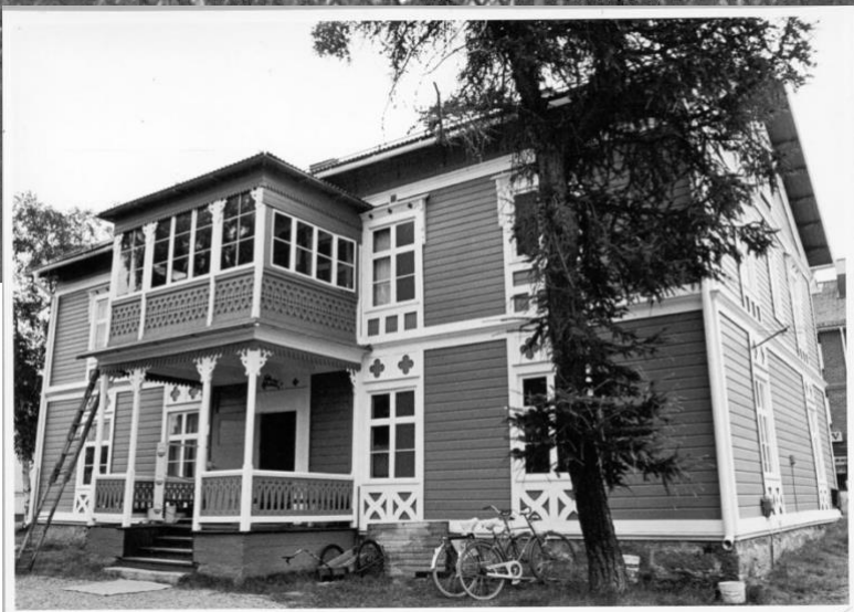
1975. Gamla apotekets baksida.