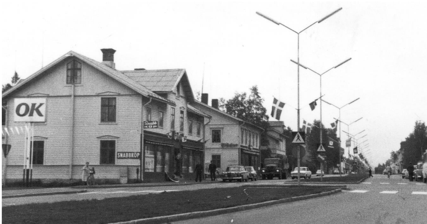
Lindqvists snabbköp och klädbutik, Storgatan 7–9.