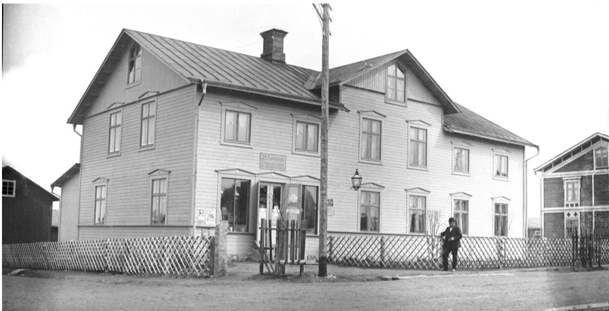
1903 uppfördes denna fastighet och tre magasin på innergården. (I samma tid som nuvarande kyrka stod klar.)