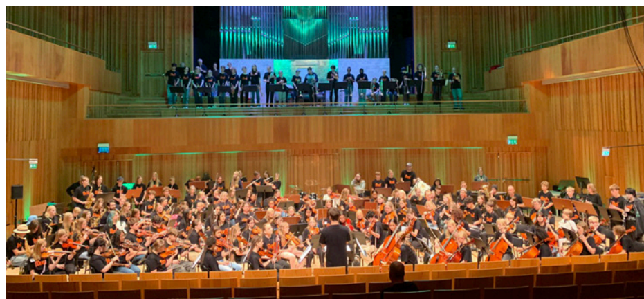
Alla 170 lägerdeltagare spelar tillsammans på konserten!