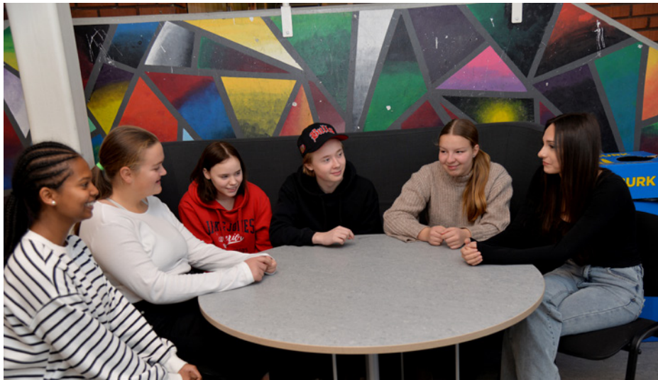
Så här skulle det kunna se ut om det inte fanns mobiler eller bärbara datorer. Elever som pratar med varandra utan teknisk utrustning.