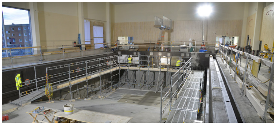
Simbassängen kakelsätts.