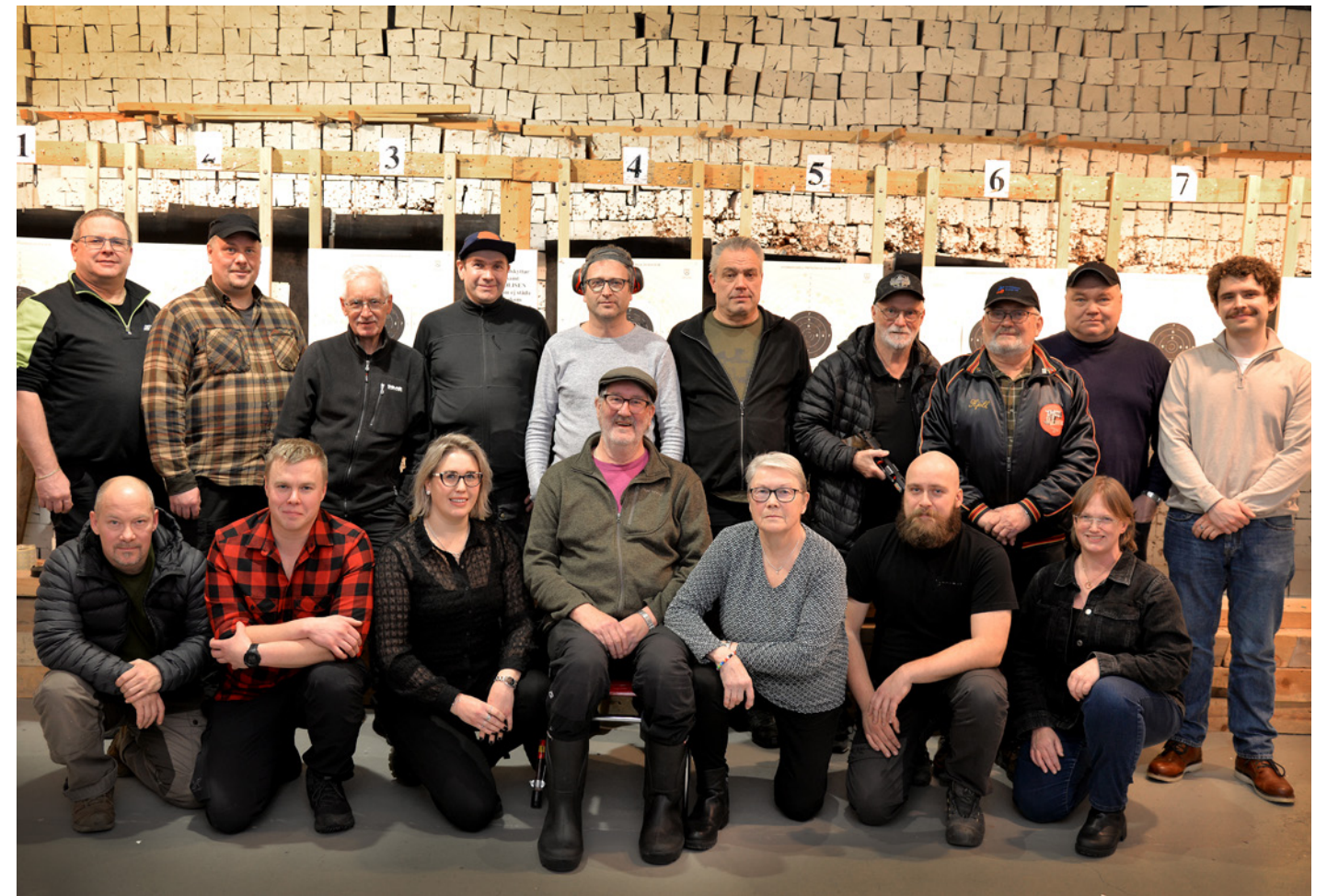
Tårtstina medlemmar i Arvidsjaurs pistolklubb, 2024. Klubben förfogar över totalt 48 medlemmar.