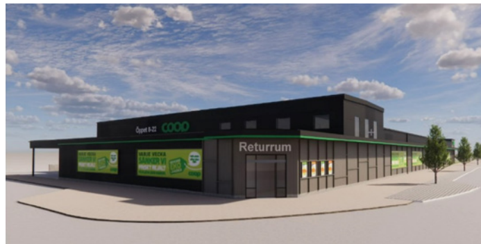
På taket; personalutrymmen, ventilation och el-central.

Det fanns dock asbest i huset vilket inneburit att rivningsarbetet dragit ut på tiden en del. Källarutrymmet, förutom ett skyddsrum, fylls igen. Varumottagningen flyttas till baksidan för att inte störa trafiken på Stationsgatan.