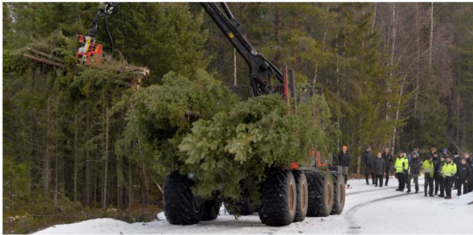
Från rot till flis.