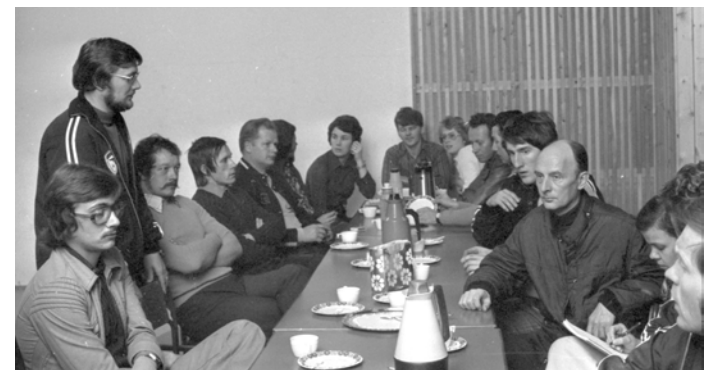
Så här såg det ut för 50 år sedan när pistolklubben firade nya lokalen i Medborgarhuset.