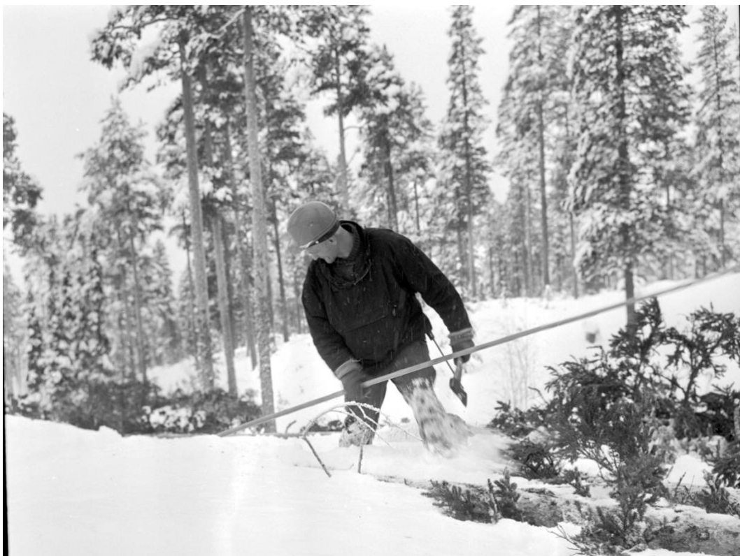
Skogsarbetare Arvidsjaur's revir.