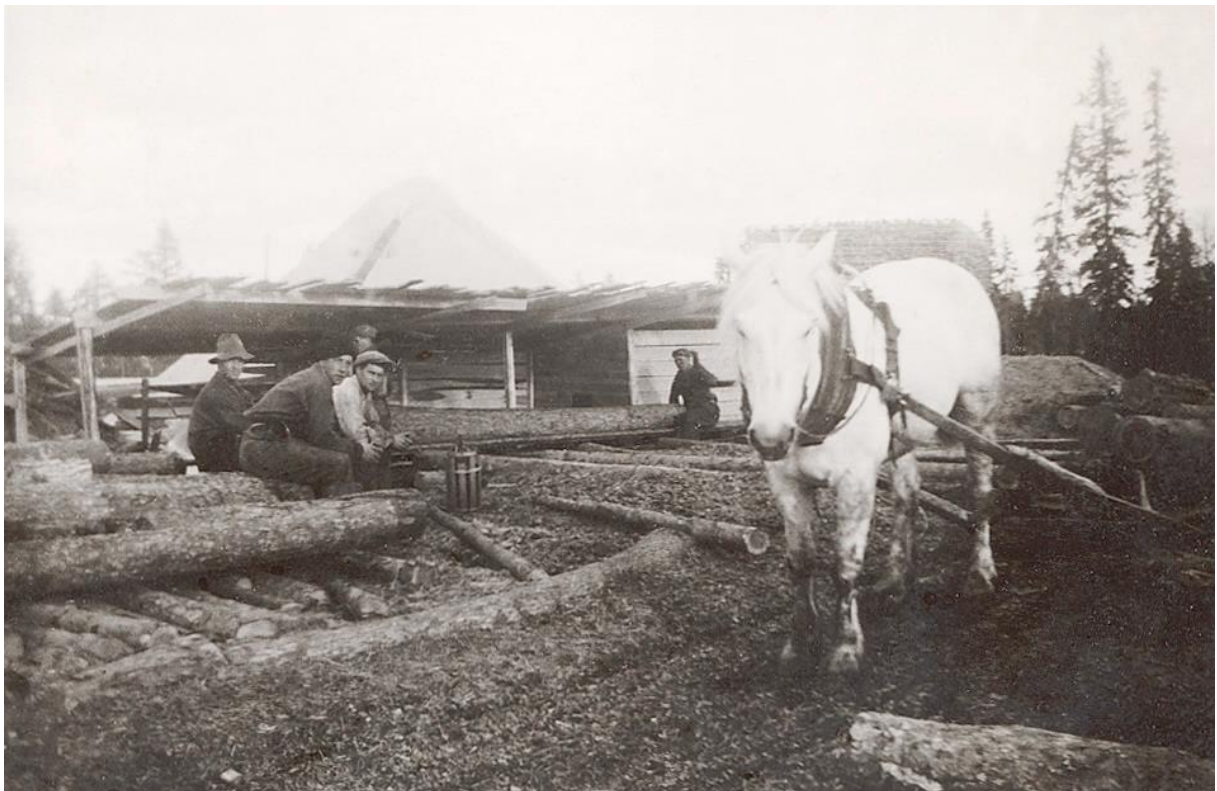
Transport av timmer med häst som körs till sågen i Hålberg.