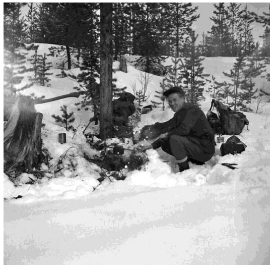
Skogsarbetare i Grundträsk kokar kaffe -57