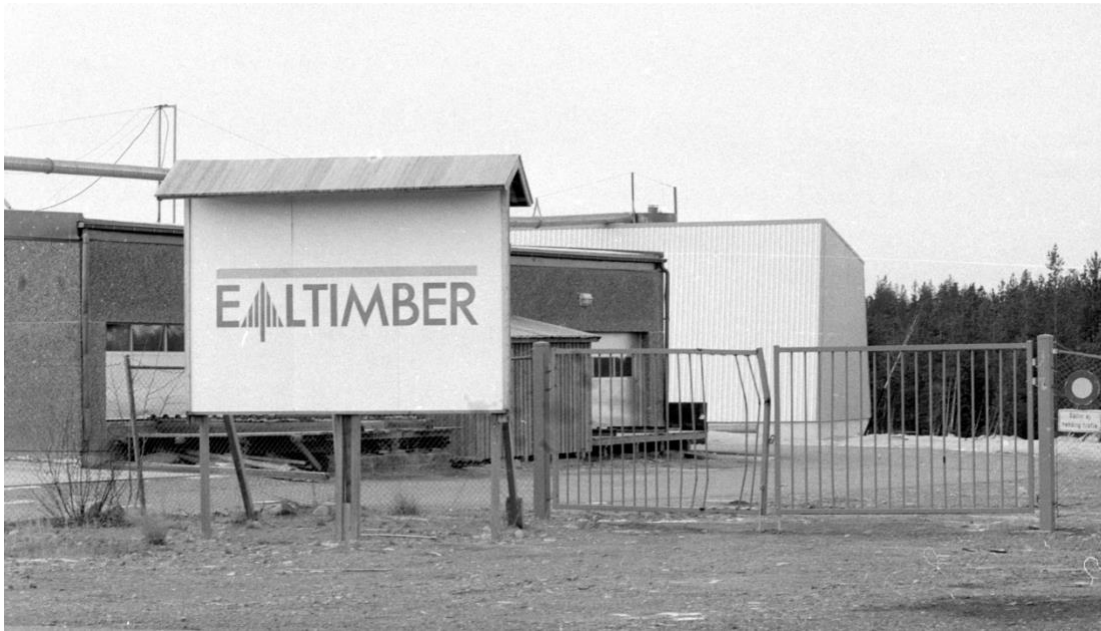
EAL Timber skylt i Moskosel 25 ok 1988.