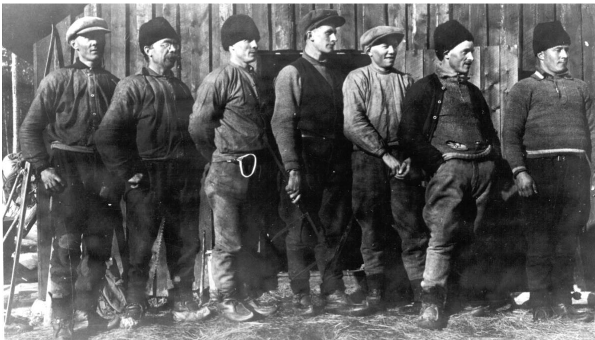
Timmerhuggare vid Olaselet, Åkroken, 1928.