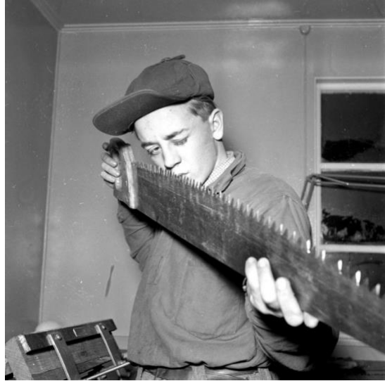
Lidmyrliden fortsättningsskola, nov 1955 NV.