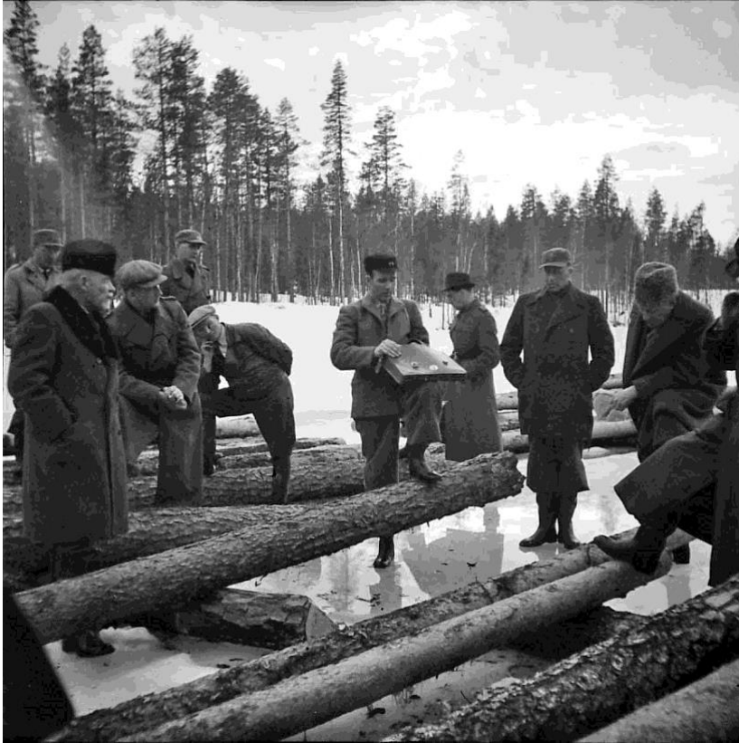
Tumningscheferna inspekterar, vid bland annat Storbäckskojan, Arvidsjårsjön, april 1947.