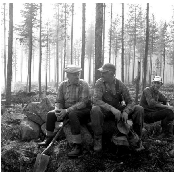
F A Englund Moskosel 50-tal.