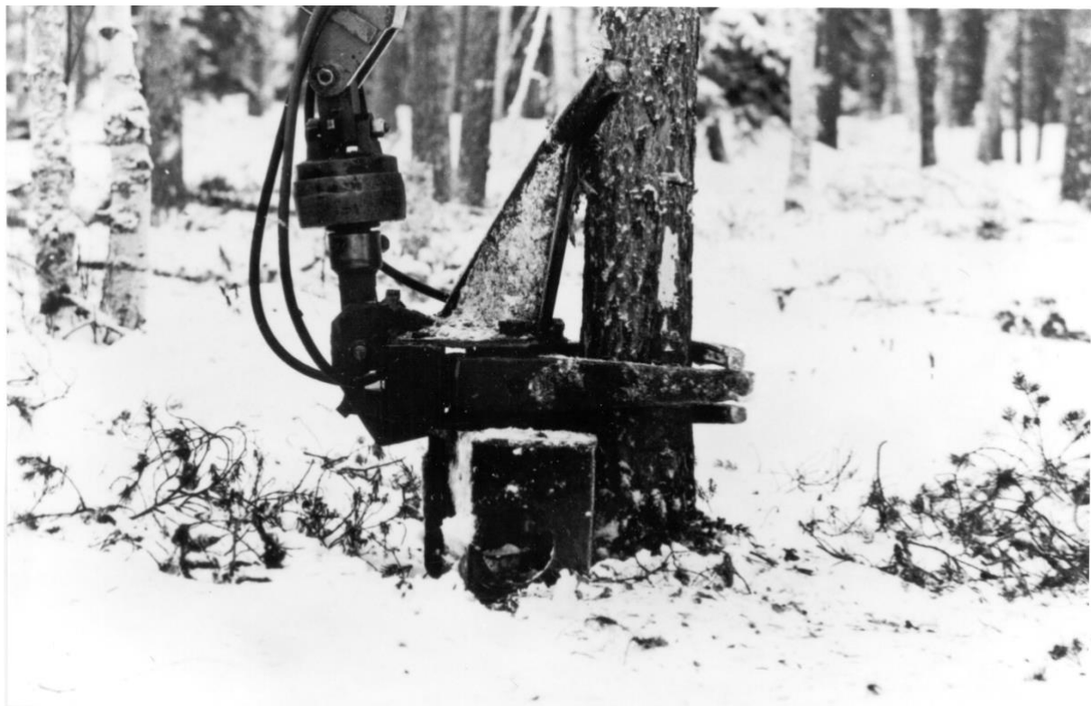
Processorn för helautomatisk timmeravverkning , här för kapning av stammen. De olika momenten i maskinens funktion utvecklades under 1960-talet fram till ca 1975. Såverksägare Bengt Lidström, Moskosel, var ägare av denna processor.