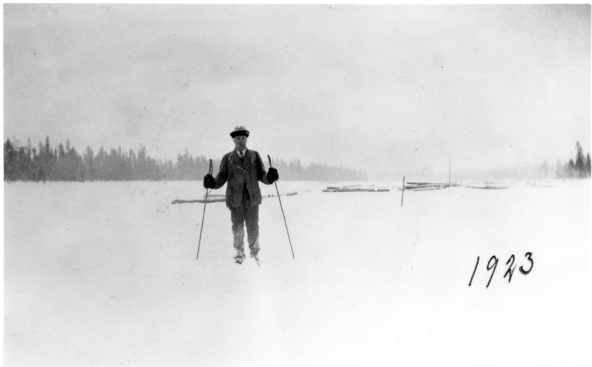
Timmerupplag, Mellansjö, 1923.