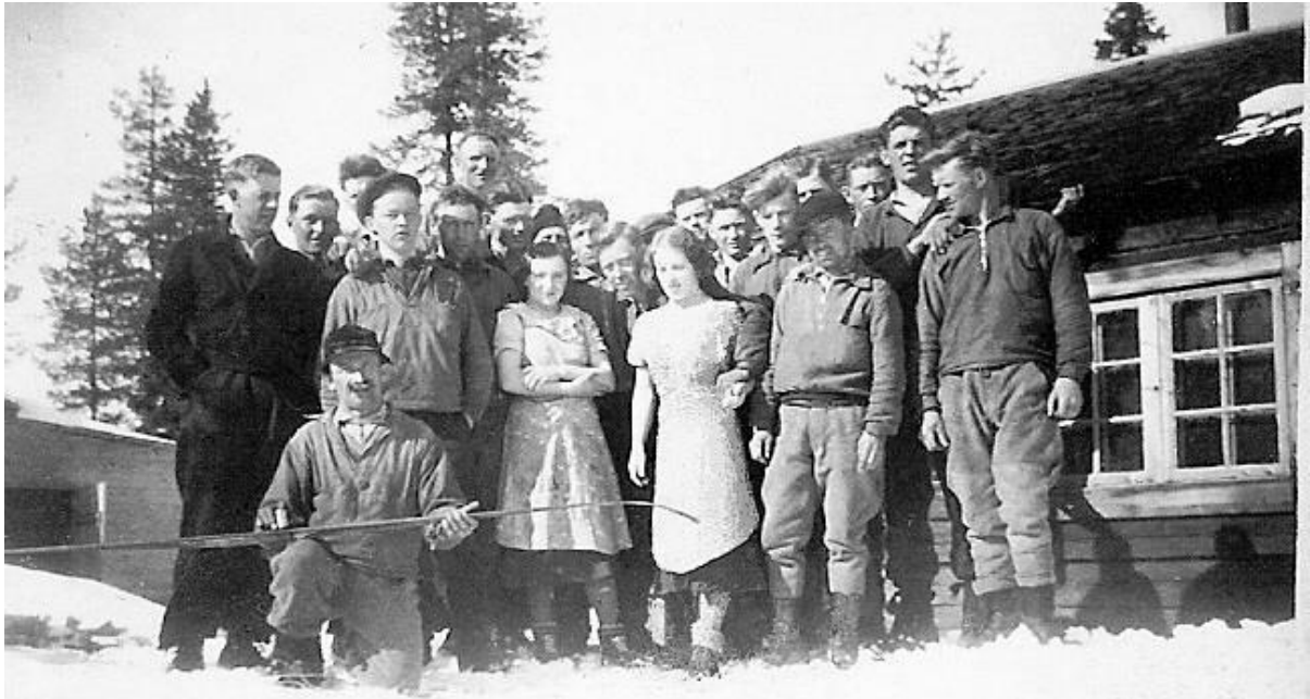
Skogsarbetarlag i Bolkberget, Sjöträsk, 1938.