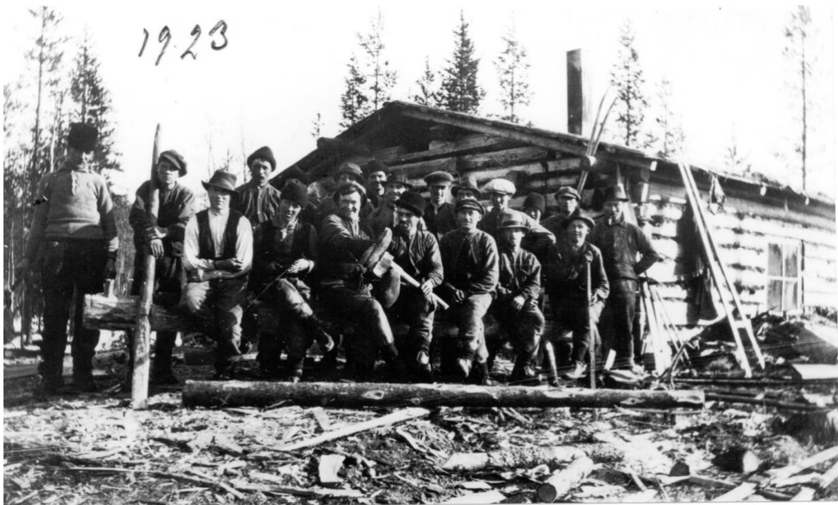
Timmeravverkning, Mellansjö, 1923.