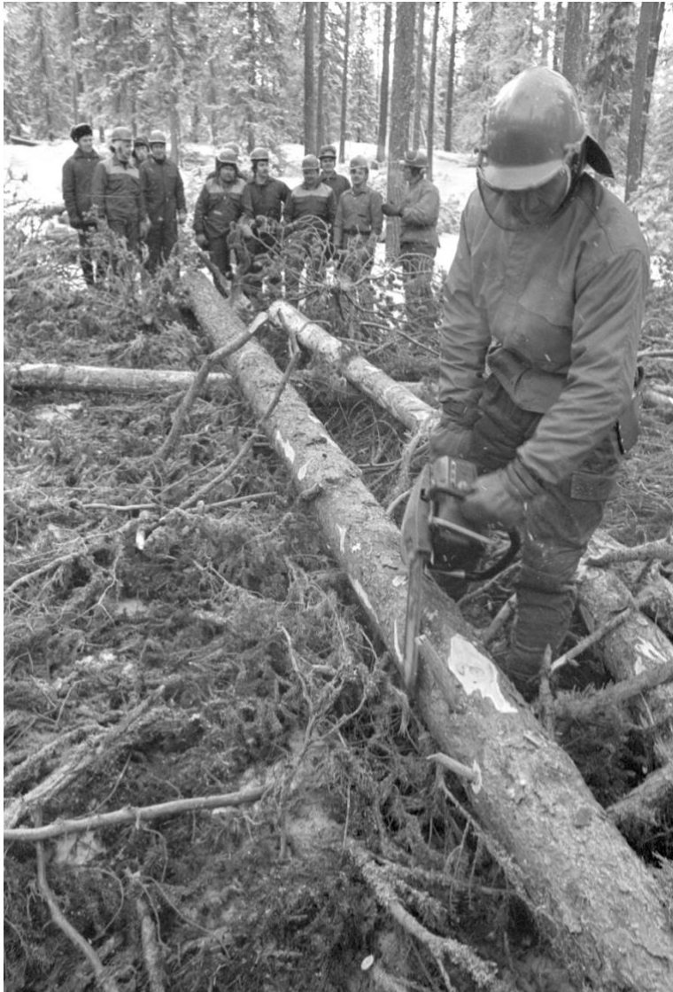
Motorsåg, bänkfällning, en gammal metod blir som ny. Foto Norran, 21 jan 1971.