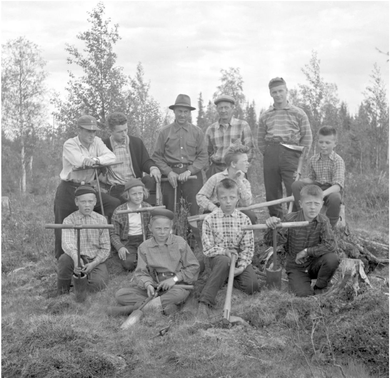
Skogsplantering. 4 H i Utterträsk, sommaren 1957 Foto Norran.