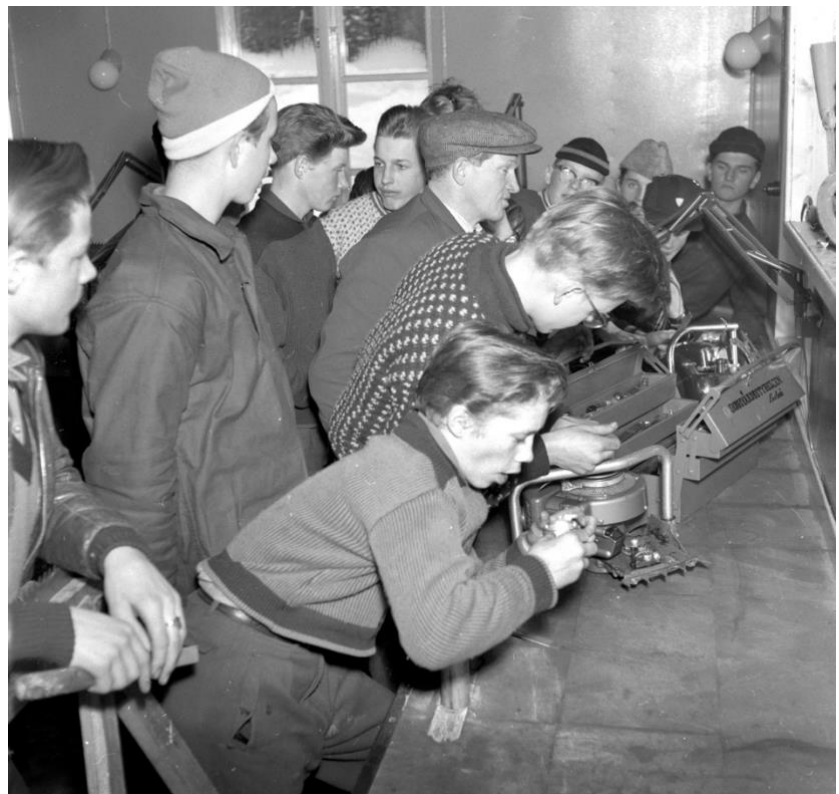
Skogsbruksskola i Lidmyrliden. Foto NV 1955