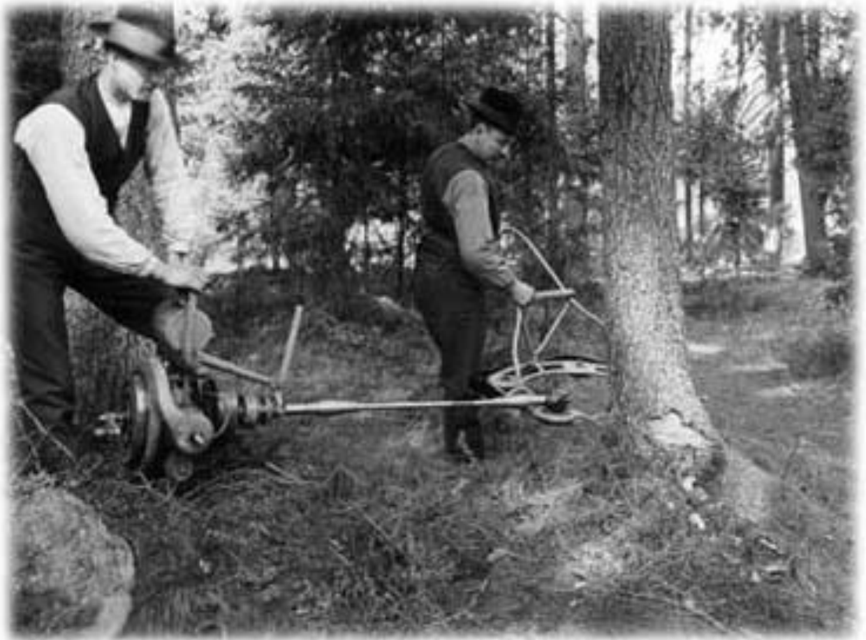
Skogsavverkning. Mannen till höger använder en typ av motorsåg, tid okänd.