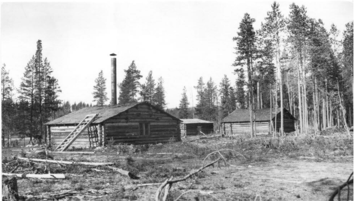
Åkroken längs Lulevägen, Arvidsjaur, 1924. Från tiden då huggarna avlönade en kocka, som ordnade mat på en eldstad mitt i kojans. Den fungerade både som spis och värmekälla.

fraktade det sedan de ca 5 milen upp till Brännudden. Där byggde de en koja och ett stall och började bryta tjärstubbar.