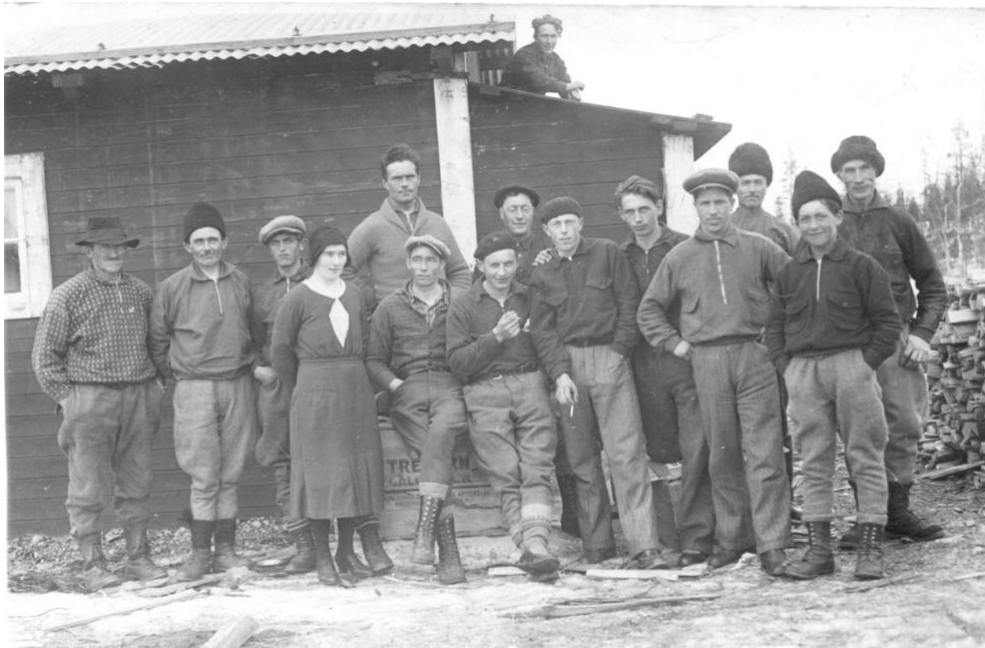
Skogsarbetare vid en koja på 1950-talet.

Kocklag vid timmerkoja av bättre slag, verkar vara ett boningshus med plåttak, ej vanligt på den tiden. Oftast var kojorna gamla och i dåligt skick.