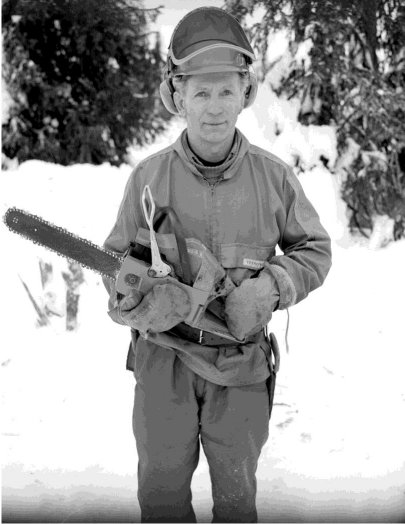
Skogsarbetare Arvidsjaur 1970.