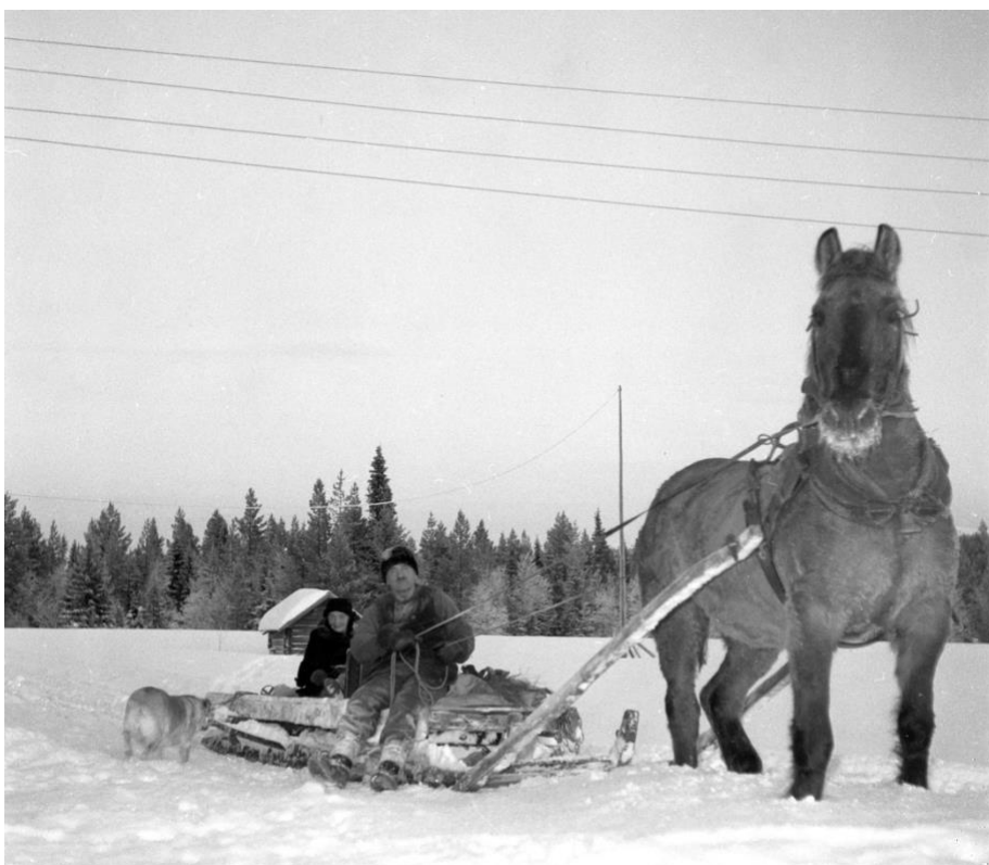
Västanås, häst och timmersläde. Foto Norran 50tal.