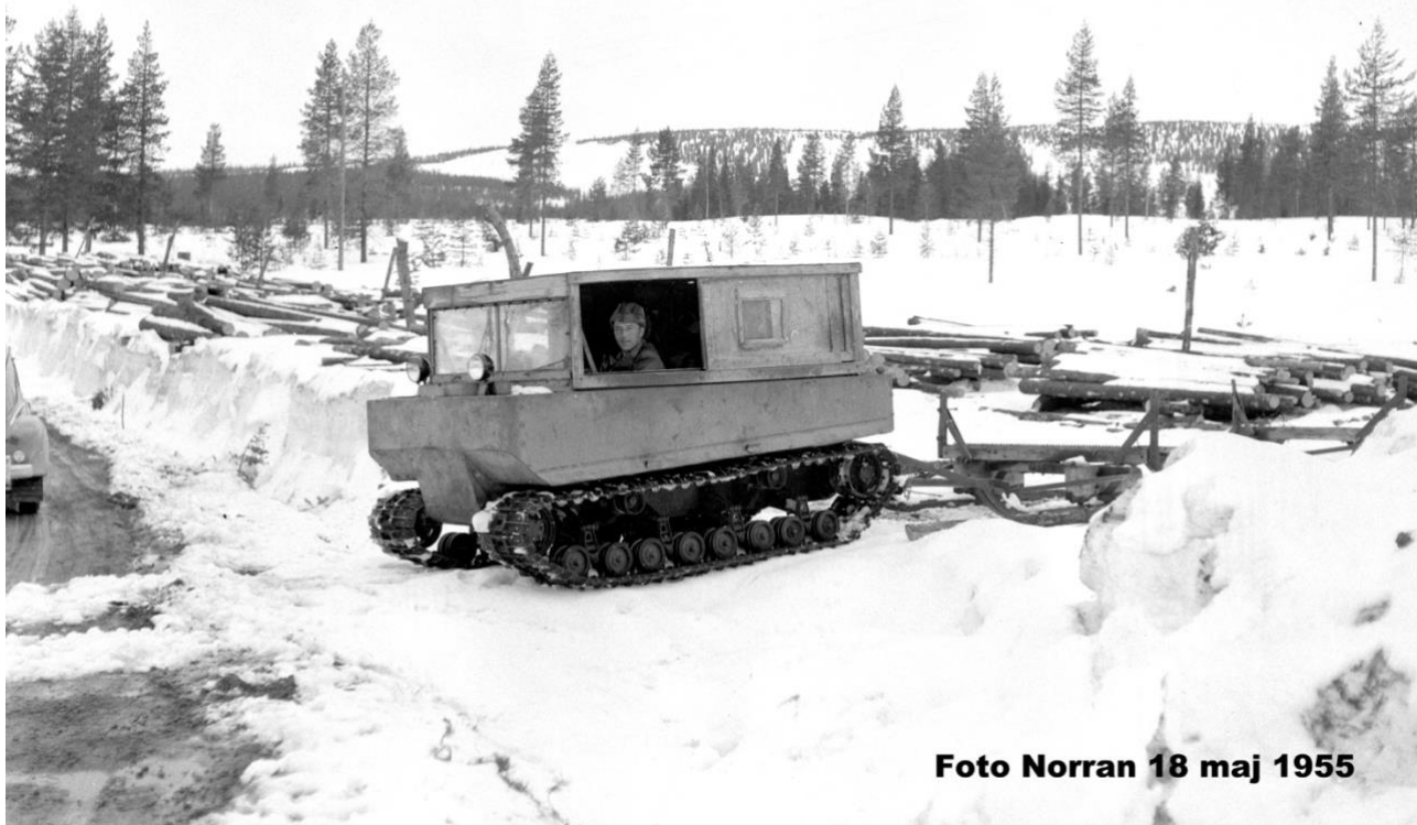
18 maj 1955