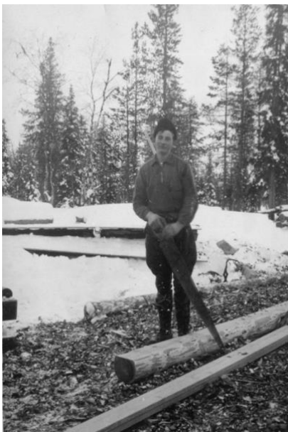
Skogsarbete med timmersvans.