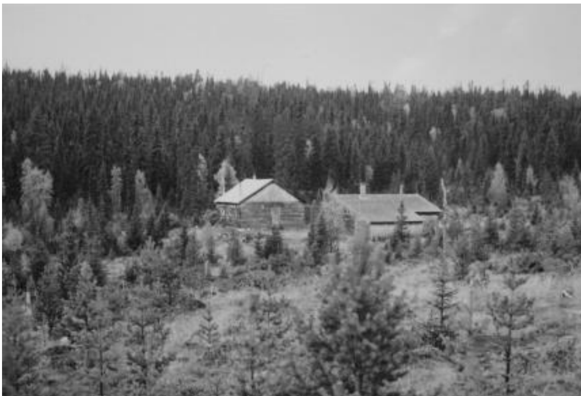
Stormyrbergskojan, Arvidsjaur Allmänning. Kojplatsen på bilden fanns i dalgången mellan Tjåkas- och Stormyrberget, nordväst om Renträsk.

Under det manuella skogsbrukets tid fram till 1960-talet hade Arvidsjaur Allmänning ett stort antal kojor och stallar för sitt skogsbruk. Det utbyggda nätet av skogsbilvägar och mekaniseringen av skogsbruket medförde att kojorna spelat ut sin roll. Under slutet av 1960-talet avvecklades de flesta kojplatserna.