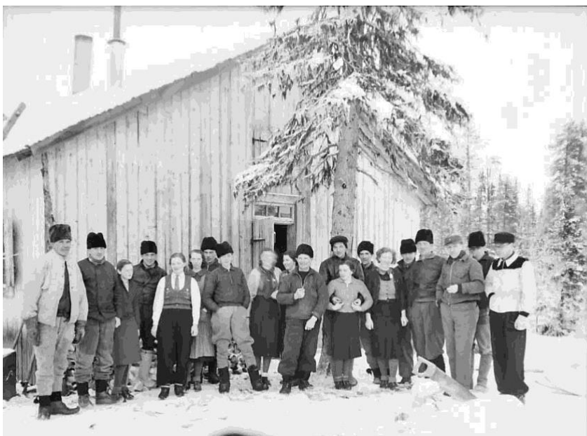
Samling utanför skogshuggarkojan 1940.