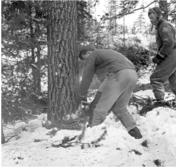
Lidmyrliden Skogskurs ca 1955.