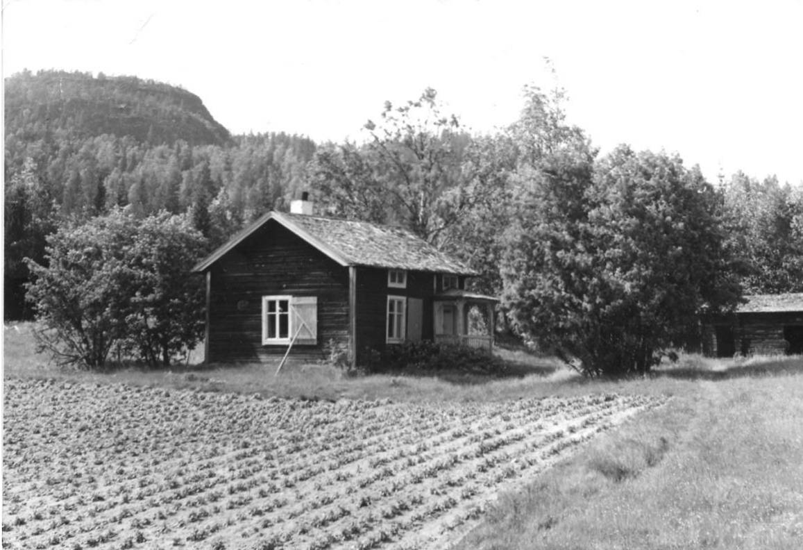
Vithattenstugan 1950-tal, på berget Vithatten, som var en gammal nybyggarplats. Ett kronatorp, senare skattetorp, som anlades 1835.