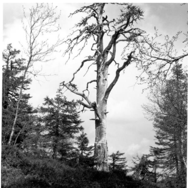
Fridlyst tall, Glommerträsk, 1957. Tallen står på berget Vithatten sydöst om Glommerträsk.

Vithatten är ett berg som ligger söder om Glommerträsk i Arvidsjaur kommun, och sydväst om Missenträsk i Skellefteå kommun. Gränsen mellan Norrbottens och Västerbottens län skär precis över bergets topp. Länsgränsen sammanfaller här även med gränsen mellan landskapen Lappland och Västerbotten. Berget, 511 meter över havet, har rykte om sig att vara hemsökt av spöken.