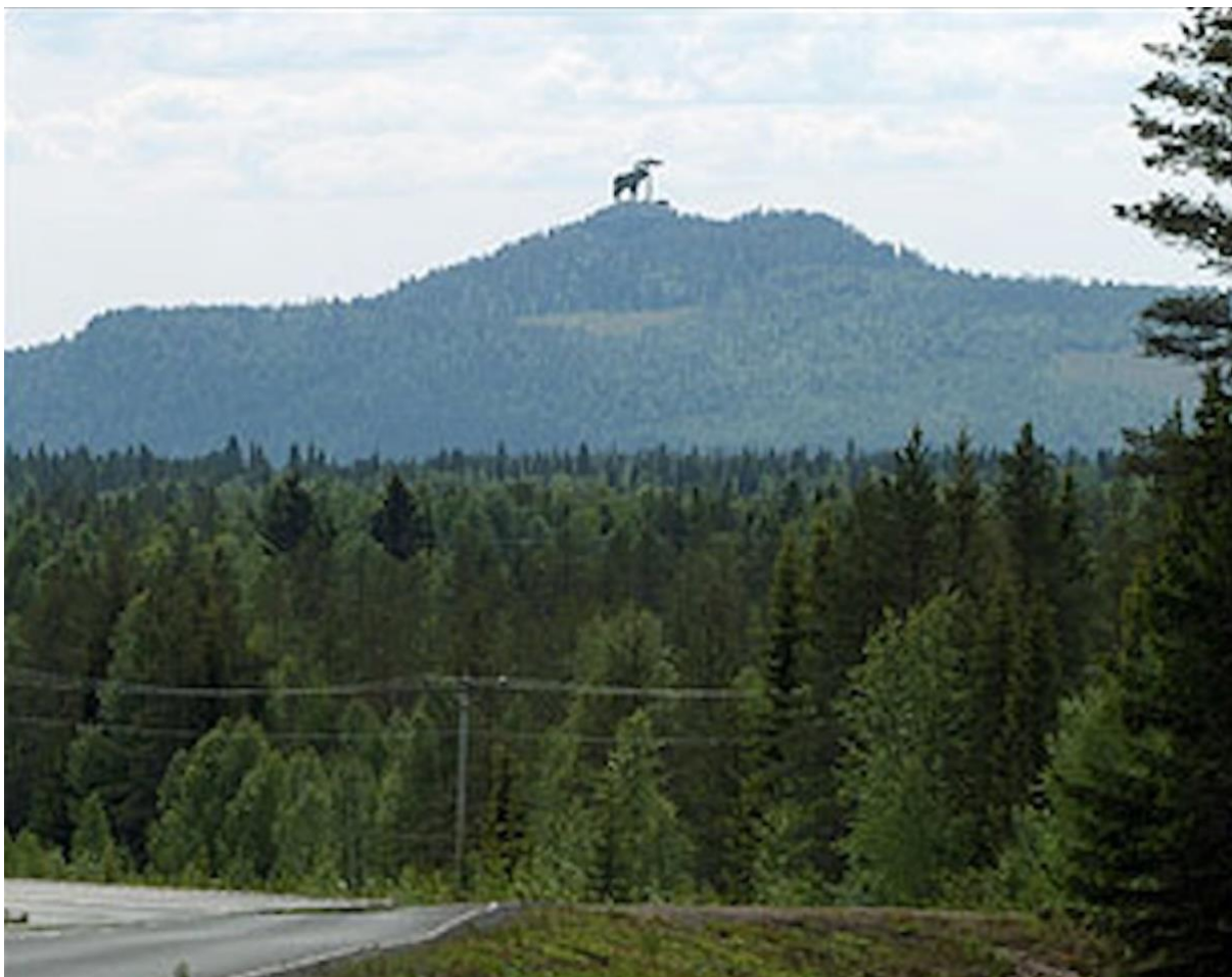
Storälgen på berget Vithatten, mellan Skellefteå och Arvidsjaur. På gränsen mellan Norr- och Västerbotten.