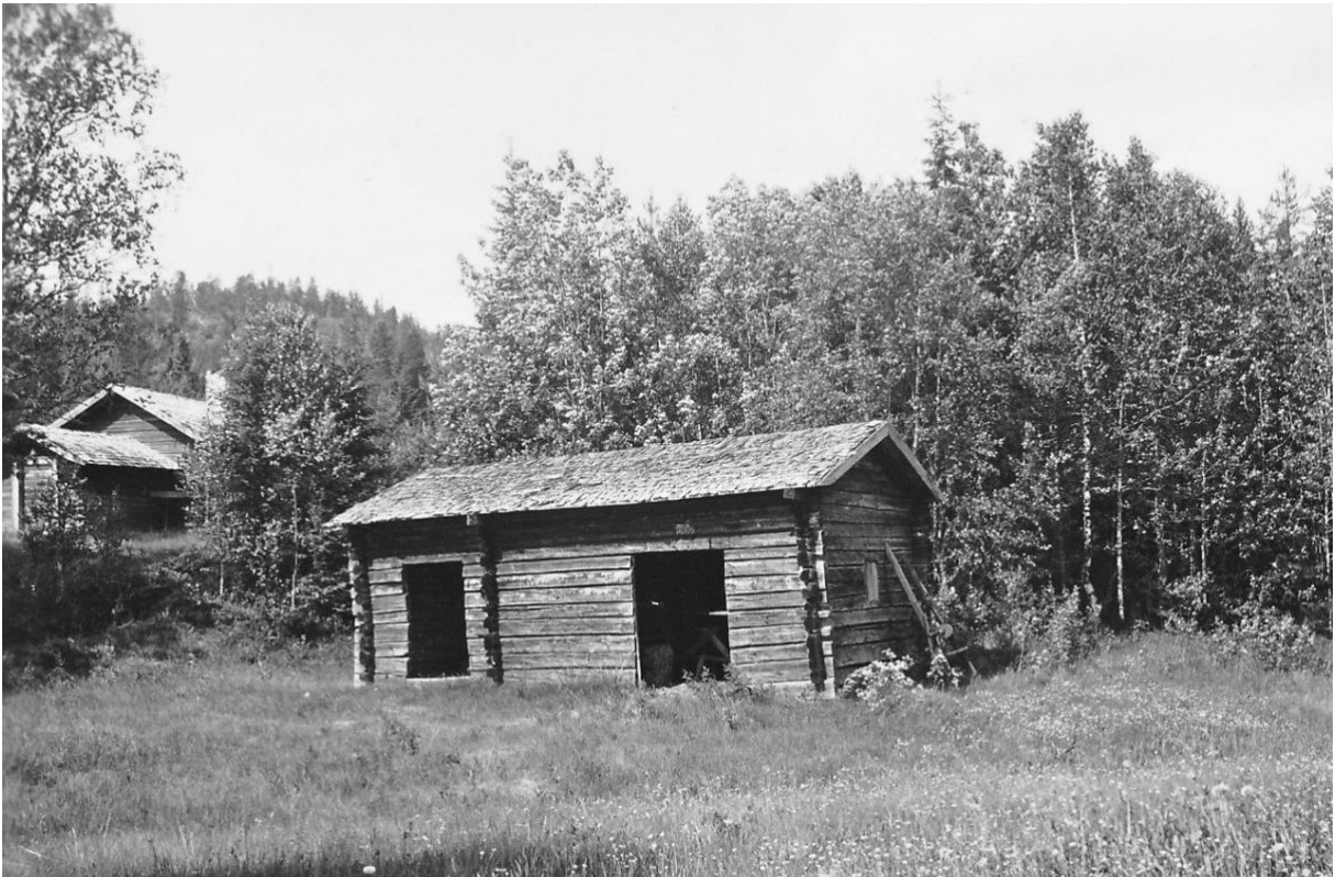
Bagarstugan på Vithatten.

1988 Bagarstugan brinner ner till grunden i augusti månad.