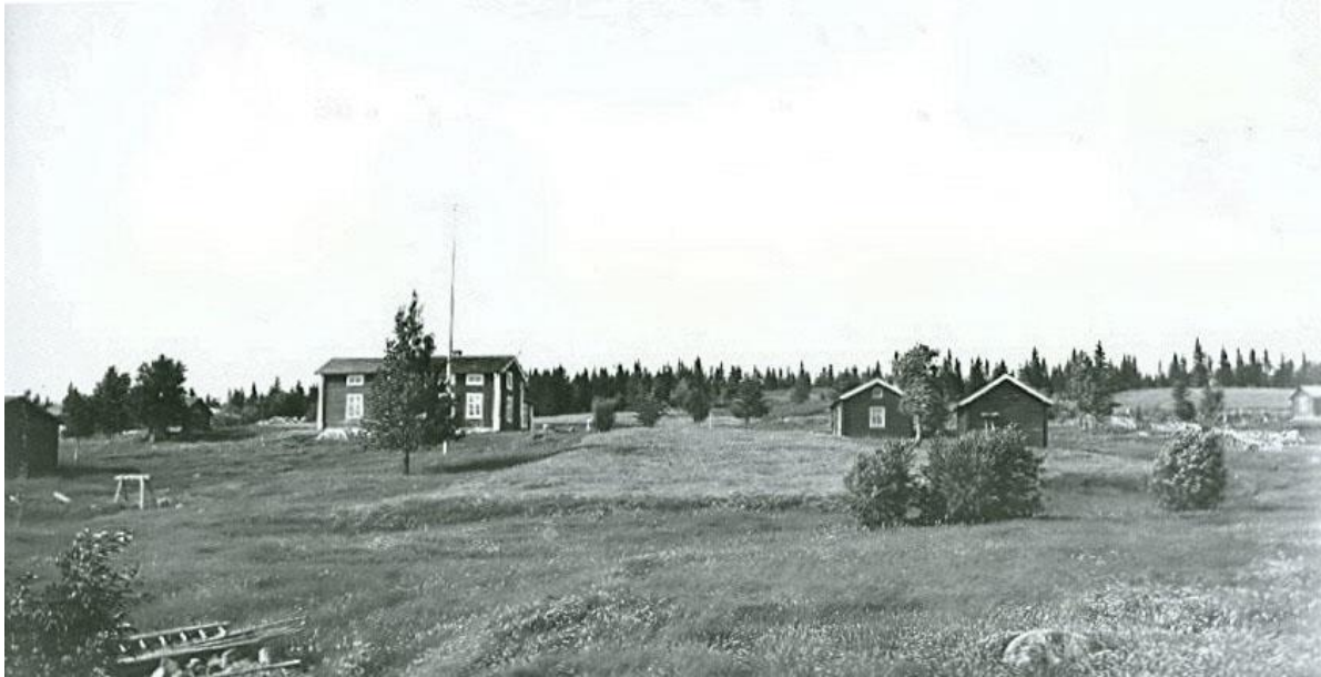
Gårdsmiljö i Grundträskliden, 1920-talet.