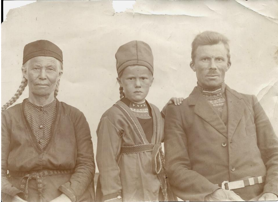
Tre generationer Stenberg, Strömudden, Västra Kikkejaur sameby, ca 1930.