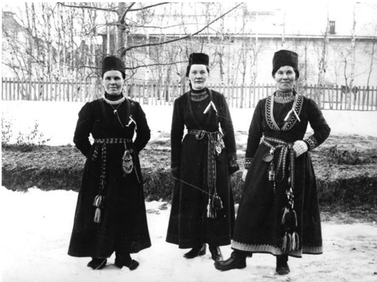
Tre av deltagarna från Arvidsjaur som deltog i Samernas Landsmöte i Östersund 1918.