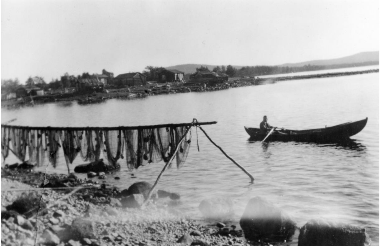
Vy mot Araksuolo anno 1900.