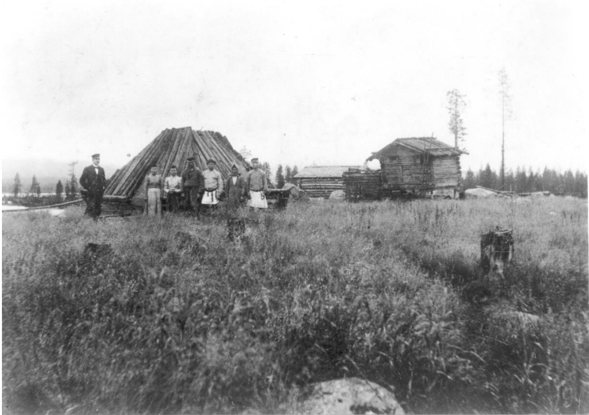
Lappkäta och härbre i Ballemtjålme (Brännvallen), Araksuolo, Västra Kikkejaur sameby i slutet av 1800-talet.