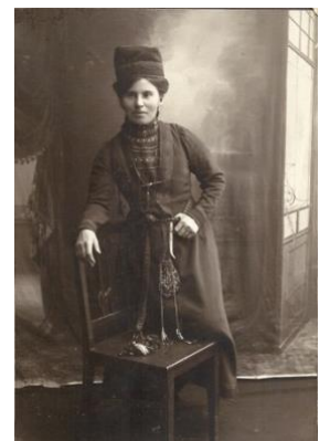
Th: "Samernas drottning" Karin Stenberg, 1884–1969, bild tagen 1914