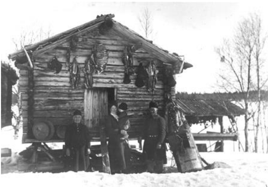
Familjen Stenberg vid ett köthärbre i Araksuolo Västra Kikkejaur. 1919.