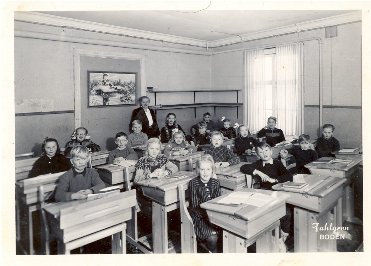
Skolkort. Klass 3 på Gamla Skolhemmet. 1947–1948. Första bänkraden från vänster framifrån: