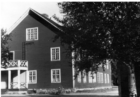
Skolhemmets östra gavel, som 1970 blev ungdomsgård. I folkmun: "UG".