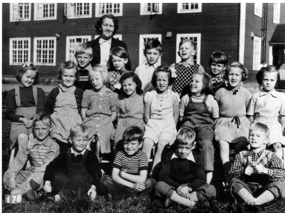
Skolhemmet, småskolans 2:a klass år 1952.

Under första hälften av 1900-talet pågick två världskrig. Länderna runt Sverige var indragna i krig. Männen i Sverige mobiliserade och kvinnorna, som på den tiden inte kunde göra militärtjänsten, kunde istället bli aktiva inom lottakåren. Senare blev det skolsal och UG, ungdomsgård innan huset revs och blev parkeringsplats bakom kommunhuset.