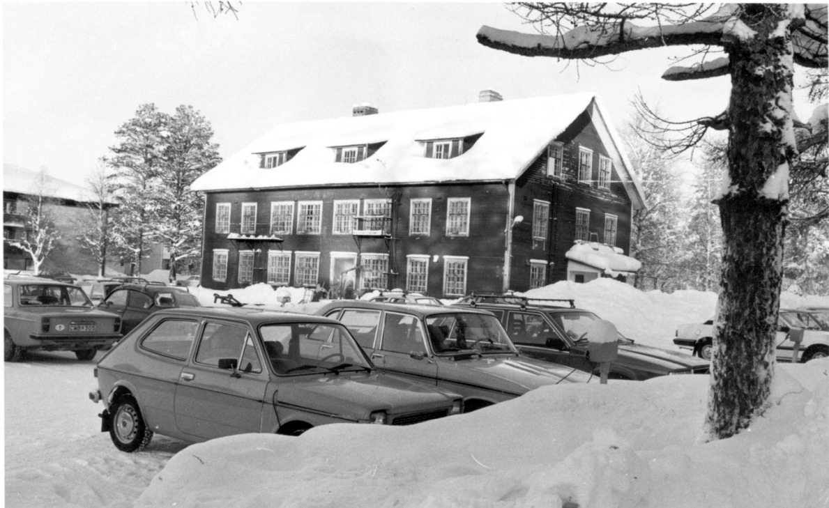
1986 I förgrunden kommunens parkeringsplats som utökades efter rivningen av gamla skolhemmet.