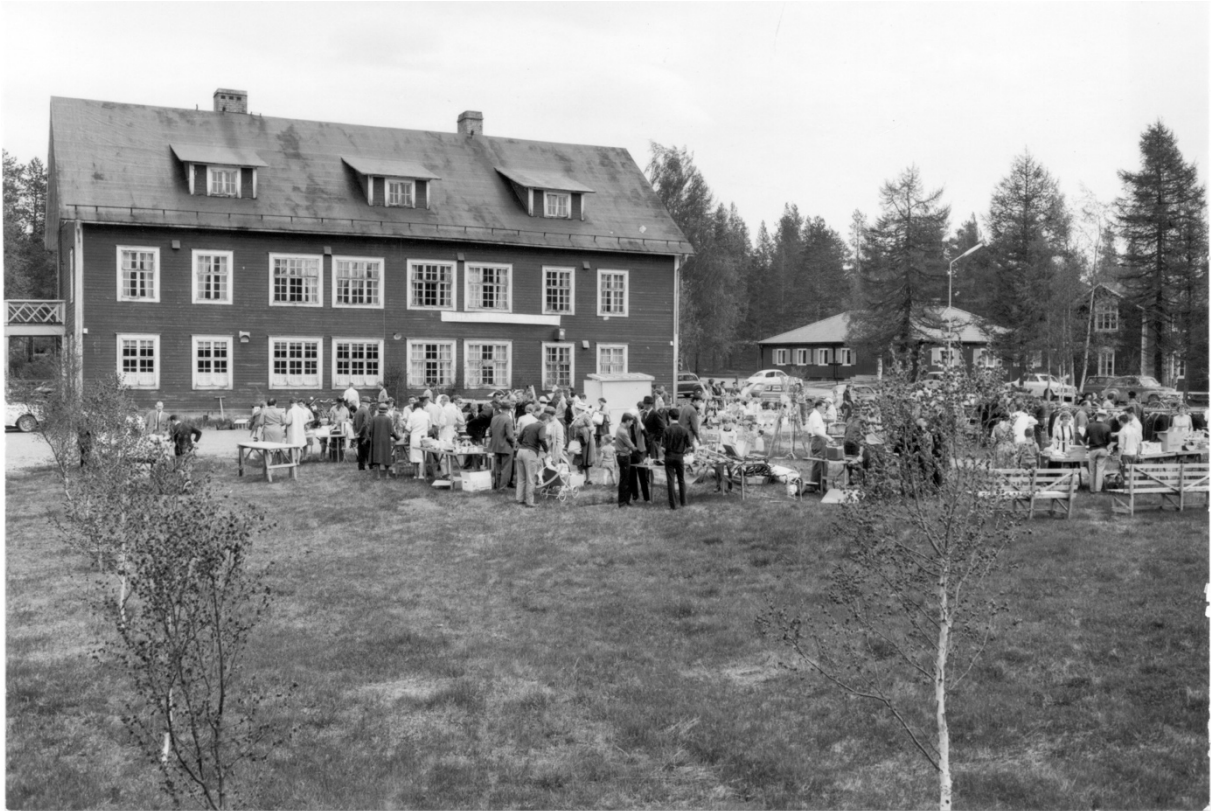
Lions håller aktion 1964 vid Alléskolan tillika gamla skolhemmet från 1923.