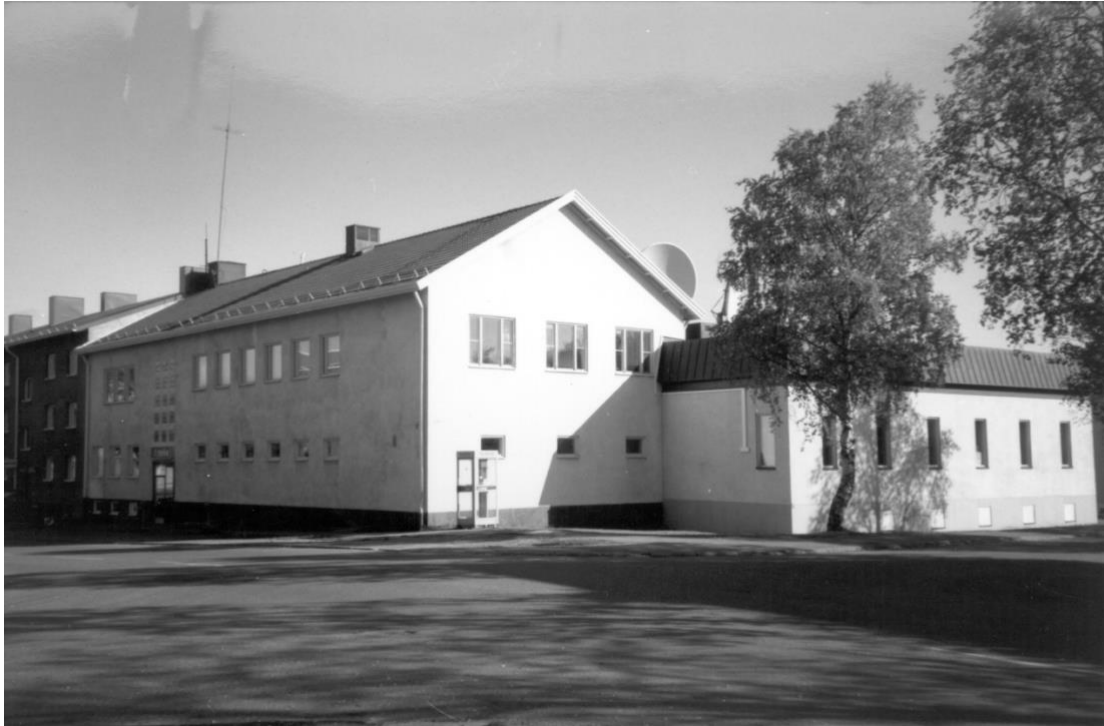
Televerket i Arvidsjaur byggdes i början av 1950-talet. Där fanns bl.a. telefonväxel och telegrafkommisariaten hade sitt tjänsterum. I angränsad lokal fanns väntrum telefonhytter och telegramrum.

Dessa specifika händelser visar hur telefonin har utvecklats och anpassats i Arvidsjaur över tid. Varje steg har bidragit till en mer sammanlänkad och tillgänglig kommunikation för invånarna.