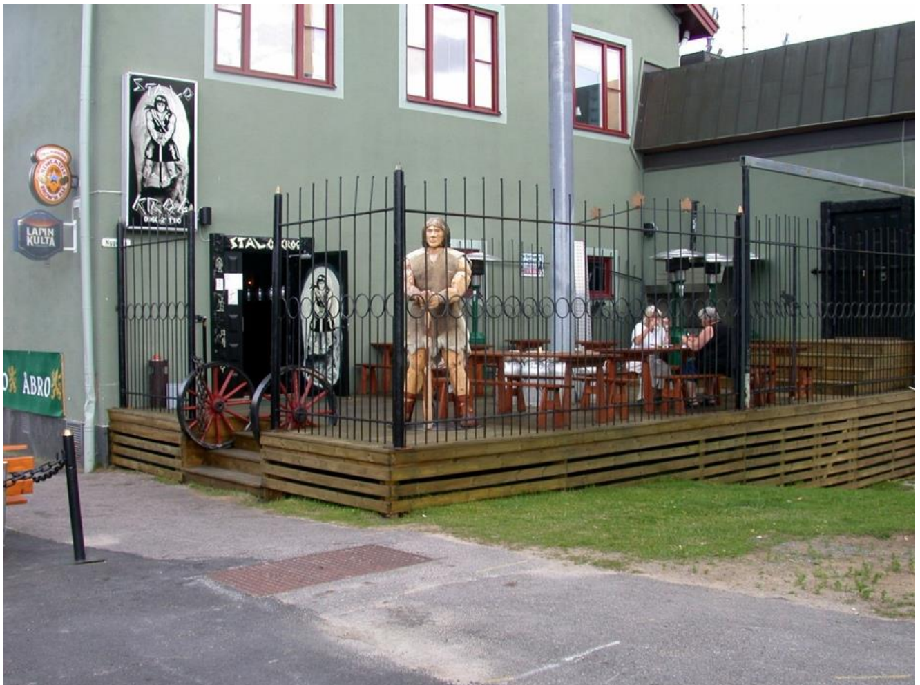
I modern tid har gamla Televerkshuset hunnit byta namn flera gånger; Teliä, restaurang Stalo, Rolles Krog, Hedberg Food on Fire...