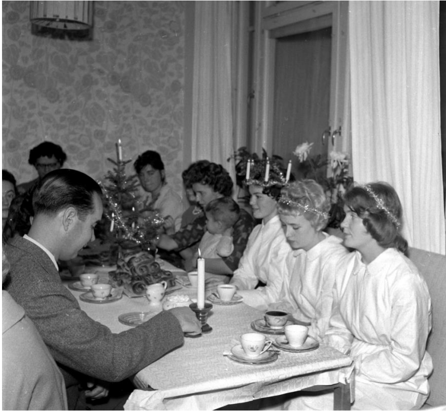
Televerkets julfest, dec 1959.