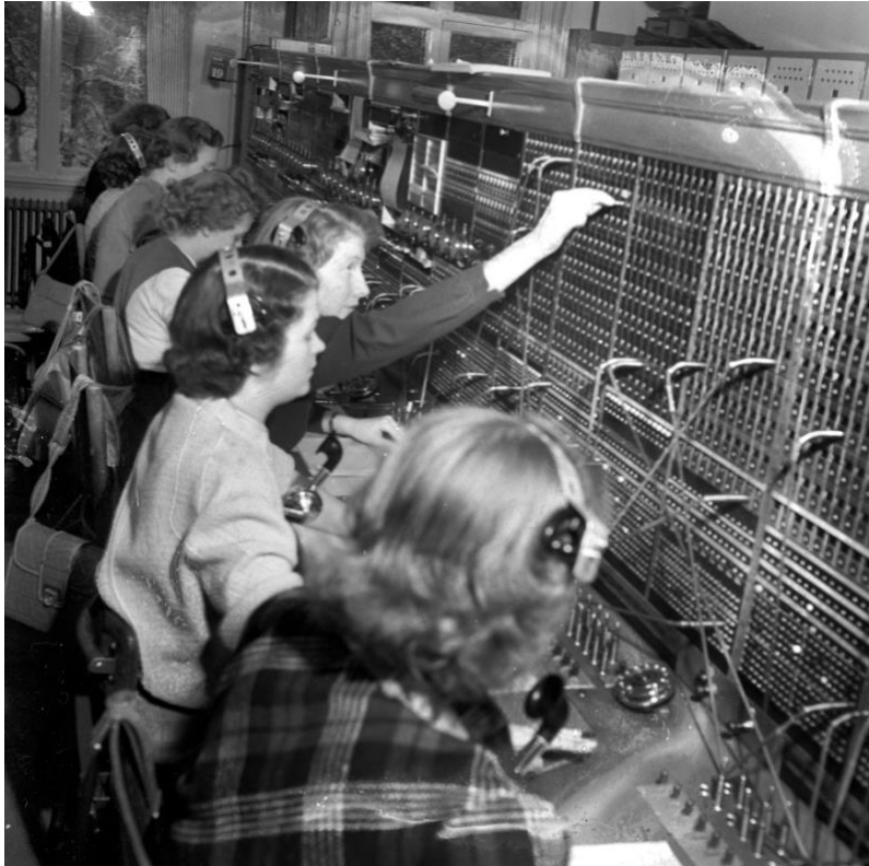
Telegrafstationen i Arvidsjaur, 1950-tal.

användningar, medan det historiska arvet fortsatt att påminna om tiden då Televerket var en central institution.