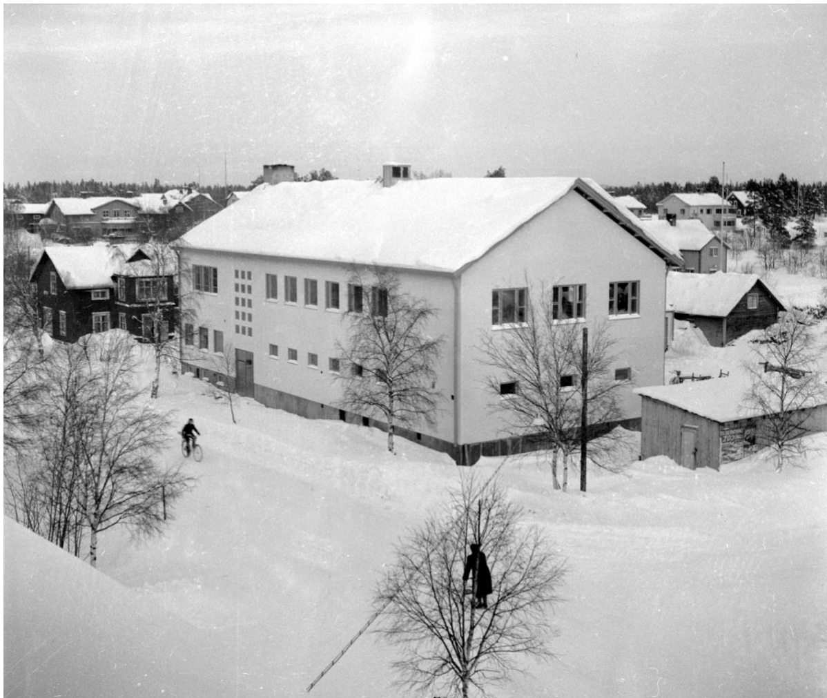
Televerkshuset, Stationsgatan 1955.