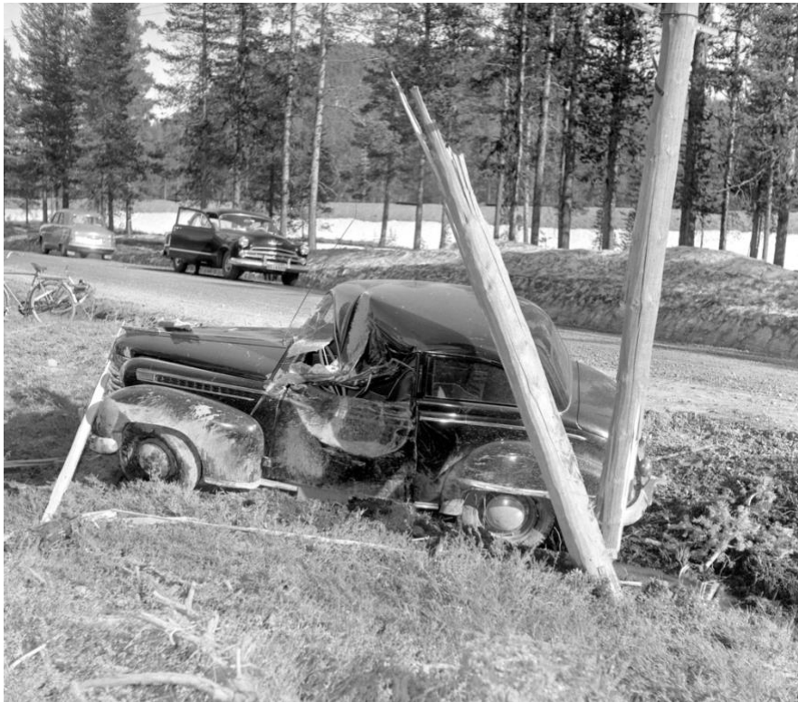
Ibland var Televerkets telefonstolpar i vägen, utanför vägen... Arvidsjaur 1955.