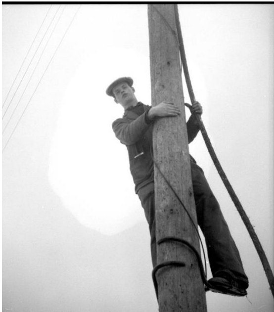
Berndt Berglund, klättrar med stolpskor uppför telefonstolpe.