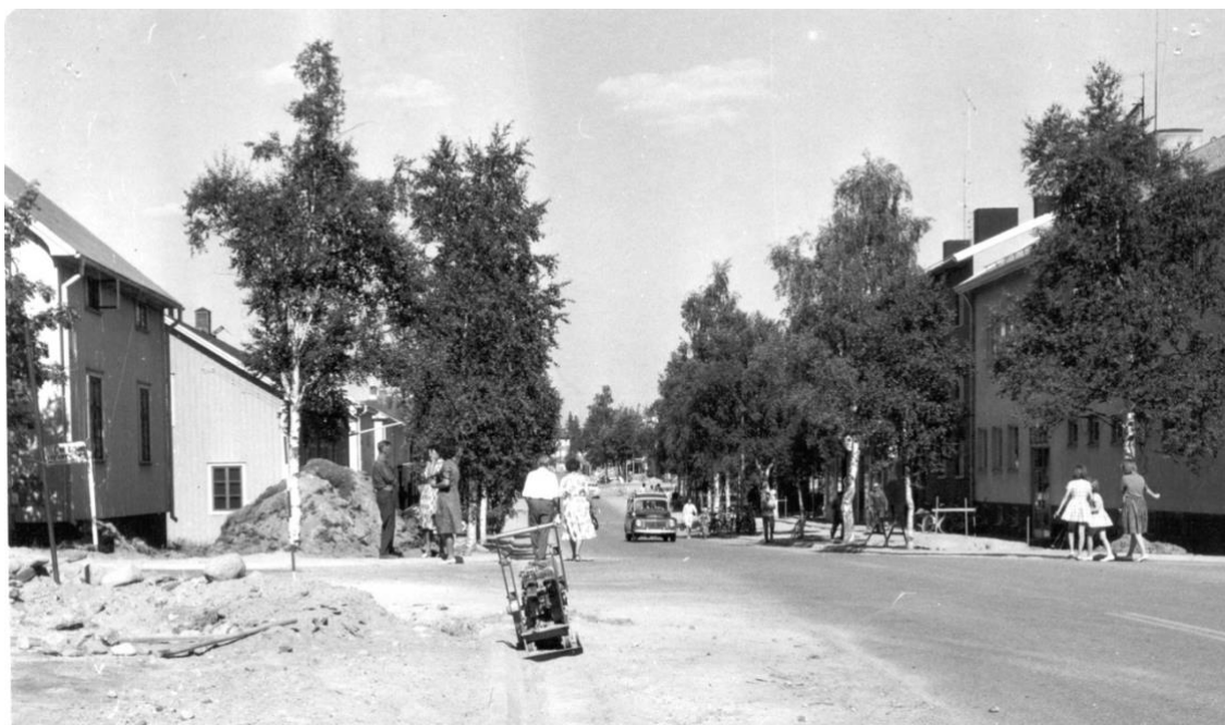
Stor gatuombyggnad i slutet av 1950-talet. Trottoarer längs Stationsgatan under byggnad. Till vänster: Steinvalls och gamla Föreningshuset på kvarteret Lommen. Till höger skymtar Televerket och längre ner på samma sida Tempohuset (2025: kafé Tant Sveas), på kvarteret Bofinken.