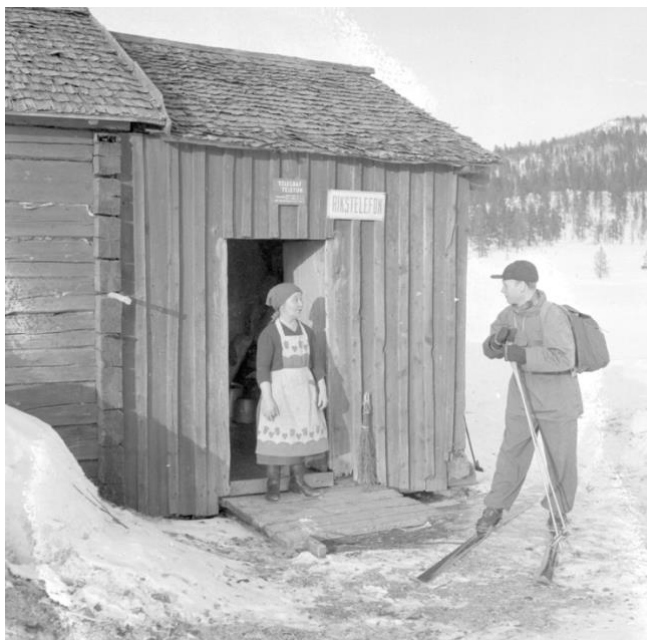
Rikstelefon i Adolfström får besök från Televerket i Arvidsjaur. Foto NV apr 1955.

I markplan hade telearbetare sina lokaler. Byggnaden såldes till Aptions fastigheter som bland annat hyrt ut till Telia och dataföretag. Huset såldes 2001 till Bo Bra fastigheter.