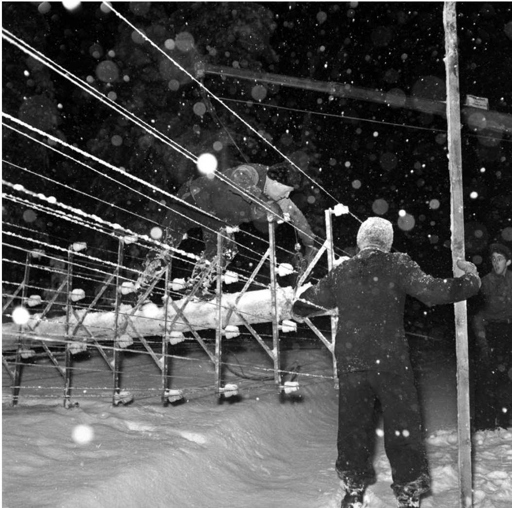
Ute i ur och skur. Telestolpar rasade i Backåker. dec 1956.