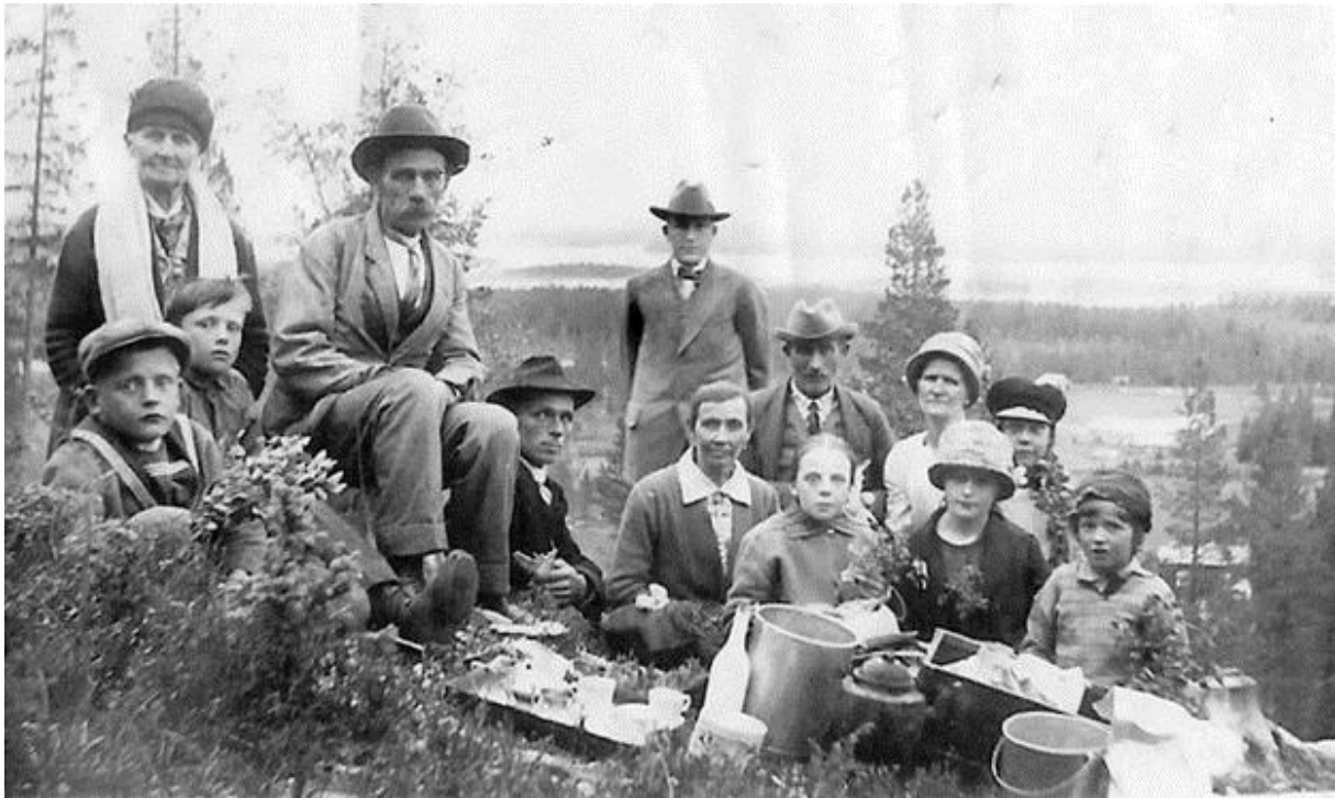
Midsommarfirande på Tallberget Vuotner, 1922.