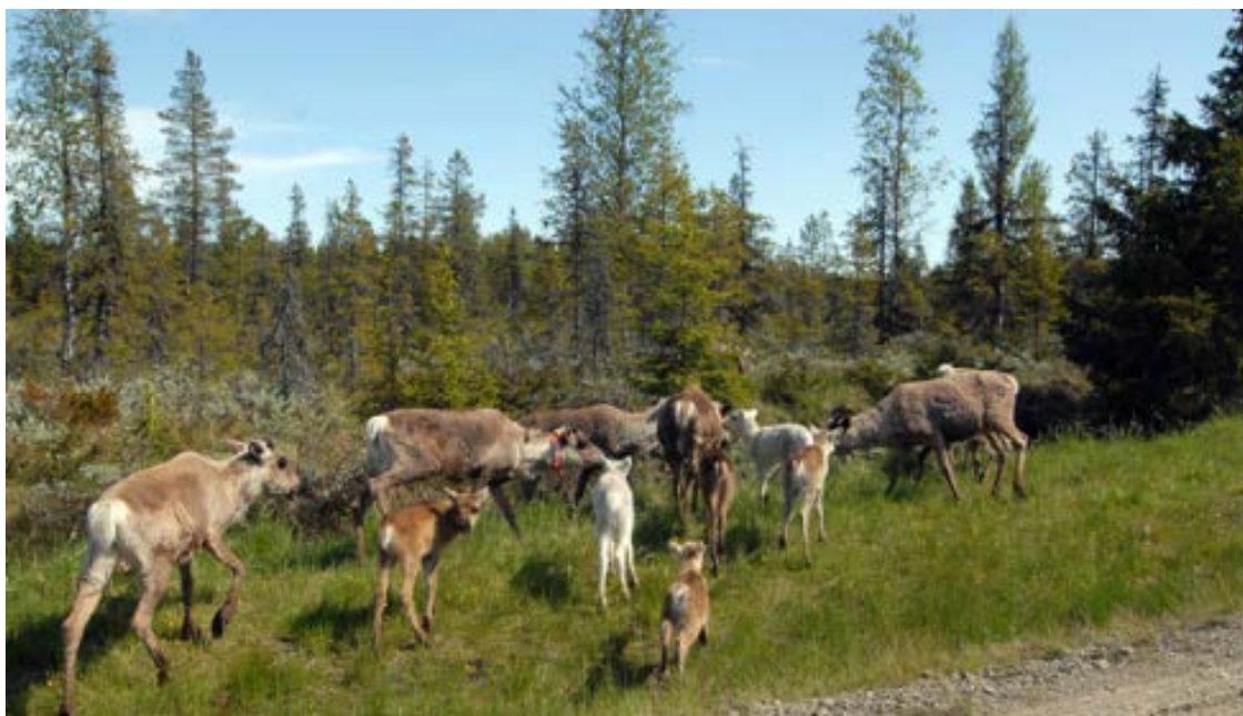
Figur 2. Renar

Arvidsjaur kommun utgör sameland. Rennäring bedrivs här året runt. Ett minskat renbete har allteftersom försämrat förutsättningarna för renskötseln. Under senare år har problemen inom förvärrats genom den ökade rovdjursstammen. Stor del av renkalvarna blir byte för rovdjuren. Åtgärder behöver vidtas för att långsiktigt säkra renskötseln.