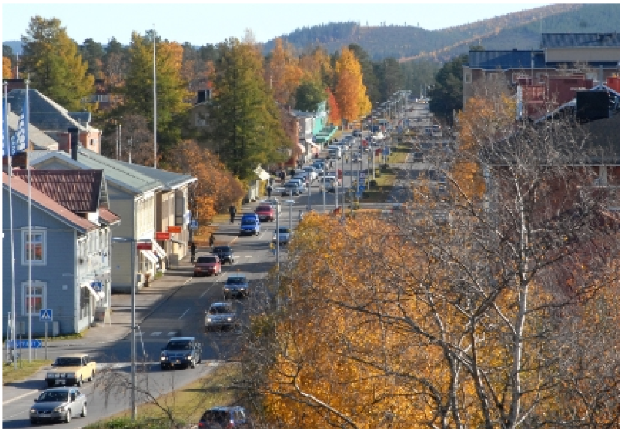
Figur 1. Storgatan i Arvidsjaur

Historiskt har människan tenderat att bilda samhällen för att tillsammans bidra till en säkrare existens. Urbaniseringen har fortsatt till våra dagar. I dag bor de fler människor i städer än på landsbygden. En allmän bedömning är att urbaniseringen kommer att fortsätta även om den kan ändra karaktär.