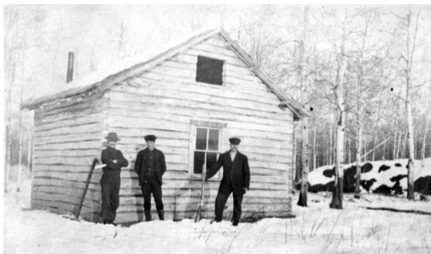
Pelles (mitten) första hus i Kanada.

"Dagen efter gick jag ut på stan och hade kunnat få arbete direkt. Men då mötte jag två värnpliktiga från samma regemente som mig i Östersund. De lånade mig pengar och skulle åt samma håll som jag tänkt mig, dit många från Moskosel rest något år tidigare".