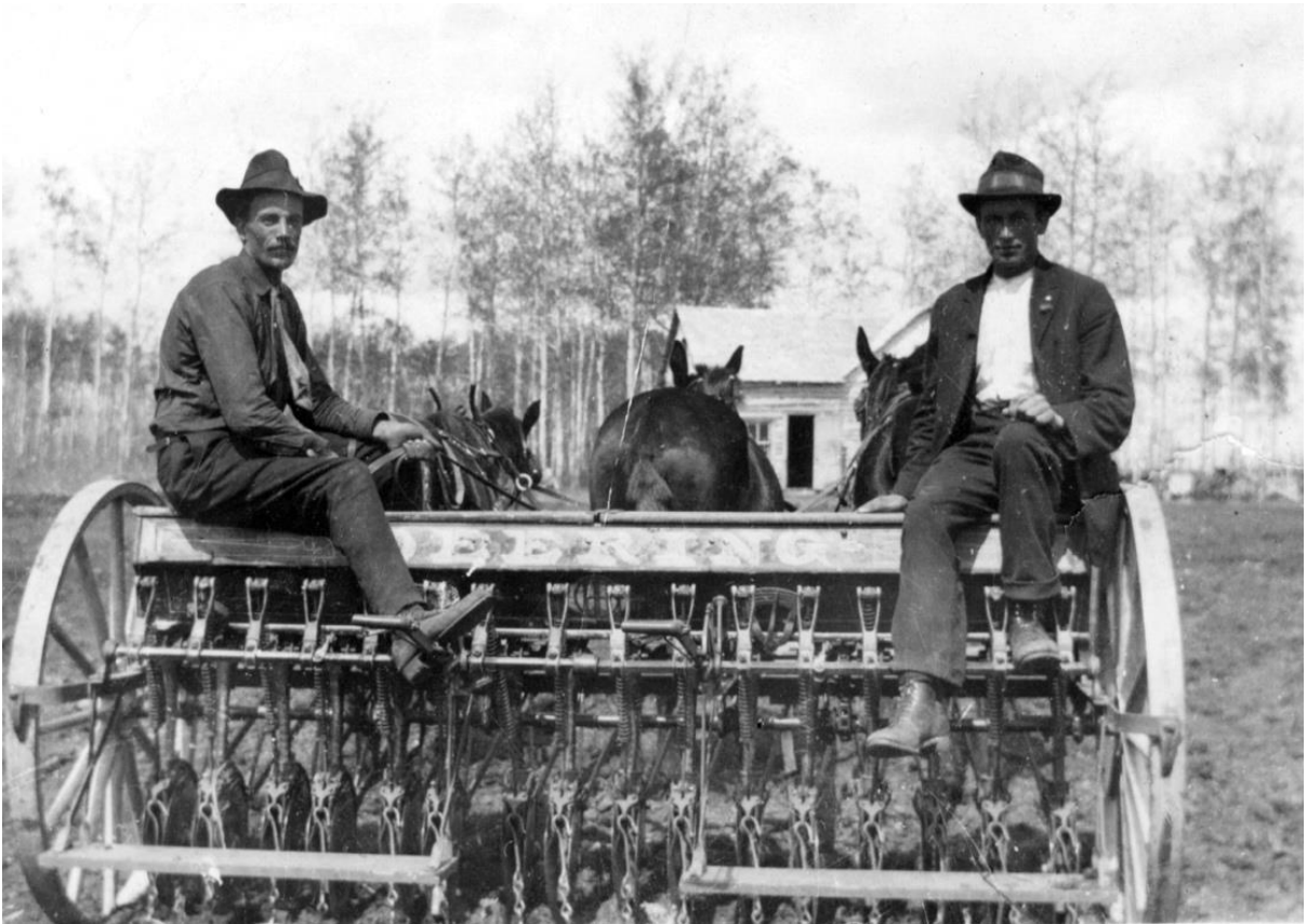
Pelle till vänster på harven.