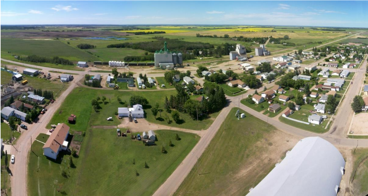
Canwood i modern tid. Ca 350 invånare. Pelle Persson var en av nybyggarna som bidrog till bys tillkomst.