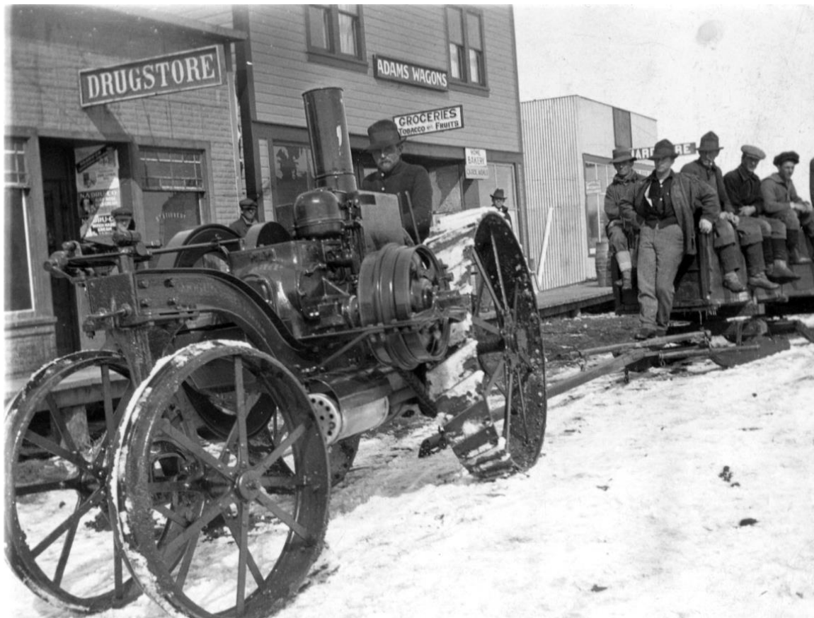
Traktorskjuts in i "staden".

"Dagen efter gick jag ut på stan och hade kunnat få arbete direkt. Men då mötte jag två värnpliktiga från samma regemente som mig i Östersund. De lånade mig pengar och skulle åt samma håll som jag tänkt mig, dit många från Moskosel rest något år tidigare".