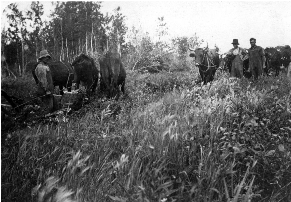
Canwood, Kanada. Vägar och mark röjdes och plöjdes från grunden i detta nybyggarland.

Där var absolut bara nybyggarland när vi började, ont om skog och stenig mark. Men efter att vi röjt upp för att kunna ploga, visade det sig vara en otrolig jordmån av svartmylla. Det gav goda skördar av vete och havre, utan att behöva gödsla. Oxar används oftast som dragare. De var rätt lata av sig kan jag lova. VILLEBRÅD som harar, hjortar och älgar fanns det gott om, så vi behövde aldrig lida brist på kött. Det var dock långt att åka om man ville fiska.