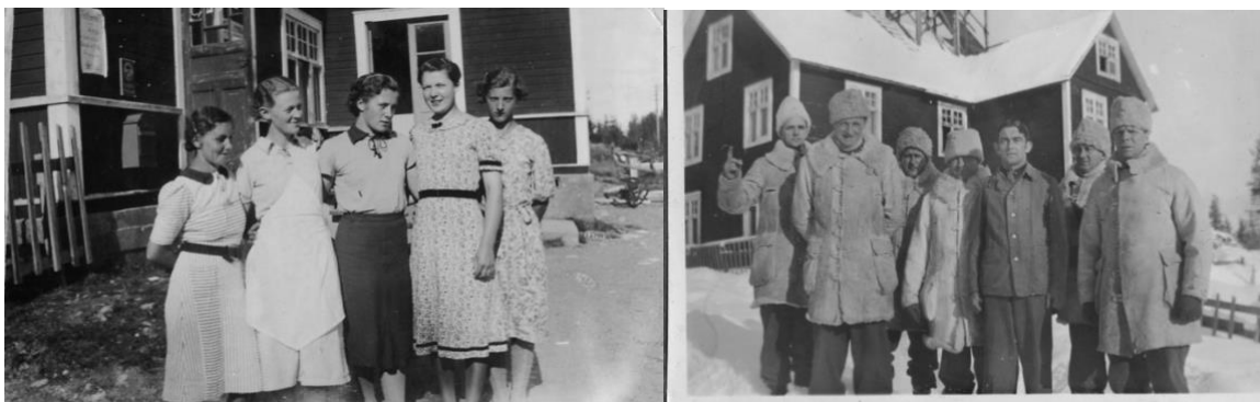
Luftbevakningsstyrkor i Auktsjaur, 1940-talen. Luftbevakningstornet skymtar på husets tak.

Kriget utkämpades mellan de allierade och centralmakterna efter mordet på ärkehertig Franz Ferdinand. Kriget kännetecknades av skyttegravskrig, enorma förluster och nya vapen. Det slutade med de allierades seger, flera imperiers fall och politiska förändringar som bidrog till andra världskriget.