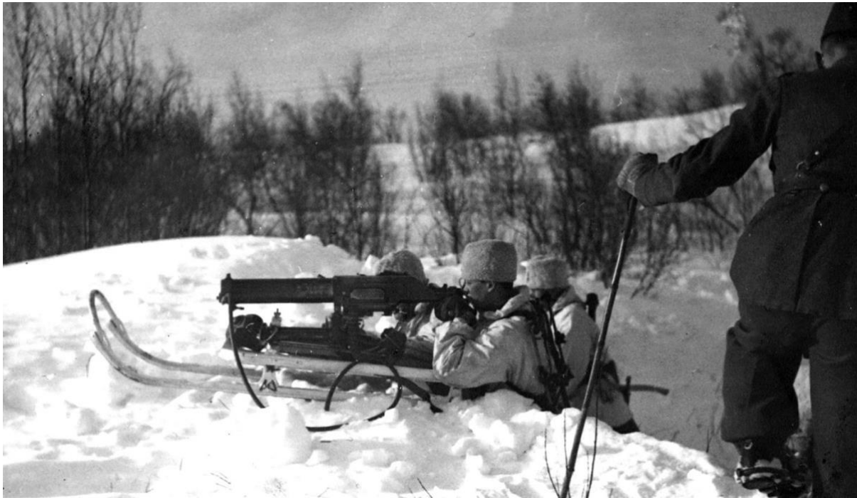
Krigstid i Sverige, övning. ca 1939.