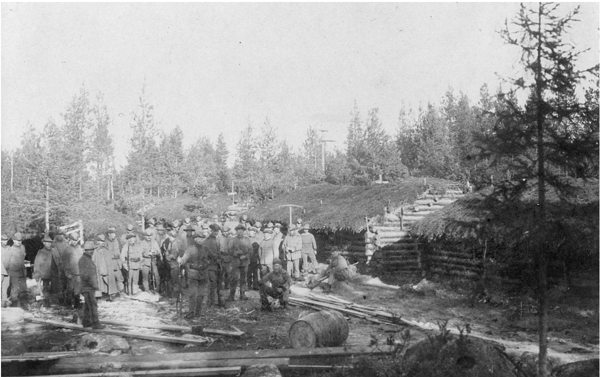
Första mobiliseringen av svenska Landstormen, inför första världskriget 1914.

Första världskriget har just brutit ut och alla svenska krigsplacerade män blev inkallade över hela Sverige. Kompaniets förläggning i Arvidsjaur syns i bakgrunden.