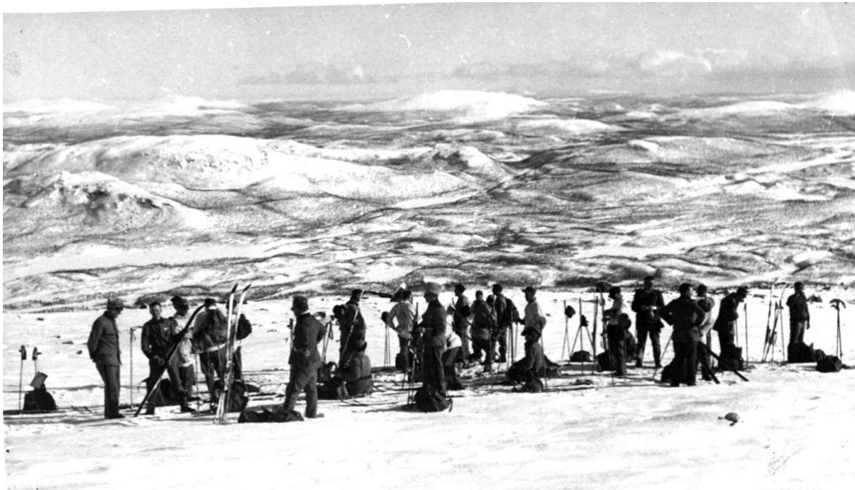
Beredskapsövning 1940 i fjällen, under andra världskriget.