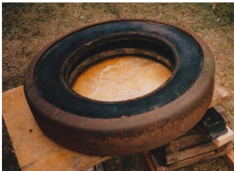
Detta lastbilsdäck tillhörde åkare Sigurd Backlund, Varjisträsk. Däcken förstärktes med metall, på grund av att det rånade gummibrist under 2:a världskriget. Däcket finns nu på Vägverkets museum i Borlänge.