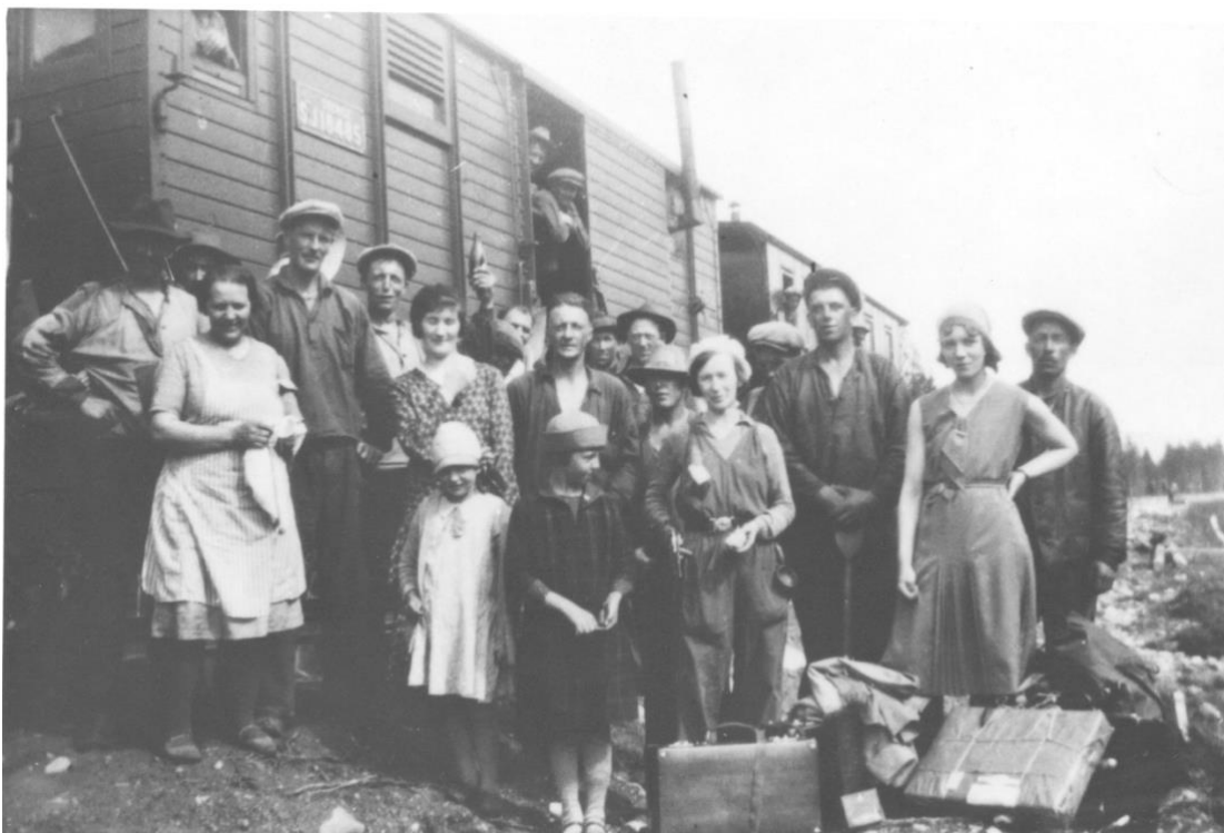
Finska flyktingar under andra världskriget, 1944. En stor ström av finska flyktingar kom till norra Sverige hösten 1944. En del stannade och bildade familj i Sverige, andra återvände till fäderneslandet.

Andra världskriget härjade 1939–1945. När tyskarna förstod att de hade förlorat kriget 1944, brände de gårdar längs Torneälven på den finska sidan. Finska män deltog i kriget och kvinnor, barn och äldre män flydde över älven till Sverige och kom till Norrbottens inland med tåg, bl.a. till vår kommun.