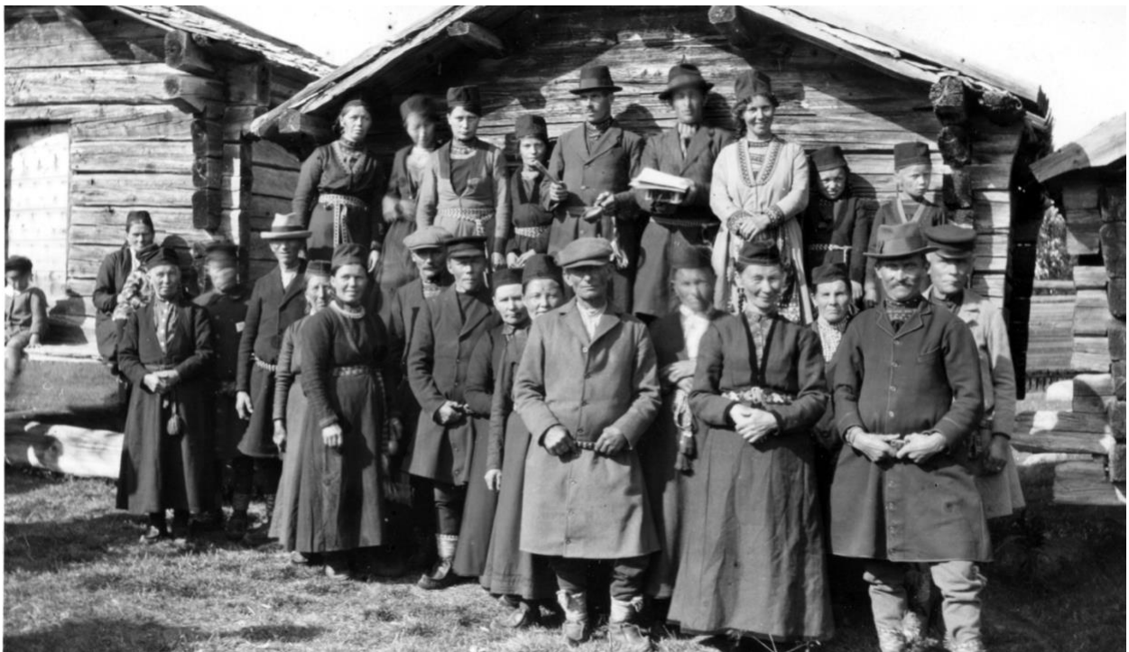
Sameföreningens årsmöte i Lapptaden, 1920.