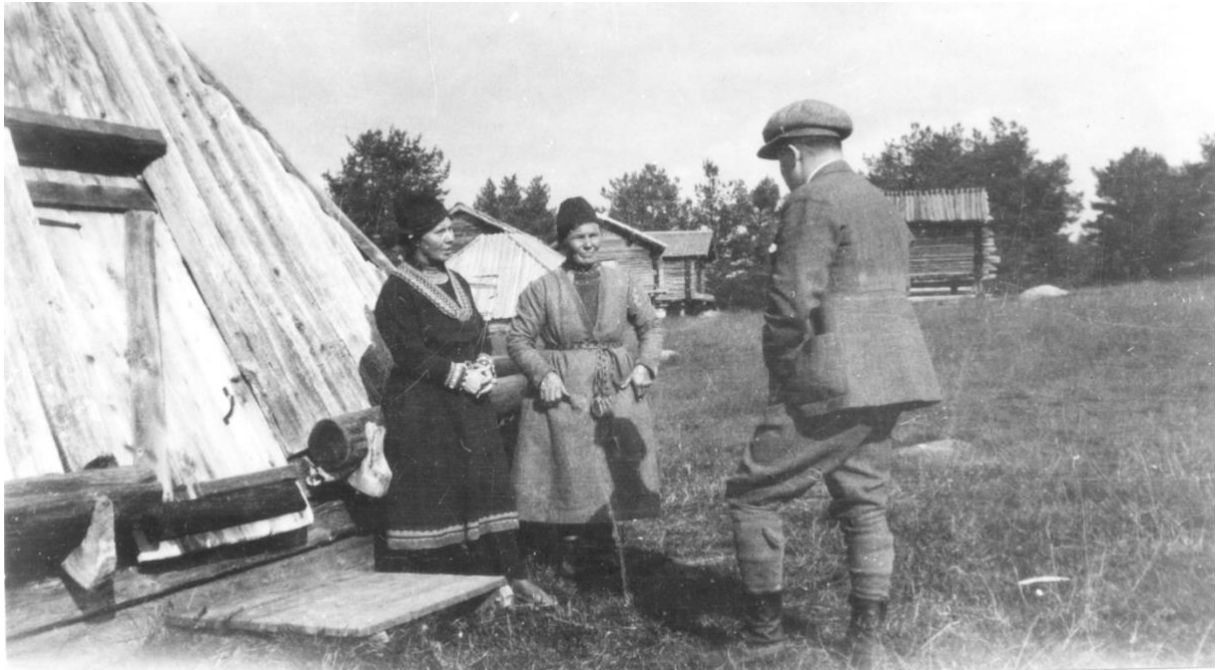
1948 fick "Lappstan" slutligen status som byggnadsminne – ett beslut som inte hade varit möjligt utan hennes envisa och långsiktiga arbete.