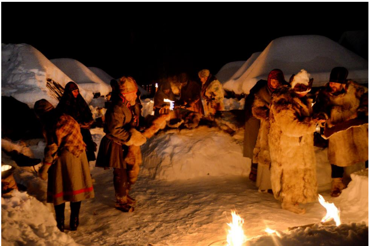
Filminspelning i Lappstaden. Foto Kent Norberg 2016.