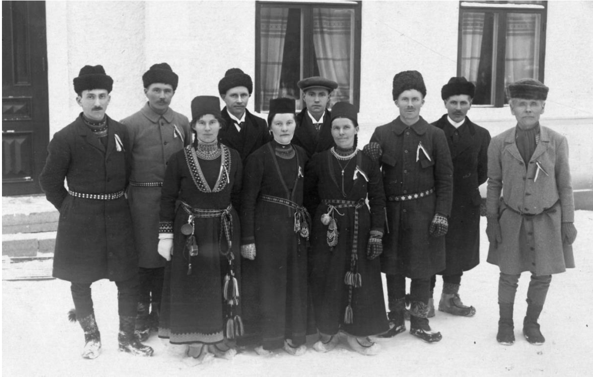
Gruppen vid Samernas Landsmöte 1918 i Östersund.